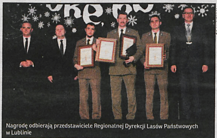
Nagrodę odbierają przedstawiciele Regionalnej Dyrekcji Lasów Państwowych w Lublinie

Wyróżnienia „Dobre, bo białskie” przyznawane są przedsiębiorstwom, instytucjom państwowym i samorządowym,