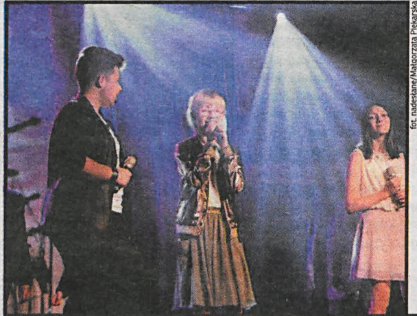
Nieczęsto zdarza się, by w jednym koncercie wystąpiło tak szerokie spectrum wychowanków „Chwilki”