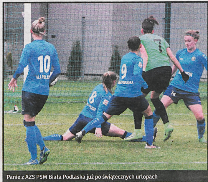
Panie z AZS PSW Biała Podlaska już po świątecznych urloпах