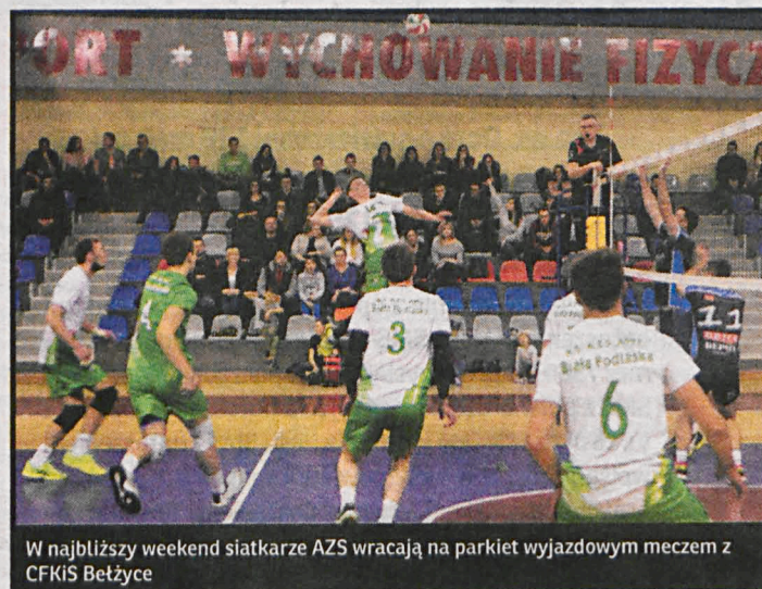
W najbliższy weekend siatkarze AZS wracają na parkiet wyjazdowym meczem z CFKis Bełżyce