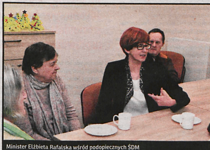
Minister Elżbieta Rafalska wśród podopiecznych ŚDM

– Jestem pod wrażeniem, to bardzo funkcjonalny obiekt. Najlepsze są właśnie takie inicjatywy stworzone wspólnie z samorządem. W kraju do tej pory powstało już blisko 800 takich domów, gdzie przebywa 29 tys. uczestników. W tym roku przeznaczamy na ten cel 70 mln zł – powiedziała po oficjalnym otwarciu minister Elżbieta Rafalska. Dariusz Stefaniuk podziękował wszystkim, którzy przyczynili się do powstania tej placówki, a przede wszystkim