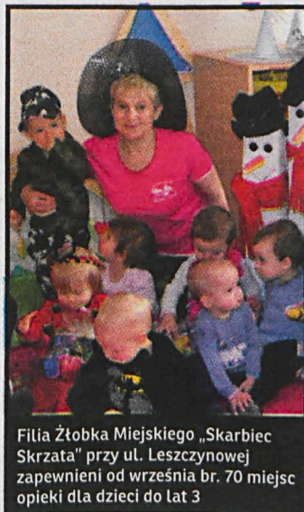
Filia Żłobka Miejskiego „Skarbiec Skrzata” przy ul. Leszczyńskiej zapewni od września br. 70 miejsc opieki dla dzieci do lat 3

Fundusze ministerialne pochodzą z programu Maluch plus 2018, ogłoszonego pod koniec października ubiegłego roku. Bialski żłobek stanął przed trudnym zadaniem sporządzenia niezbędnej dokumentacji zaledwie w miesiąc. Filia Żłobka Miejskiego „Skarbiec Skrzata” przy ul. Leszczyńskiej zapewni 70 miejsc opieki dla dzieci w wieku do lat 3. Na potrzeby filii żłobka w Zespole Szkół Ogólnokształcących nr 2 zostanie przeznaczonych 9 sal lekcyjnych, 2 toalety,