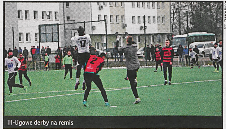
III-ligowe derby na remis

Pogoń Siedlce 0:1, Wisła Puławy 1:4, Podlasie Biała Podlaska 1:1, 10.02 – Lublinianka, 17.02 – Victoria Sulejówek, 24.02 – Chełmianka Chełm, 3.03 – Lewart Lubartów