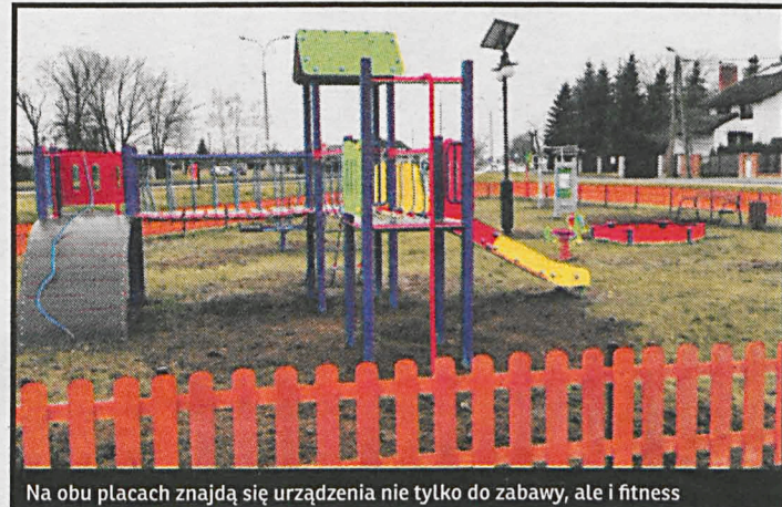
Na obu placach znajdują się urządzenia nie tylko do zabawy, ale i fitness

Z inicjatywy stowarzyszenia „Razem dla Parczewa” przy zbiegu al. Jana Pawła II i ul. Sienkiewicza, oraz przy ul. Prostej powstają nowe place zabaw z urządzeniami fitness. Środki na budowę w wys. 185 tys. zł. stowarzyszenie pozyskało z projektu złożonego w konkursie Lokalnej Grupy Działania „Jagiellońska Przystań” w ramach Programu Rozwoju Obszarów Wiejskich na lata 2014 – 2020. Ponieważ dofinansowanie PROW polega na refundacji poniesionych kosztów, społecznicy zwrócili się z prośbą do burmistrza Parczewa o pomoc w pozyskaniu środków. Burmistrz stał się orędownikiem pomysłu uzyskania pożyczki z UM Parczew, na którą to zgodę wyrazili radni podejmując stosowną uchwałę. W ramach projektu powstają 2 place