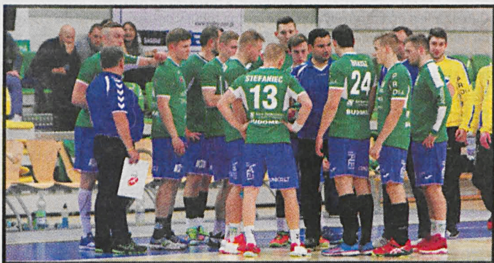
Białczanie odnieśli trzecie z rzędu wyjazdowe zwycięstwo

AZS AWF: Adamiuk, Chmurski, Kozłowski – Wołyncew 7, Stefaniec 6, Ziółkowski 4, Urbaniak 3, Kruczkow 3, Kandora 3, Warmijak 2, Banaś 2, Bekisz 1, Nowicki