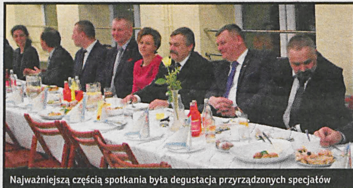
Najważniejszą częścią spotkania była degustacja przyrządzonych specjalności