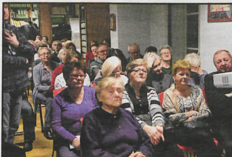
W Białej Podlaskiej wciąż przybywa osób zainteresowanych dziejami naszego miasta i regionu

Prelegent przedstawił historię tego rodu i dwóch jego rezydencji: zamku w Nieświeżu i zamku w Białej Podlaskiej. Zamek w Nieświeżu wybudowano w latach 1582-1604 na ruinach dawniejszych fortyfikacji na zlecenie Mikołaja Krzysztofa Radziwiłła, zwanego Sierotką. Liczne przebudowy, które miały miejsce w późniejszych latach spowodowały, że zamek łączy cechy architektury renesansowej, barokowej, klasycystycznej i neogotyckiej. Jego największy rozkwit przypadł w okresie Radziwiłłów „Rybenki” i „Panie Kochanku”. Przechowywano tu archiwum Wielkiego Księstwa Litewskiego. W drugiej poł. XVIII w. biblioteka zamkowa posiadała największy księgozbiór prywatny na ziemiach Rzeczypospolitej, liczący ponad 20 000 woluminów. W galerii obrazów znajdowało się ponad 980 dzieł. W zamku zgromadzone były także m.in. unikatowe kolekcje broni i numizmatów. Radziwiłłowie mieszkali w zamku do 1939 r. Po II wojnie światowej w mieście się tam sanatorium. W 1994 r. zespół zamkowy został uznany przez władze białoruskie za narodowy pomnik historii i kultury, w 1997 r. rozpoczęto restaurację zamku. W 2001 r. zespół zamkowy został prze-