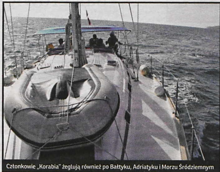
Członkowie „Korabia” żeglują również po Bałtyku, Adriatyku i Morzu Śródziemnym

Sekcja Żeglarska „Korab” powołana została przy Radzyńskim Ośrodku Kultury i Rekreacji w 1999 r. i w tym samym roku dorobiła się pierwszej „omegi” – bezkabinowego jachtu szkoleniowego. W następnym roku można już mówić o flotylli – sekcja wzbogaciła się o kolejną „omegę” i „sasanę” – jacht kabinowy. Członkowie sekcji pływali z podopiecznymi Dziennego Środowiskowego Domu Samopomocy po Wielkich Jeziorach Mazurskich, a rok zakończyli zorganizowaniem pierwszej wystawy fotograficznej. Rok 2001 to kolejna „omega” do klubowej flotylli, organizacja kursu żeglarskiego,