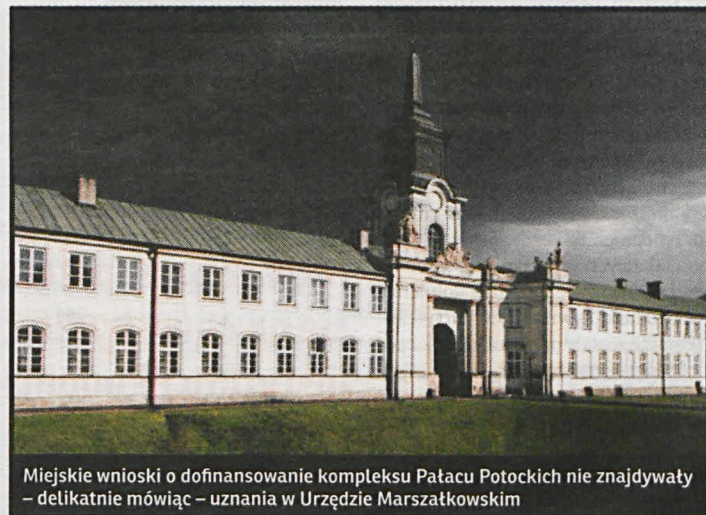
Miejskie wnioski o dofinansowanie kompleksu Pałacu Potockich nie znajdowały – delikatnie mówiąc – uznania w Urzędzie Marszałkowskim

rozpoznania, co Radzyńniowi zamknęło drogę do starań o środki na renowację pałacu ze złożonego w 2016 roku wniosku. W związku z tym kancelaria prawna reprezentująca miasto wystosowała skargę do Naczelnego Sądu Administracyjnego, który przyznał miastu rację.