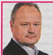
JANUSZ SZEWCZAK Poseł PIS