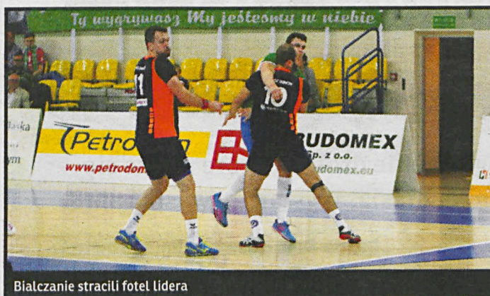
Białczanie stracili fotel lidera

AZS AWF: Adamiuk, Chmurski, Kozłowski – Urbaniak 1, Warmijak, Ziółkowski 4, Nowicki, Wołyncew 2, Stefaniec 8, Matecki 4, Kruczkow 4, Bekisz 8, Banaś 3, Kandora