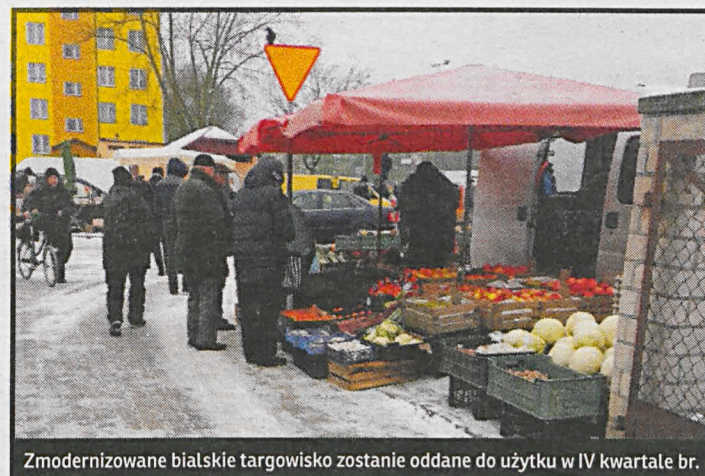
Zmodernizowane bialskie targowisko zostanie oddane do użytku w IV kwartale br.

Na modernizację i rozbudowę miejskiego targowiska miasto otrzymało 1 mln zł środków unijnych z programu Rozwój Obszarów Wiejskich na lata 2014-2020. Zbudowana zostanie wiata, pokrywająca jego przeważającą część. W północnej części powstanie nowy plac, gdzie sprzedawcy bezpośrednio z samochodów oferować będą płody rolne. Projekt przewiduje ponadto zbudowanie kanalizacji deszczowej i montaż instalacji fotowoltaicznej, gdyż targowisko oświetlone jest tylko