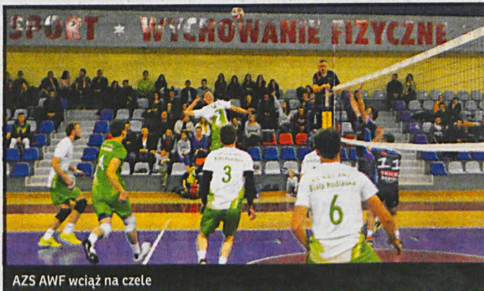
AZS AWF wciągnął na czele