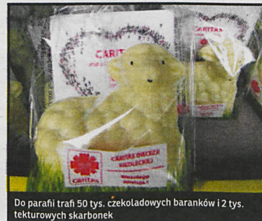
Do parafii trafi 50 tys. czekoladowych baranków i 2 tys. tekturowych skarbonek

Aby włączyć się w przedsięwzięcie wystarczy zabrać z kościoła skarbonekę i gromadzić w niej pieniądze, zaoszczędzone dzięki wstrzymaniu się od zbędnych wydatków. Następnie przynieść ją zgodnie ze zwyczajem miejscowym, tak jak ogłosi ksiądz proboszcz – w Niedzielę Palmową, Wielki Czwartek lub podczas Mszy Wieczery Pańskiej w czasie Wigilii Paschalnej – do kościoła, gdzie w procesji z darami będą składane przy ołtarzu. Zebrane fundusze posłużą realizacji dzieł charytatywnych w parafiach, Parafialnych Zespołach i Szkolnych Kołach Caritas. W akcję rozdysponowywania skarbonek włączają się tylko te parafie, które zgłosiły taką chęć i gotowość do diecezjalnej Caritas.