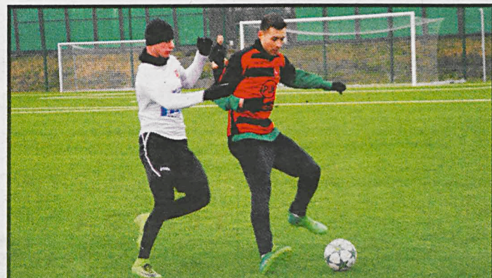
Podlasie w weekend nie grało, Orleńta zremisowały z Victorią Sulejówkę