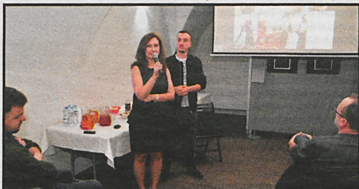
Wystawie towarzyszył pokaz filmów dokumentujących przygotowania do zdjęć

„Królowie nadbużańscy” to zbiór fotografii ludzi i obiektów. Postaci: seniorzy i dzieci zostali ucharakteryzowani: ich skórę pokrywa barwnik, twarze bajeczne makijaż, włosy układają się w kosmiczne fryzury, a wymyślne kostiumy stanowią zlepek kwiatów, liści oraz tkanin. W rezultacie fotografie ukazują odrealniony, wykreowany i teatralny świat. Artysta przyznaje, że jego instalacje