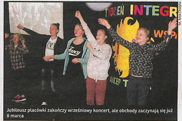
Jubileusz placówki zakończy wrześniowy koncert, ale obchody zaczynają się już 8 marca

Działania podejmowane przez nauczycieli i rodziców mają na celu naukę współuczestnictwa, współdziałania, a także uwrażliwiania uczniów na odmienność swoich rówieśników. Dzięki nim uczniowie poznają się bliżej, tworzą więzi. Podobną funkcję ma działająca od kilku lat Marzycielska Poczta. W jej ramach dzieci zdrowe odpisują na listy swoich niepełnosprawnych kolegów. W poprzednich latach, w czasie Tygodnia Integracji, urządzano gry miejskie, szkolenia z zakresu pierwszej pomocy, a także uczono języka migowego. Osoby o niepełnosprawności intelektualnej mogły się także sprawdzić w konkursie matematycznym. A inni uczniowie poznać podczas interaktywnej wystawy, jak niewidomi, niesłyszący bądź cierpiący na