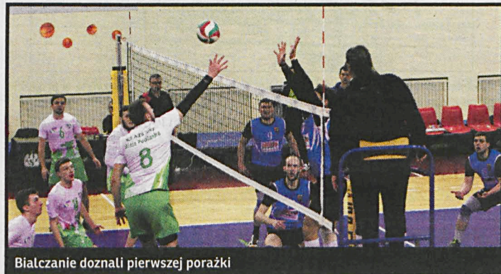
Białczanie doznali pierwszej porażki