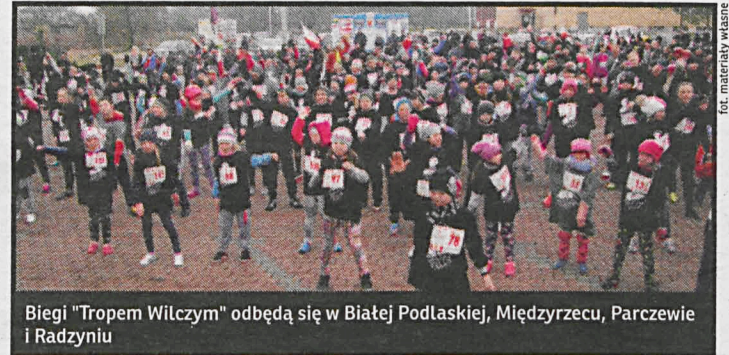
Biegi "Tropem Wilczym" odbędą się w Białej Podlaskiej, Międzyrzeczu, Parczewie i Radzynie