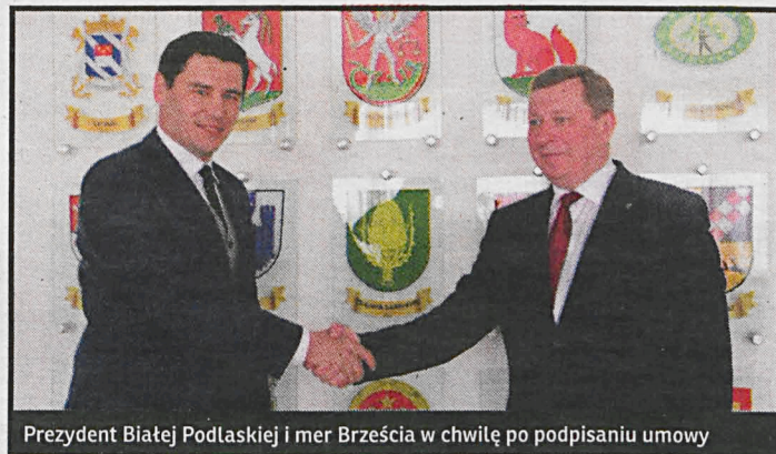
Prezydent Białej Podlaskiej i mer Brześcia w chwilę po podpisaniu umowy

– To bardzo ważny projekt, który znacznie poprawi infrastrukturę Białej Pod-