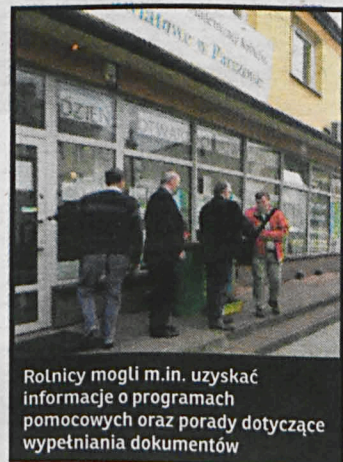
Rolnicy mogli m.in. uzyskać informacje o programach pomocowych oraz porady dotyczące wypełniania dokumentów

W trakcie „Drzwi Otwartych” ARIMR nie zabrakło też instytucji ściśle związa-