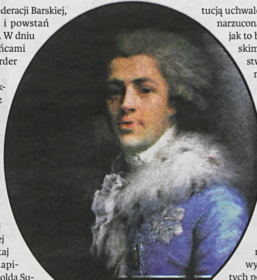
Wielki wkład w powstanie Konstytucji wniósł pochodzący z Radzyna Podlaskiego Ignacy Potocki

Pamiętać zawsze należy o tym, że Konstytucja 3 Maja była Konstytucją uchwaloną przez Polaków, a nie narzuconą im przez obcego władcę, jak to było w okresie napoleońskim, ani przez obce mocarstwo, jak to było w okresie niezbyt dawnym. Nauki