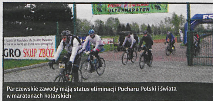
Parczewskie zawody mają status eliminacji Pucharu Polski i świata w maratonach kolarskich

W sobotę 28 kwietnia ze stadionu parczewskiego MOSiR-u 232 zawodników wyruszy na trasę ultramaratonu kolarskiego „Piękny Wschód 2018”. Kolarze wystartują na dwóch dystansach: 267 i 510 km, które pokonywać będą mogli samotnie lub w grupie. Zawodnicy pierwszego z dystansów ruszą na trasę, która przebiegać będzie przez Krasnystaw, Żółkiewkę i Dąbrowę, o godz. 10. Przyjazd pierwszych na metę w Parczewie spodziewany jest ok. godz. 21.30. Startujący na dłuższym dystansie wyruszą o godz. 7 rano i pojadą przez Krasnystaw, Hrubieszów, Józefów, Janów Lubelski, Żółkiewkę, Dąbrowę. Najszybsi miną linię mety ok. godz. 23.