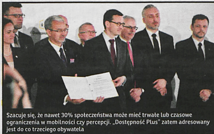
Szacuje się, że nawet 30% społeczeństwa może mieć trwałe lub czasowe ograniczenia w mobilności czy percepcji. „Dostępność Plus” zatem adresowany jest do co trzeciego obywatela

– Zarezerwowaliśmy na Program Dostępność Plus 23 mld zł. Niepełnosprawni muszą mieć pomoc w przełamywaniu barier – powiedział premier Mateusz Morawiecki. – Czasami nawet wejście po kilku schodach i likwidacja tych napotkanych barier to droga do wolności, odbycia rehabilitacji, pójścia na basen, wyjścia do kina czy na spacer. I z takimi przypadkami spotykamy się coraz częściej. Chcemy działać dla dobra całego społeczeństwa i dobra tych ludzi – dodał szef rządu. Program ma na celu usuwanie barier przed którymi stoją każdego dnia osoby niepełnosprawne. Założenie to realizowane będzie na dwóch płaszczyznach – uwzględniając potrzeby osób z niepełnosprawnością oraz przeznaczając środki na inwestycje budowlane, transportowe i technologiczne, dostosowujące przestrzeń publiczną do ich osób. W dłuższej perspektywie program ma zintegrować społeczeństwo oraz uwrażliwić je na