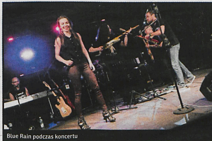
Blue Rain podczas koncertu