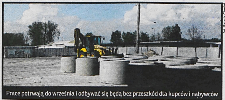
Prace potrwać do września i odbywać się będą bez przeszkód dla kupców i nabywców

Wykonawcą prac jest białka firma Dombud. Prace zakończą się we wrześniu i odbywać się będą bez przeszkód dla kupców i nabywców. Ich koszt zamknie się w kwocie 2,2 mln zł, z czego prawie połowę pokryją środki unijne. To