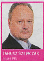
JANUSZ SZEWCZAK Poseł PiS