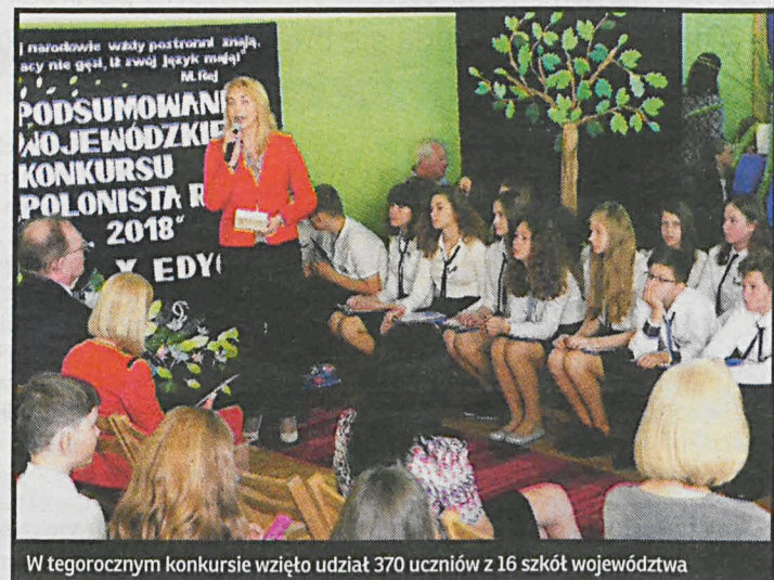
W tegorocznym konkursie wzięło udział 370 uczniów z 16 szkół województwa

Od narodzin idei konkursu „Polonista Roku” czyli przez dziesięć lat konkursowi przyświecają te same cele. Inspirowanie dzieci i młodzieży do pogłębiania wiedzy polonistycznej. Rozbudzenie ciekawości intelektualnej, samodzielności, ekspresji literackiej. Inicjowanie językowych i czytelniczych umiejętności uczniów w zakresie edukacji polonistycznej. Poszukiwa-