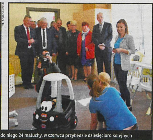
Żłobek działa od 8 stycznia br, obecnie uczęszczają do niego 24 maluchy, w czerwcu przybędzie dziesięcioro kolejnych