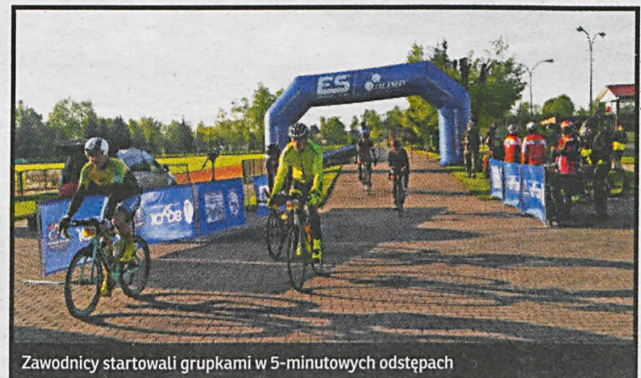
Zawodnicy startowali grupkami w 5-minutowych odstępach