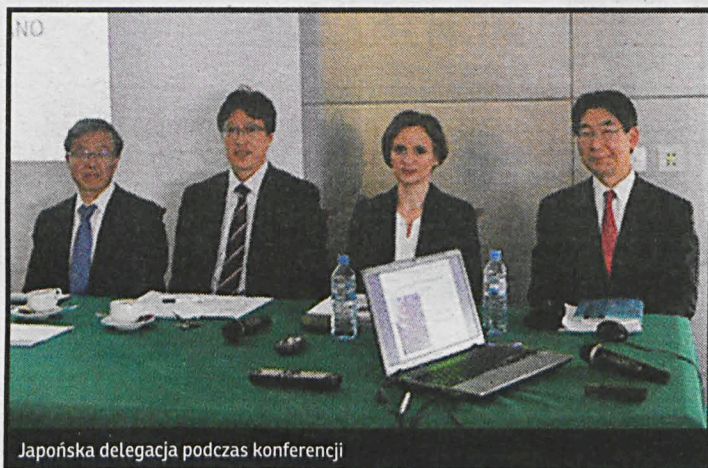
Japońska delegacja podczas konferencji

Wojewódzki Szpital Specjalistyczny w Białej Podlaskiej odwiedzili przedstawiciele tokijskiego szpitala św. Łukasza. Japońscy goście zwiedzili białą placówkę, spotkali się z dyrekcją i pracownikami oraz wzięli udział w obustronnych konsultacjach i dyskusjach nad wspólnym projektem.