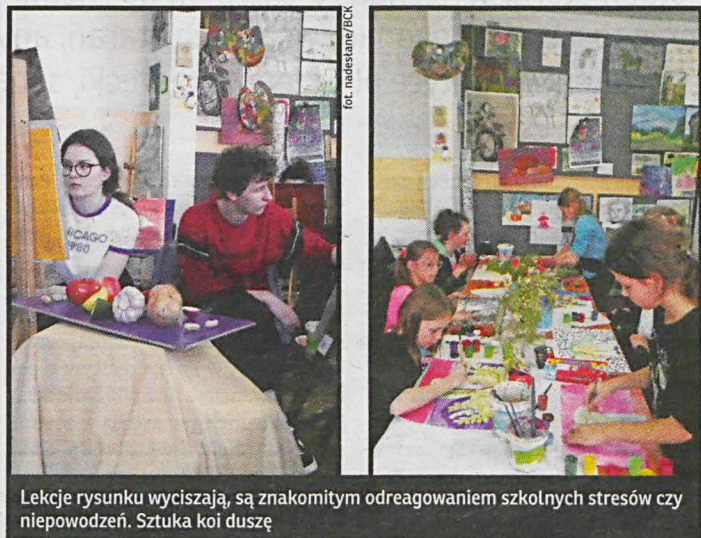
Lekcje rysunku wyciszają, są znakomitym odreagowaniem szkolnych stresów czy niepowodzeń. Sztuka koi duszę

Zajęcia artystyczne są bagatelizowane i niedoceniane. Część rodziców wychodzi z błędnego założenia, iż ich dziecko powinno uczyć się języków obcych oraz przedmiotów, które obowiązują