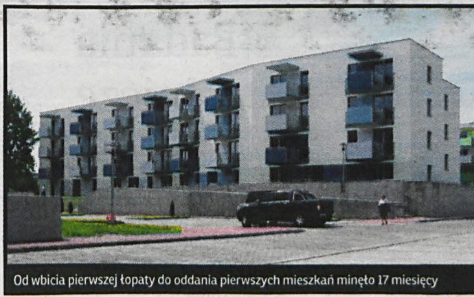
Od wbicia pierwszej łopatki do oddania pierwszych mieszkań minęło 17 miesięcy