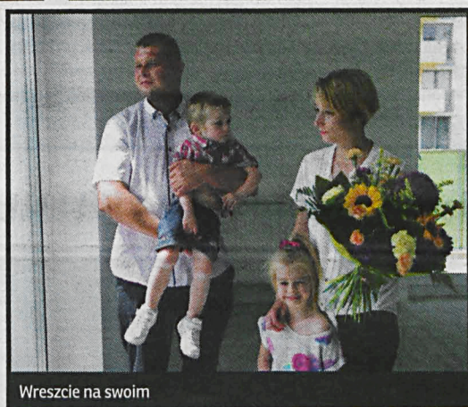
Wreszcie na swoim

– Ten program dał ludziom wolność i normalne życie. Te słowa wypowiedział Jarosław Kaczyński, gdy wspólnie