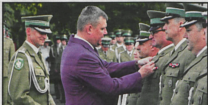
W trakcie uroczystości 300 funkcjonariuszy otrzymało awanse na wyższe stopnie służbowe, a wyróżniający się nienaganną i sumienną służbą – odznaczenia

– Dla nas, obywateli Polski, to wielki ho-