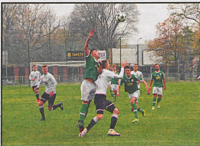
W Radzynie, w meczu Orłąt z Podlasem, padł bezbramkowy remis