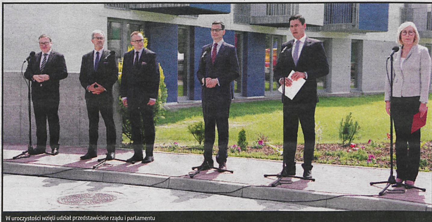
W uroczystości wzięli udział przedstawiciele rządu i parlamentu

– Przede wszystkim chcemy, żeby Polska była jak najbardziej demokratyczna i wolna, a to znaczy, że te cztery największe wartości, o które chodzi całemu społeczeństwu: rodzina, praca, godna płaca i mieszkanie – to wszystko jak w soczewce ma odzwierciedlenie w programie Mieszkanie Plus – powiedział premier Mateusz Morawiecki podczas symbolicznego przekazania kluczy do 186 mieszkań wybudowanych w ramach rządowego programu Mieszkanie Plus.