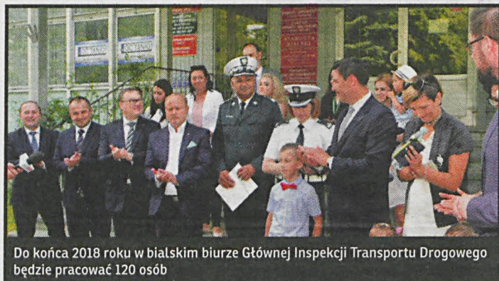
Do końca 2018 roku w białskim biurze Głównej Inspekcji Transportu Drogowego będzie pracować 120 osób

Do końca 2018 roku w białskim biurze Głównej Inspekcji Transportu Drogowego będzie pracować 120 osób. Dodatkowo, specjalnie z myślą o pracujących tu rodzicach, w siedzibie biura utworzono pokój matki z dzieckiem.