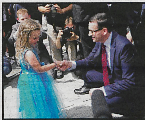
Premier i jedna z gwiazd sobotniego pikniku

Po zakończeniu części oficjalnej przy nowo oddanych budynkach rozpoczął się piknik rodzinny z okazji Dnia Matki.