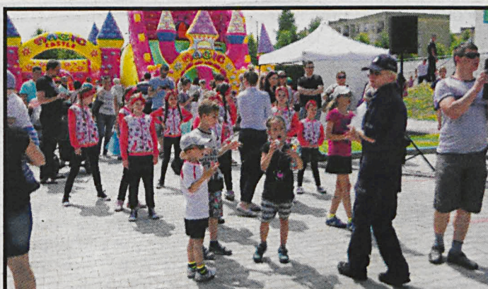
Po zakończeniu części oficjalnej rozpoczął się piknik z okazji Dnia Matki