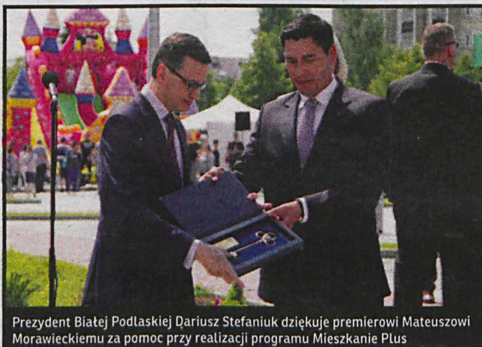
Prezydent Białej Podlaskiej Dariusz Stefaniuk dziękuje premierowi Mateuszowi Morawieckiemu za pomoc przy realizacji programu Mieszkanie Plus