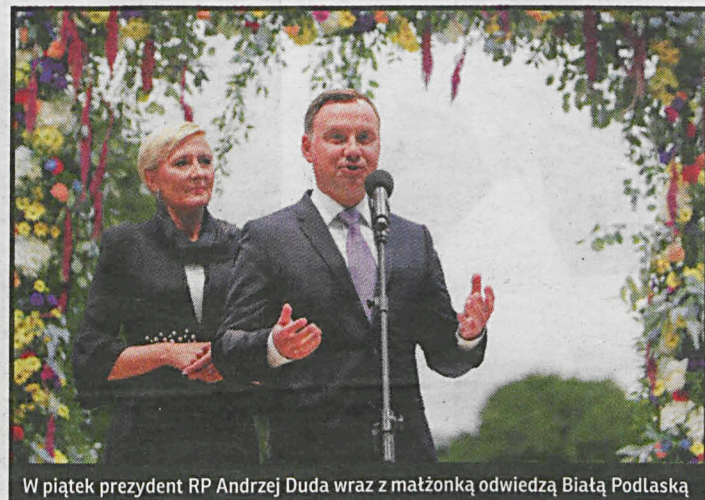
W piątek prezydent RP Andrzej Duda wraz z małżonką odwiedzą Białą Podlaską

W piątek o godz. 12 Przejście Twórczości Dziecięcej zainauguruje trzydniowe obchody święta miasta. O godz. 13.15 z białczanami spotka się para prezydencka: Andrzej Duda i Agata Kornhauser-Duda. Wyjątkowi goście z uwagi na Dzień Dziecka spędzą czas przede wszystkim z najmłodszymi białczanami i wręczą nagrody laureatom konkursu plastycznego o tematyce patriotycznej. O godz. 15 Prezydent złoży kwiaty przed pomnikiem śp. Marii i Lecha Kaczyńskich. W Parku Radziwiłłowskim do godz. 17 trwać będą rozstrzygnięcia konkursów dla dzieci i występy laureatów. Przejście zakończą pokazy grup tanecznych działających przy Białym Centrum Kultury. O godz. 19 na scenę wejdzie Zespół Pieśni i Tańca „Podlasie”. Wystąpi także Jazz Trio. Nie zabraknie atrakcji pozascenicznych: Hol Festiwalu wesołego miasteczka, Bali Festiwalu czyli święta koloru oraz Festiwalu Baniek Mydlanych.