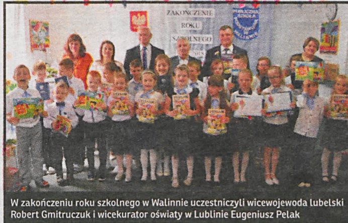
W zakończeniu roku szkolnego w Walinnie uczestniczyli wicewojewoda lubelski Robert Gmitruczuk i wicekurator oświaty w Lublinie Eugeniusz Pelak

objęte dzieci 6-letnie w przedszkolach. Gmina otrzymuje z budżetu państwa subwencję na każde dziecko w kwocie ok. 4,3 tys. zł. Rodzic opłaca jedynie wyżywienie. Łącznie samorzady otrzymały dodatkowo na ten cel subwencję w roku 2017 w kwocie 1,429 mld zł, a w 2018 w kwocie 1,612 mld zł. Na realizację wychowania przedszkolnego samorzady otrzymują z budżetu państwa wspar-