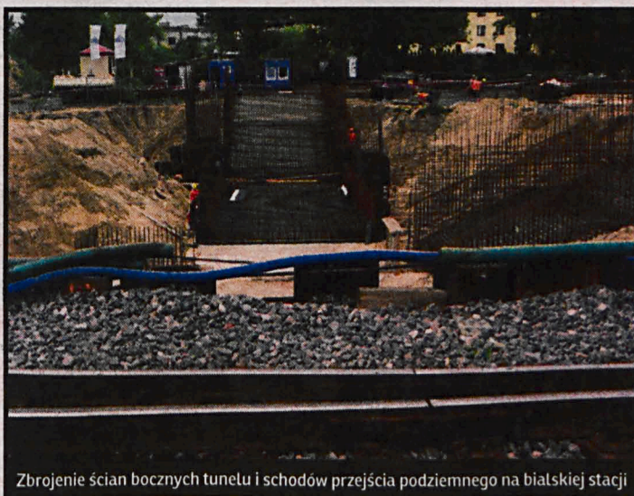
Zbrojenie ścian bocznych tunelu i schodów przejścia podziemnego na białskiej stacji

Po zdemontowaniu starej prowadzony jest montaż nowej sieci trakcyjnej. Zakończono budowę odcinka toru nr 1 i trwa demontaż toru nr 2. Na peronie pierwszym stawiane są nowe wiaty, zyskuje on też oświetlenie. Na peronie nr 2, po ukończeniu prac ziemnych, stawiane są ściany peronowe.