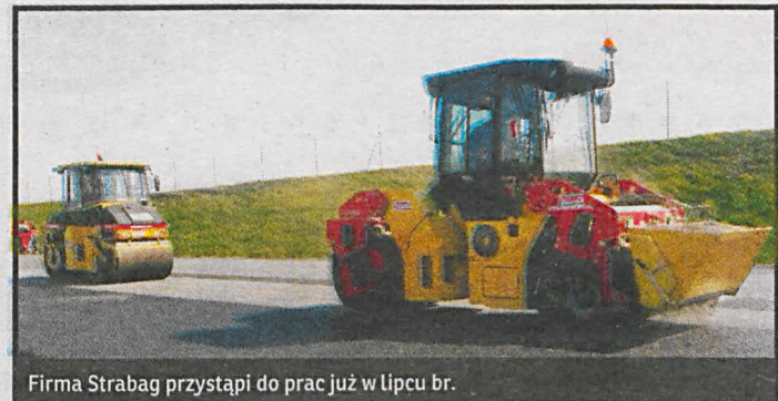
Firma Strabag przystąpi do prac już w lipcu br.

Rozbudowa obejmuje odcinek 36 km i będzie kosztowała 236 mln. Środki na ten cel będą pochodziły z Regionalnego Programu Operacyjnego Województwa Lubelskiego. W ramach prac szerokość pasów ruchu zostanie zwiększona z 3 do 3,5 m oraz wybudowane zostaną pobocza o szerokości 1,5 m. Inwestycja obejmie również budowę 32 obiektów inżynierskich, w tym 6 mostów, nowych przepustów drogowych oraz przejścia podziemnego pod nasypem linii kolejowej Łuków – Lublin. W te-