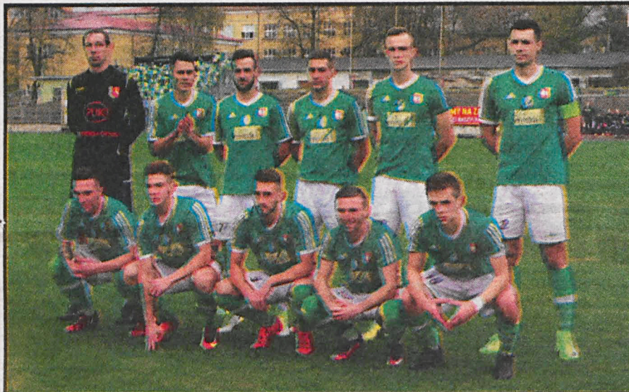
Obie nasze ekipy: Orleńta Radzyń Podlaski i...

W minionym sezonie w grupie IV III ligi występowały dwie nasze ekipy Orleńta Radzyń Podlaski i Podlasie Biała Podlaska. Obie utrzymały się w lidze, co należy uznać za wykonanie planu minimum.