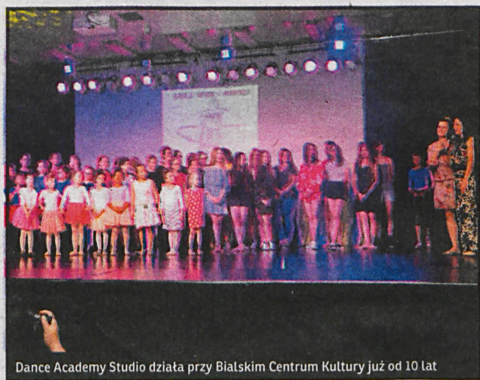
Dance Academy Studio działa przy Białskim Centrum Kultury już od 10 lat