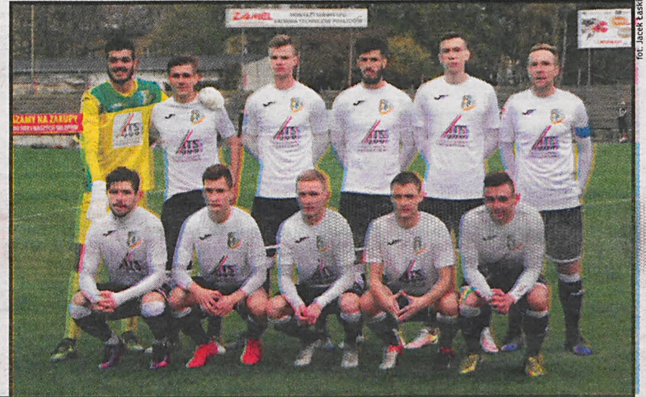
...i Podlasie Biała Podlaska w sezonie 2018/19 zagrają w III lidze