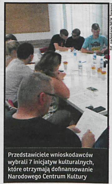
Przedstawiciele wnioskodawców wybrali 7 inicjatyw kulturalnych, które otrzymają dofinansowanie Narodowego Centrum Kultury

dwie zostały wycofane, a dwie kolejne postanowiono połączyć. Od sierpnia do listopada zrealizowane zostaną następujące inicjatywy (kolejność według otrzymanych punktów): „Fabała przez pryzmat historii”, „Kino na leżakach – i to bez plaży”, „Wszyscy równi – każdy ważny”, „Niech Ogień Będzie z Wami!”, „Czyli sztuka łączy od kuchni”, „Alte-rOFFka”, „Mamy czas na relacje”, „Graffiti ma się dobrze” oraz „Bitwa o Kresy”. Kwota dofinansowania tych inicjatyw wyniesie 22 tys. zł.