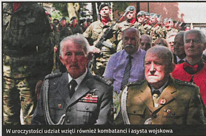
W uroczystości udział wzięli również kombatanci i asysta wojskowa