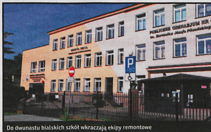
Do dwunastu białskich szkół wkraczają ekipy remontowe

Ogólnokształcących nr 3 zostanie wyremontowany korytarz budynku oraz inne, drobniejsze prace. Ich koszt wyniesie 40 tys. zł. Malowanie sal lekcyjnych i korytarzy, remont dachu hali sportowej, czyszczenie i konserwacja wentylacji w stołówce szkolnej czeka Zespół Szkół Ogólnokształcących nr 2. Zakres modernizacji wyceniono na 50 tys. zł. Aż 75 tys. zł należy wyłożyć na kompleksową modernizację Zespołu Szkół z Oddziałami Integracyjnymi. W tej placówce trwa renowacja podłóg w sali gimnastycznej i salach lekcyjnych oraz przystosowanie jednej z tych ostatnich do zajęć z gimnastyki korekcyjnej. Zostanie wykonany ponadto remont pokrycia dachowego budynku hali sportowej. Ogrom prac zostanie wykonanych w Zespole Szkół, przy ul. Zygmunta Augusta 2: remont sali dydaktycznej wraz z wymianą podłóża, remont tarasu, malowanie sal lekcyjnych