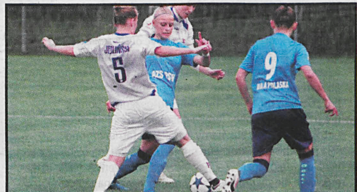
Panie zaliczyły dobry sezon

Zawodniczki AZS PSW Biała Podlaska w minionym sezonie miały zagrać w I lidze. Z powodu wycofania się ekipy z Piaseczna, białczanki przesunięto do gry w Ekstralidze. Dziewczyny pod wodzą Michała Kwietnia skwapliwie wykorzystywały tę szansę i dzielnie walcząc zajęły ostatecznie dziewiątą pozycję. Po zeszłorocznych niepowodzeniach i kompletnej klapie zakończonej spadkiem, ten sezon to istna metamorfoza akademickich. Owszem parę starych błędów zostało, trener i zawodniczki będą więc miały nad czym pracować w prze-