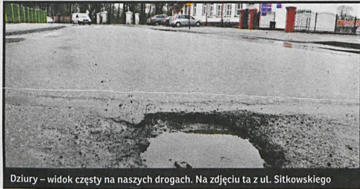
Dziury – widok częsty na naszych drogach. Na zdjęciu ta z ul. Sitkowskiego

28 czerwca wójt gminy Radzyń Podlaski podpisał w Lubelskim Urzędzie Wojewódzkim umowę na dotację na remont drogi w Paszkach Dużych, 2 lipca zaś – powiat radzyński na przebudowę ulic: Sitkowskiego, Bł. Męczenników Podlaskich i Podlaskiej w Radzynie Podlaskim.