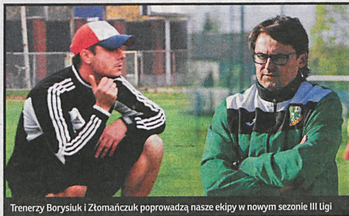
Trenerzy Borysiuk i Złomańczuk poprowadzą nasze ekipy w nowym sezonie III Ligi