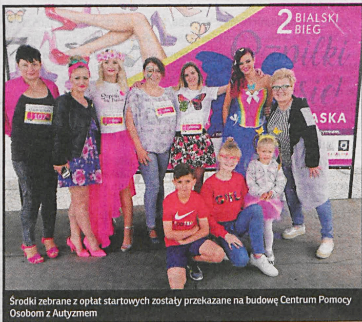
Środki zebrane z opłat startowych zostały przekazane na budowę Centrum Pomocy Osobom z Autyzmem