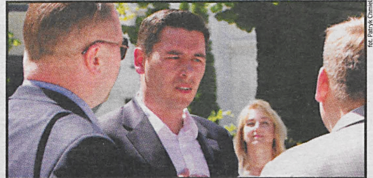
Decyzję o zakazie nocnej sprzedaży alkoholu poprzedziły konsultacje społeczne – mówi prezydent Dariusz Stefaniuk

Mieszkańcy okolic sklepów nocnych wkrótce będą spać spokojnie. Zakaz sprzedaży w sklepach w godz. 22 – 6 to konsekwencja ustawowego zapisu stanowiącego, że samorząd może wprowadzić ograniczenia w sprzedaży alkoholu na swoim terenie w godzinach nocnych. – Zaproponowałem radnym ten punkt pod dyskusją po konsultacjach społecznych, w trakcie których pojawiło się bardzo wiele postulatów całkowitego zakazu sprzedaży alkoholu na terenie miasta. Było również bardzo wiele głosów z prośbą o ograniczenie tej sprzedaży