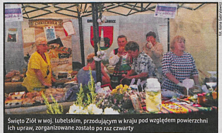
Święto Ziół w woj. lubelskim, przodującym w kraju pod względem powierzchni ich upraw, zorganizowane zostało po raz czwarty

Na terenie boiska sportowego zgromadzili się wystawcy i zielarze z całego województwa lubelskiego. Na stoiskach prezentowanych przez poszczególne gminy można było szkolić wszelkie ziołowe wspaniałości, m.in. rumiankowych ciasteczek i lemoniady z mięty. Prezentacjom gmin towarzyszyły wykłady o zdrowotnych właściwościach poszczególnych ziół. Na scenie zaś występowały zespoły z poszczególnych gmin, a zespół ludowy „Rumenok” z gminy Podedwórze zaprezentował ludowy obrzęd pt. „Żniwa Rumiankowe”. Zostały rozstrzygnięte również konkursy na najlepszą potrawę z dodatkiem ziół i najciekawsze stoisko zielarskie. Wydarzenie było okazją do zapoznania się z osiągnięciami lubelskiego zielarstwa oraz z walorami uprawianych u nas ziół.