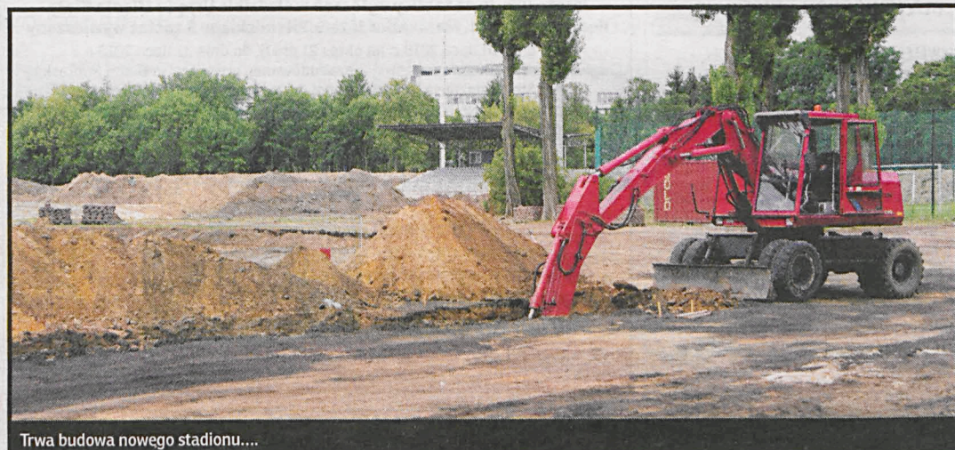
Trwa budowa nowego stadionu....