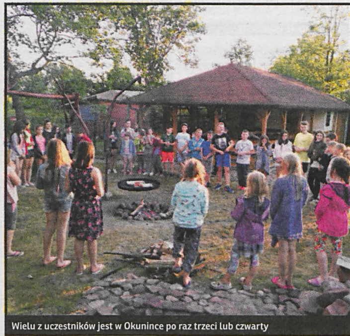
Wielu z uczestników jest w Okunince po raz trzeci lub czwarty

– Wiele z nich jest tu już po raz trzeci lub czwarty, rekordzista – po raz szósty. Rodzice opowiadają, że pierwsze słowa ich pociech po powrocie do domu, to prośba: za rok znowu tam pojadę?