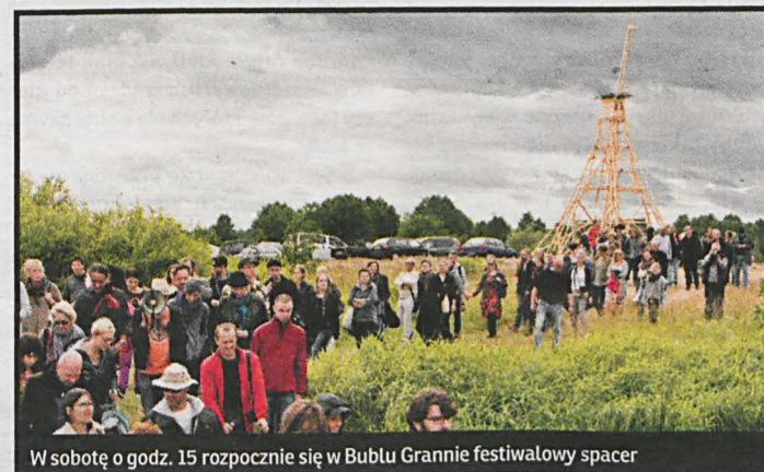
W sobotę o godz. 15 rozpocznie się w Bublu Grannie festiwalowy spacer