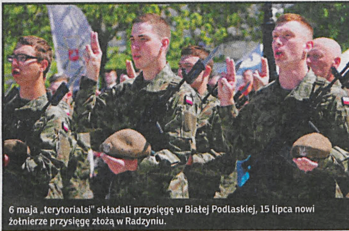
6 maja „terytorials” składali przysięgę w Białej Podlaskiej, 15 lipca nowi żołnierze przysięgę złożą w Radzynie.

W niedzielę 15 lipca o godz. 10.30 na radzyńskim Placu Wolności przysięgę złożą 70 żołnierzy 2 Lubelskiej Brygady Obrony Terytorialnej im. mjr. Hieronima Dekutowskiego ps. „Zapora”. To pierwsze tej rangi wydarzenie wojskowe w historii miasta.