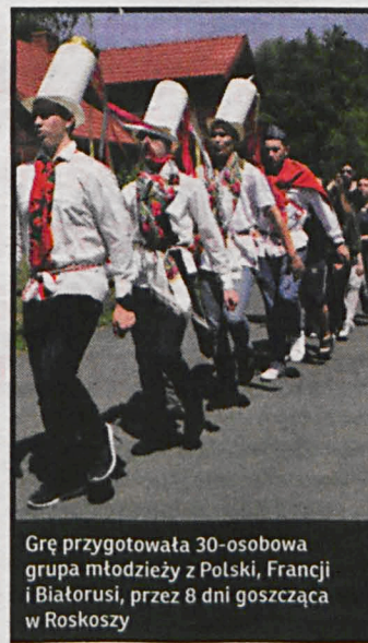
Gry przygotowała 30-osobowa grupa młodzieży z Polski, Francji i Białorusi, przez 8 dni goszcząca w Roskoszy