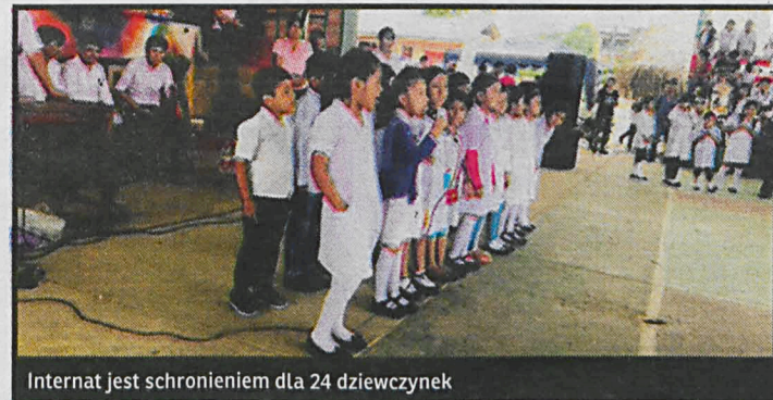
Internat jest schronieniem dla 24 dziewczynek

tego dostępu do nauki. Ich życie często ogranicza się do pracy w polu – póki są młode i silne. W bardzo młodym wieku zakładają rodziny, a przez braki w swojej edukacji nie widzą potrzeby i troski o kształcenie własnych dzieci. I tak koło się zamyka” – czytamy na stronie internetowej placówki.