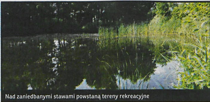
Nad zaniedbanymi stawami powstaną tereny rekreacyjne

kół wód – oświetlone ścieżki spacerowe. Zostanie utwardzony parking, powstaną też wiaty dla rowerzystów. Obecnie dobiega w Łomazach końca remont Gminnego Ośrodka Kultury. Kosztem 1,2 mln zł., z czego 85 proc. stanowi dofinansowanie, powstaną w nim sale: prób, nagrań oraz kinowa. – W tym roku powstanie także ponad pół kilometra chodnika, wraz ze zjazdami i odwodnieniem. Koszt prac wyniesie ponad 250 tysięcy złotych – mówi wójt.