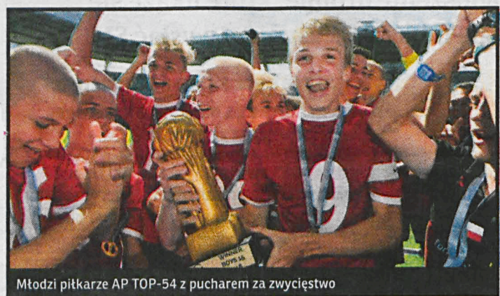
Młodzi piłkarze AP TOP-54 z pucharem za zwycięstwo

Gammelstads IF (Szwecja) 2-0 Clube Campo Belo (Brazylia) 10-0 Sölvesborg GIF (Szwecja) 1-0 St. Pauli Blackhawks (USA) 3-0 Ordin FC (Brazylia) 2-0 Hong Kong FC (Chiny) 4-0 KF Gjakova (Kosowo) 4-0 SKF Zambia (Zambia) 1-0 Stjarnan (ISL) 2:1