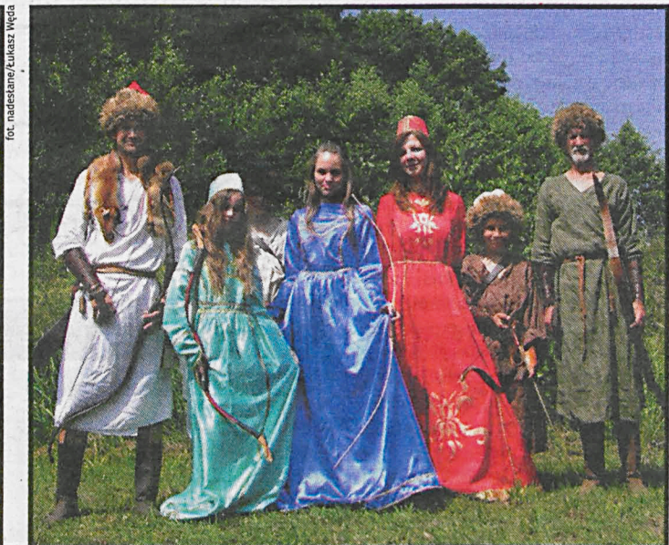
Od ponad 10 lat pielęgnuje się w Studziance dawne pamiątki, tradycje oraz wielokulturowość, wszechobecną na wschodzie kraju od wieków

dowle drewniane, archiwalne fotografie, stroje i tradycyjna broń tatarska – tuki).