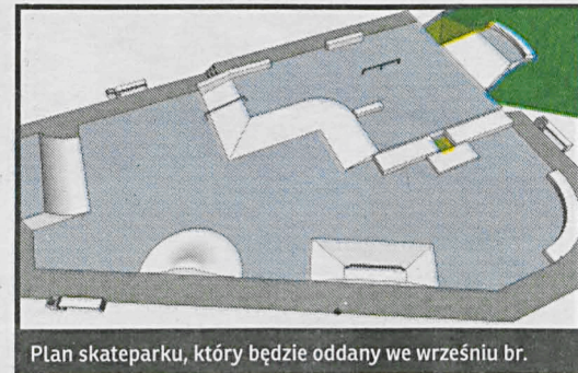
Plan skateparku, który będzie oddany we wrześniu br.

Kilka dni temu został oficjalnie oddany do użytku tor rowerowy, tzw. pumptruk. Teraz przyszła kolej na skatepark, który ma powstać na terenie parczewskiego MOSiR-u. Burmistrz Paweł Kędracki podpisał umowę z lubelskim Przedsiębiorstwem Inżynieryjno-Budowlanym INŻ-WOD-BUD sp. z o.o. na wykonanie tej inwestycji. Zadaniem firmy będzie wybudowanie nowoczesnego skateparku: płyty betonowej o powierzchni prawie 364 m 2 wyposażonej w elementy skateingowe, wykonane z prefabrykatów betonowych oraz chodnik z bezfazowej kostki betonowej o powierzchni 127,5 m 2 . Skatepark służyć będzie użytkownikom rowerów bmx, deskorolek oraz rolek. Inwestycja została podzielona na cztery sekcje, których nazwy dla laika zapewne z niczym się nie będą kojarzyły, ale ich rozszyfrowanie zainteresowanej młodzieży nie sprawi żadnego kłopotu: 1. Bank z murkiem, grindbox'y, 2. Bank, Hubba, Poręcz, Piramida. 3. Murek łukowy, Barcelona