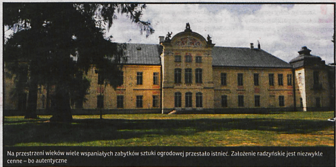
Na przestrzeni wieków wiele wspaniałych zabytków sztuki ogrodowej przestało istnieć. Założenie radzyńskie jest niezwykle cenne – bo autentyczne

Dorota Pape: Barokowy ogród przy rezydencji magnackiej w Radzynie Podlaskim, w: Radzyń Podlaski. Miasto i rezydencja, pod red. Grażyny Michalskiej i Dominiki Leszczyńskiej, Radzyń Podlaski 2011