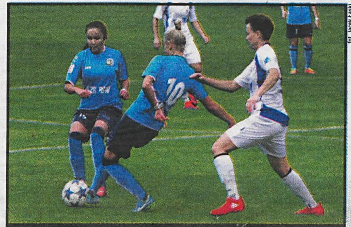
Panie z AZS PSW rozpoczną ligę w Sosnowcu