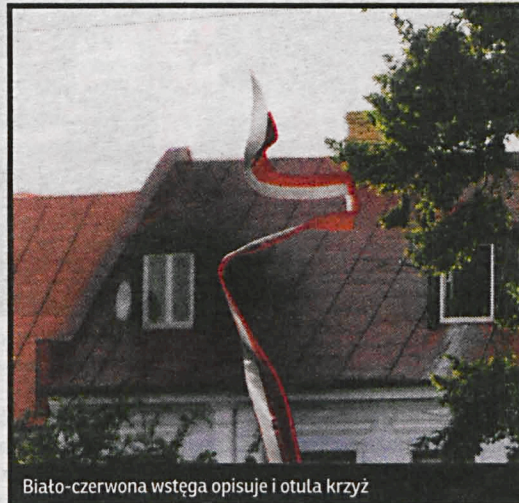
Biało-czerwona wstęga opisuje i otula krzyż