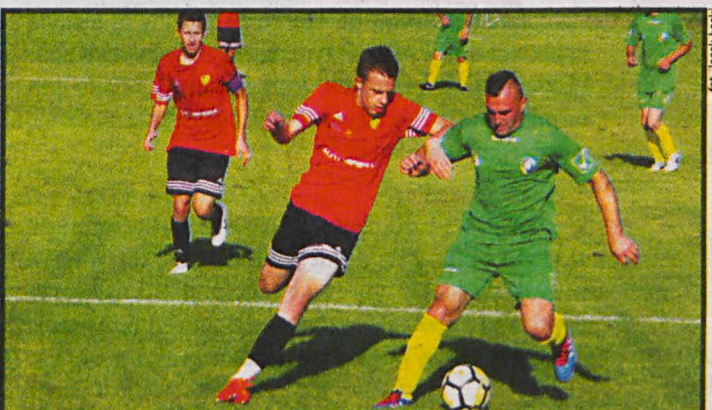
Młodzi piłkarze AP TOP 54 pokonali w pierwszej rundzie PP SPGLMP Rogoźnica 4:2

palin – ULKS Dębowica 0:7, Niwa Łomazy – Granica Terespol 1:2, LZS Dobryń – Lutnia Piszczac 2:5, Twierdza Kobylany – Tytan Wisznice 1:2, Victoria Parczew – LKS Milanów 2:3, Młodzieżówka Radzyń Podlaski – Grom Kąkolewnica 4:2, Orzeł Czemierniki – Unia I Żabików 2:0, Wolny Los – EKS Łazy, Krzna Rzeczycza – Huragan Międzyrzec Podlaski 2:5, Orleńka Gołaszyn – Unia I Krzywda 3:0, Start Gózd – Olimpia Okrzeja 1:3, Ar-Tig Huta Dąbrowa – Kujawiak Stanin 3:5, Dwernicki Stoczek Łukowski – Bizon Jeleniec 0:2, Bór Dąbie – Bad Boys Zastawie 3:2, Polesie Serokomla – Sokół Adamów 1:0.