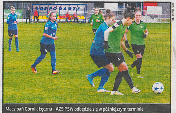
Mecz pań Górnik Łęczna - AZS PSW odbędzie się w późniejszym terminie