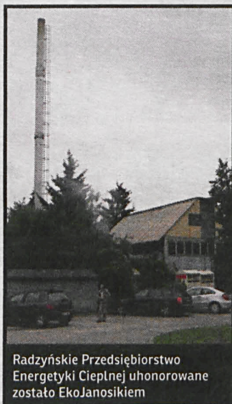
Radzyńskie Przedsiębiorstwo Energetyki Ciepłej uhonorowane zostało EkoJanosikiem

Radzyński PEC w ostatnich latach m.in. zamontował nowoczesną instalację katalizacyjnego odgazowania wody sieciowej oraz nowe instalacje odpylające z filtrami workowymi, zmodernizował kotły wytwarzające energię ciepłą,