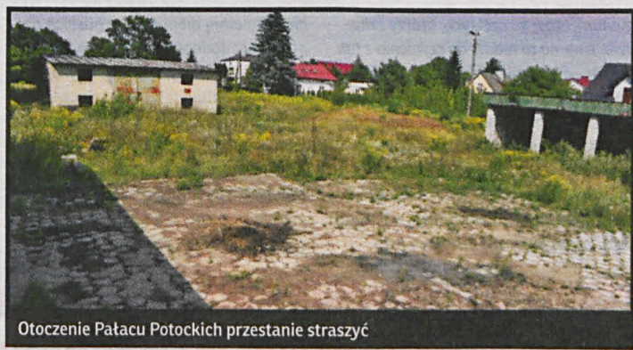
Otoczenie Pałacu Potockich przestanie straszyć

kwestia bonifikaty. Powoływali się przy tym na art. 68 ustawy o gospodarce nieruchomościami, mówiący o 50-procentowej bonifikacie od ustalonej przez rzeczoznawcę ceny wywoławczej, w przypadku sprzedaży nieruchomości wpisanej do rejestru zabytków. Uważali oni, że dotyczy to również placów, znajdujących się w strefie konserwatorskiej, tymczasem bonifikata dotyczy obiektów wpisanych do rejestru zabytków, pomijając już fakt, że przedmiotem uchwały była kwestia zezwolenia na sprzedaż, nie zaś – kwestia ceny.