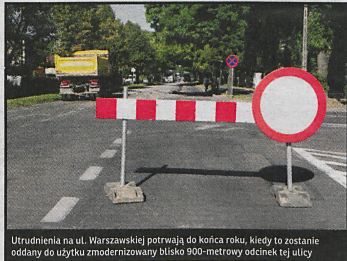
Utrudnienia na ul. Warszawskiej potrwać do końca roku, kiedy to zostanie oddany do użytku zmodernizowany blisko 900-metrowy odcinek tej ulicy

Miasto otrzymało na ten cel blisko 4,4 mln zł od wojewody lubelskiego w ramach rządowego programu na rzecz rozwoju oraz konkurencyjności re-