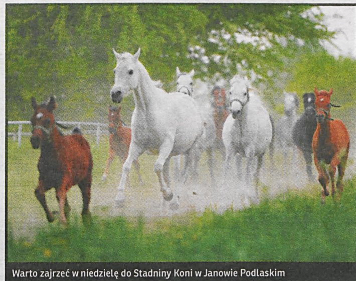
Warto zajrzeć w niedzielę do Stadniny Koni w Janowie Podlaskim

Warto zajrzeć w najbliższą niedzielę do janowskiej stadniny, gdzie w godz. 13 – 18 trwać będzie bezpłatny dzień otwarty. Do godz. 17 odbywać się będą pokazy jeździeckie z udziałem m.in. Szwadronu Kawalerii Batalionu Reprezentacyjnego Wojska Polskiego, Teatru Konnego Katarzyny Cygler oraz UKS Volteo i Klubu „Koi w orzęzu polskim”. W przerwie, o godz. 14 przed Stajnią Zegarową przewidziana jest prezentacja 12 koni, które oferowane będą podczas aukcji głównej. O godz. 17 rozpocznie się koncert istniejącego od roku rewelacyjnego zespołu „Tulia”. Jego pierwszy album po niespełna trzech miesiącach sprzedaży uzyskał status Złotej Płyty, a na tegorocznym festiwalu opolskim zespół zdobył nagrodę jurorów i publiczności oraz nagrodę specjalną ZAIKS.