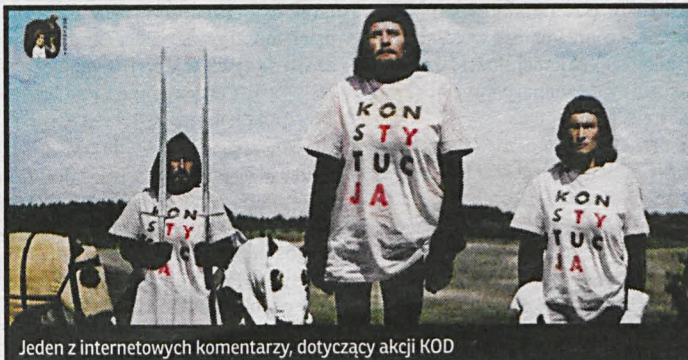
Jeden z internetowych komentarzy, dotyczący akcji KOD