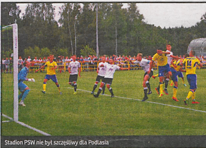
Stadion PSW nie był szczęśliwy dla Podlasia

W niedzielę o godz. 17 Podlasie zmierzy w Sienawie z tamtejszym Sokołem, a Orłęta w Rzeszowie ze Stalą.