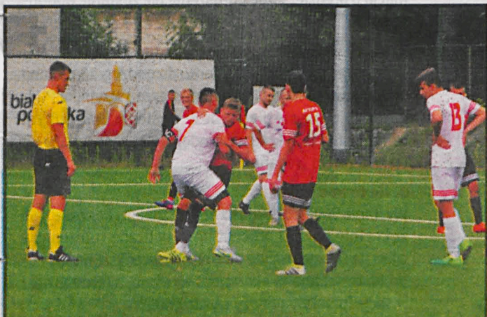
Białska młodzież z AP TOP 54 musiała uznać wyższość rywali z terespolskiej Granicy ulegając na sztucznym boisku MOSiR-u w Białej Podlaskiej 1:2

lesie Serokomla – Piekiełko Przykwa 8:3, Wóldom Wólka Domaszewska – Orłęta Gołaszyn 2:3, SRG Sławatycze – Tytan Wisznice 6:4, Janowia Janów Podlaski – Lutnia Piszczac 1:2, Unia II Krzywda – Olimpia Okrzeja 2:1, ULKS Dębowica – Kujawiak Stanin 1:3, Bór Dąbie – ŁKS Łazy 3:5, Orzeł Czemierniki – LKS Milanów 2:0.