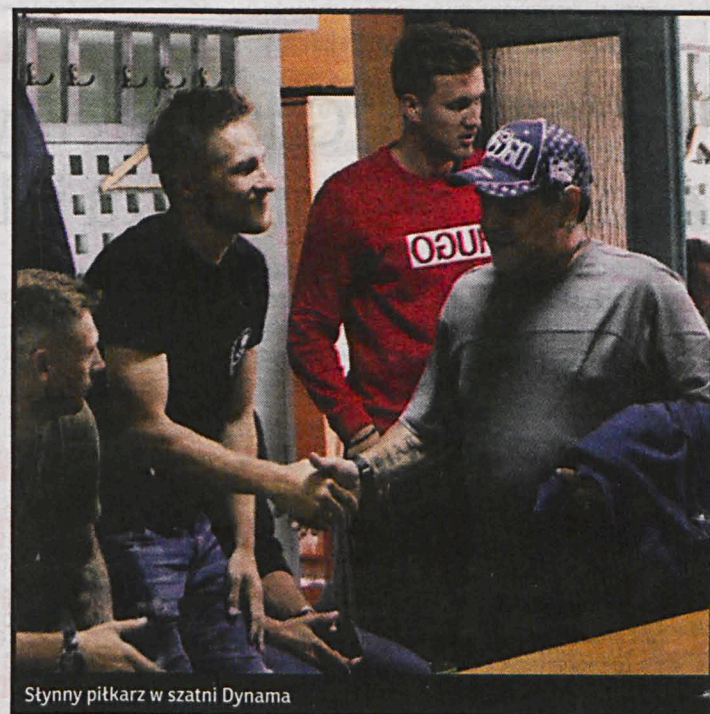
Słynny piłkarz w szatni Dynama

Zgodnie z kontraktem Maradona nie będzie musiał na stałe mieszkać na Białorusi. Klub ma jednak wynająć dom,