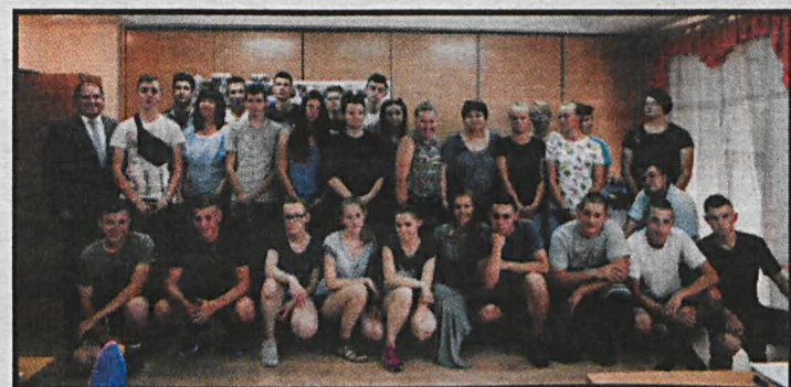
Zaświadczenia o stażach i zdobyte doświadczenie będą dodatkowym autotem podczas poszukiwania pracy

W Europejskim Centrum Kształcenia i Wychowania OHP w Roskoszy odbyło się podsumowanie projektu „Czas na staż”. Podczas spotkania młodzież opowiadała o swoich wrażeniach, doświadczeniach i kompetencjach zdobytych podczas staży zawodowych odbytych w hiszpańskiej Sewilli w Hiszpanii i węgierskim Gyomaendrőd. Zaprezentowała również album, zawierający informacje o stażach, relacje uczestników oraz zdjęcia. Udział w dwutygodniowych stażach zawodowych realizowanych w prywatnych przedsiębiorstwach oraz w placówce kształcenia zawodowego to możliwość poznania zagranicznych standardów pracy jak również nowo-