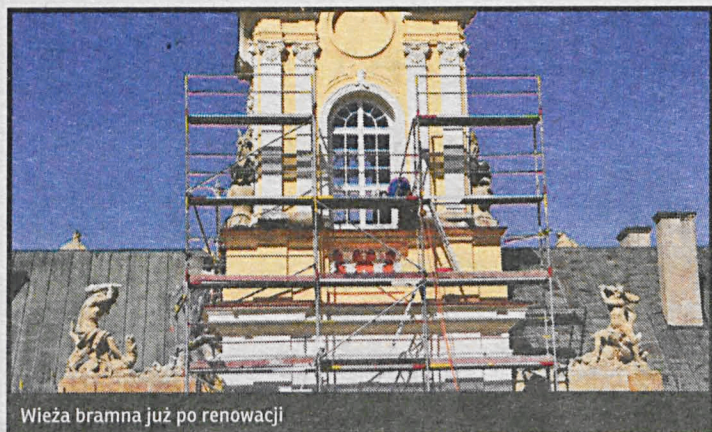
Wieża bramna już po renowacji

Od maja trwa renowacja skrzydła zachodniego Pałacu Potockich oraz wieży bramnej i rzeźby jelenia (dawne wejście do biblioteki).