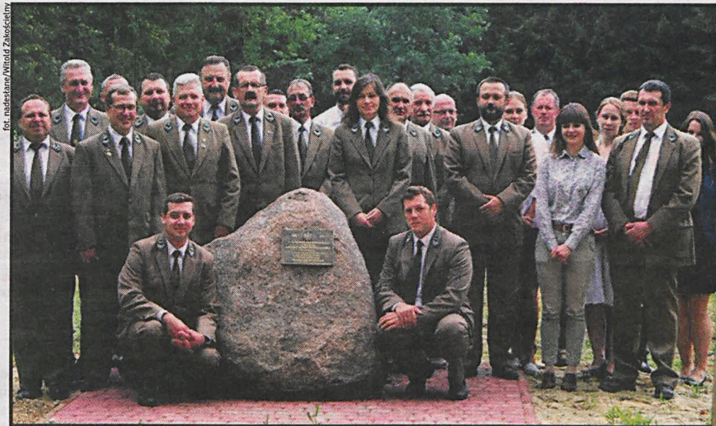
Parczewscy leśnicy i ufundowana przez nich kapliczka św. Jana Gwalberta

Parczewscy leśnicy za własne pieniądze ufundowali również kapliczkę z figurką patrona leśników św. Jana Gwalberta. Drewnianą figurkę wykonał artysta rzeź-