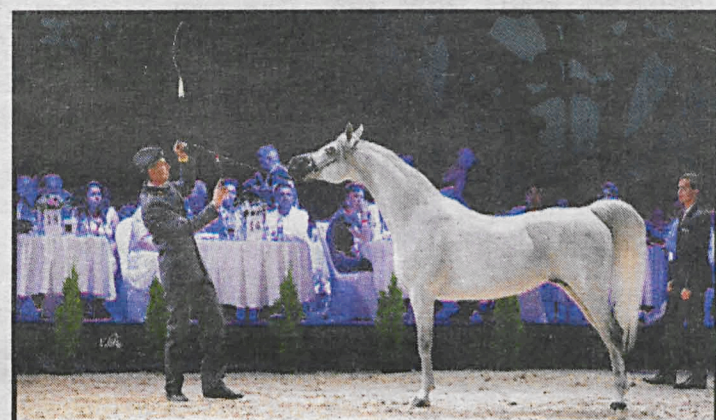
Tegoroczna aukcja nie była imprezą masową, lecz skierowaną do potencjalnych klientów

Niedzielną aukcję Pride of Poland poprzedziła aukcja charytatywna na rzecz poszkodowanej w pożarze rodziny z gminy Janów Podlaski. Za wyhodowanego w Michałowie kucyka uzyskano 5600 euro. Podczas aukcji głównej z 11 wystawionych koni pochodzących ze stadnin w Janowie Podlaskim, Michałowie, Białce oraz z hodowli prywatnych nabywców znalazło 6 za łączną kwotę 501 tys. euro. Najwięcej – 180 tys. euro – uzyskano za michałowską klacz Parmanę. Podczas poniedziałkowej aukcji Summer Arabian Horse Sale 2018 zaoferowano 20 koni ze stadnin w Janowie Podlaskim, Michałowie, Białce oraz ze stadniny Dąbrówka Arabians. Sprze-