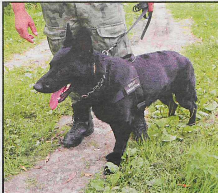
Pomimo posiadania przez Straż Graniczną wysokiej klasy sprzętu nieocenioną rolę w poszukiwaniu nielegalnych emigrantów i kontrabandy pełnią psy