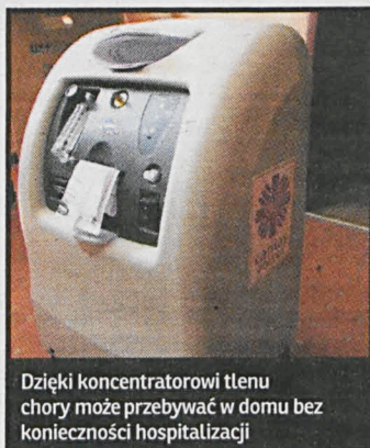
Dzięki koncentratorowi tlenu chory może przebywać w domu bez konieczności hospitalizacji

Otrzymany sprzęt skróci listę oczekujących, dla których Wypożyczalnia Sprzętu Rehabilitacyjnego są często jedyną deską ratunku w sytuacji niepełnosprawności, choroby czy podeszłego wieku. W przypadku zapotrzebowania na koncentrator tlenu potrzebne jest zaświadczenie od lekarza specjalisty, a pozostałe sprzęty (łóżko rehabilitacyjne, rotor/rower rehabilitacyjny, kula/laska, akcesoria rehabilitacyjne, wózek inwalidzki, podnośnik wannowy, pionizator, chodzik łokciowy, siedzisko wannowe, krzesło toaletowe, chodzik, balkonik) wypożyczane są po przedstawieniu aktualnego: orzeczenia o niepełnosprawności, wypisu ze szpitala lub zaświadczenia od lekarza rodzinnego. Na miejscu trzeba też okazać dowód osobisty osoby wypożyczającej. Sprzęt