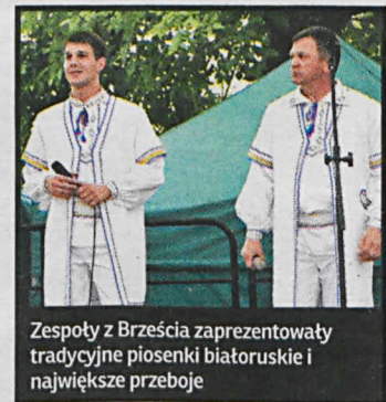
Zespoły z Brześcia zaprezentowały tradycyjne piosenki białoruskie i największe przeboje