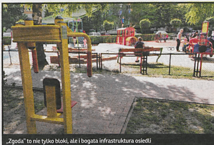
„Zgoda” to nie tylko bloki, ale i bogata infrastruktura osiedli

– Pragnę podziękować mieszkańcom, to dzięki ich solidarności i zdyscyplinowaniu nie mamy problemów finansowych. Od szeregu lat zdecydowana większość regularnie uiszcza czynsz. Zaległości w opłatach ma jakieś 3 procent miesz-