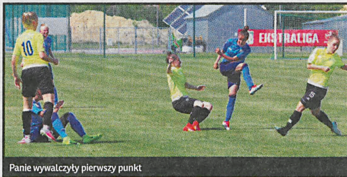
Panie wywalczyły pierwszy punkt

Pierwszy punkt w tym sezonie zdobyły piłkarki AZS PSW Biała Podlaska, remisując na własnym boisku z AZS UJ Kraków. Mecz miał dramatyczny przebieg, bowiem choć do 84 minuty białczanki prowadziły 2:1, to trzecią dającą im remis bramkę zdobyły w 3 minucie doliczonego czasu gry. W sobotę o godz. 11 w Żywcu nasze panie zagrają z tamtejszym Mitechem.