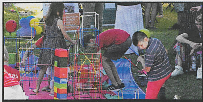
Celem zajęć będzie inspirowanie dzieci do twórczego myślenia, rozwijania zainteresowań oraz poznanie fascynującego świata nauki

Zapisy: należy wydrukować i wypełnić formularze, znajdujące się na stronie: http://www.pswbp.pl/index.php/pl/pliki-do-pobrania-amw i dostarczyć je do Biura Projektu, PSW, ul. Sidorska 95 – 97, pokój 335.