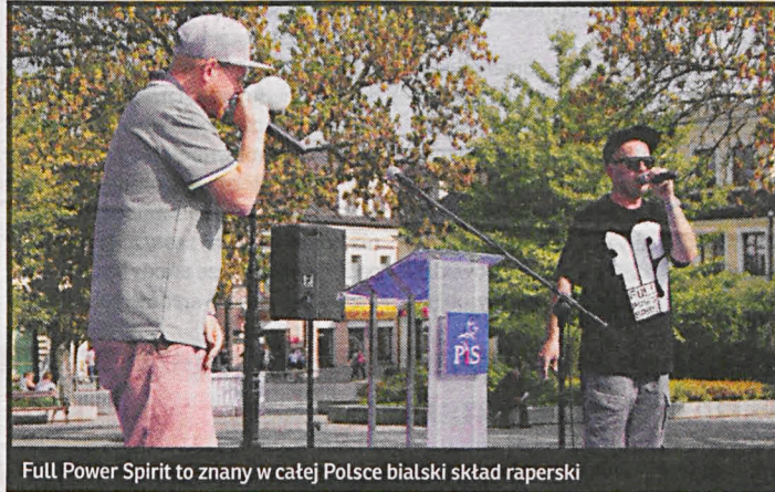
Full Power Spirit to znany w całej Polsce biański skład raperski

– W moim przypadku polityka to za duże słowo. Nie jestem członkiem żadnej partii. Mam teraz więcej czasu który spędzam w Białej. Mieszkam od urodzenia na osiedlu młodych – na tzw. „Orzechówku” i myślę, że to jest dobry moment, aby aktywnie włączyć