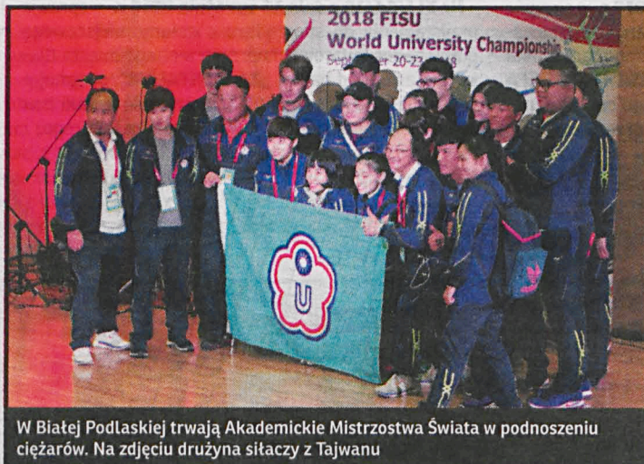
W Białej Podlaskiej trwają Akademickie Mistrzostwa Świata w podnoszeniu ciężarów. Na zdjęciu drużyna siłaczy z Tajwanu