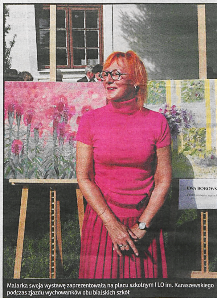
Malarka swoją wystawę zaprezentowała na placu szkolnym I LO im. Karaszewskiego podczas zjazdu wychowanków obu białskich szkół