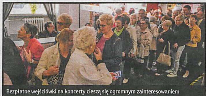
Bezpłatne wejściówki na koncerty cieszą się ogromnym zainteresowaniem

W środę o godz. 18 w hali AWF przy ul. Marusarza 8 czeka nas Wieczór Polo-