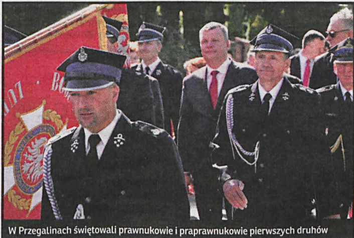
W Przegalinach świętowali prawnukowie i praprawnukowie pierwszych druhów