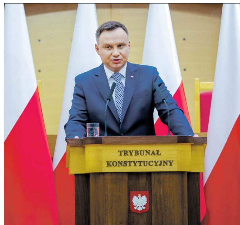
Prezydent Andrzej Duda nie ugnie się pod presją

sku, Andrzej Duda powtórzył bardzo mocny przekaz dotyczący sądownictwa. – Polska nie będzie nigdy w pełni normalnym, demokratycznym państwem, jeżeli nie będzie normalnego, uczciwego, rzetelnego, sprawiedliwego wymiaru sprawiedliwości. O to przecież nam wszystkim chodzi – mówił. Prezydent poprosił o wsparcie wszystkich Polaków. – Proszę was o wsparcie, bo oni mają swoje możliwości oddziaływania również międzynarodowego. Mają swoich kolegów, swoich ludzi w trybunałach