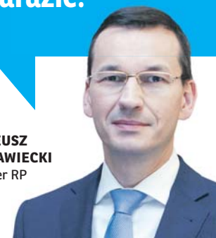
MATEUSZ MORAWIECKI Premier RP

wyborców. Najmocniej postulowano przekonywanie do znudzenia, że... PiS z Dudą doprowadzą do zamknięcia granic! Naprawdę to mówili, a nawet wielokrotnie powtarzali. Brawo! Można tej strategii tylko przyklasnąć. Bo totali ją najpewniej zaimplementują, ale Polacy tego nie kupią. Miał bowiem być zamordyzm, totalitaryzm, druga BiałoRuś, krach gospodarczy i izolacja Polski. Są rekordowe wskaźniki gospodarcze – po konsekwentnie wysokim PKB, niemal zlikwidowanym bezrobociu, zrównoważonym budżecie, ostatni tydzień przyniósł też dane o najwyższym w historii III RP dodatnim bilansie w handlu zagranicznym (zerknijcie na dopisek dotyczący tego wskaźnika w Wikipedii odnośnie Polski, zdezaktualizował się...) i 2. miejscu w Unii pod względem wzrostu produkcji przemysłowej. Demokracja kwitnie, co widać na pączkujących marszach. A w polityce zagranicznej – zapytajcie sami siebie o Trójmorze, Waszyngton czy energetykę, czyli konkrety, w których najlepiej widać tę „izolację”. Nie ma więc z punktu widzenia polskiej racji stanu lepszej taktyki niż straszenie idiotyzmami, które nie wchodzi w grę. To gwarantuje niepowodzenie, czego wszystkim nam życzę. Felieton opublikowany w portalu wPolityce.pl