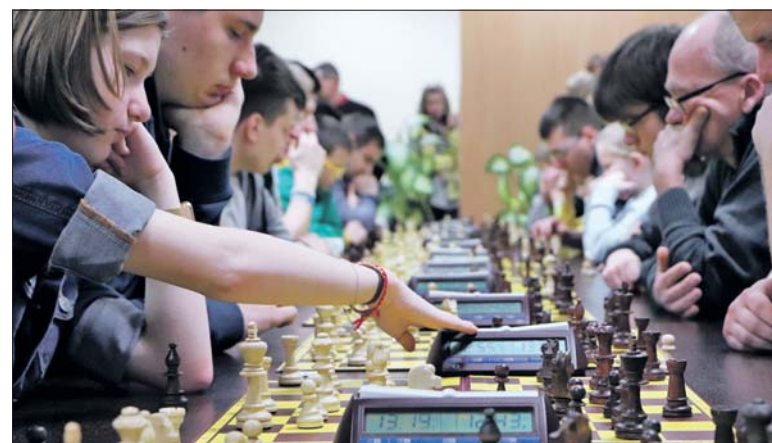
Emocji i ciekawych pojedynków w Terespolu nie brakowało