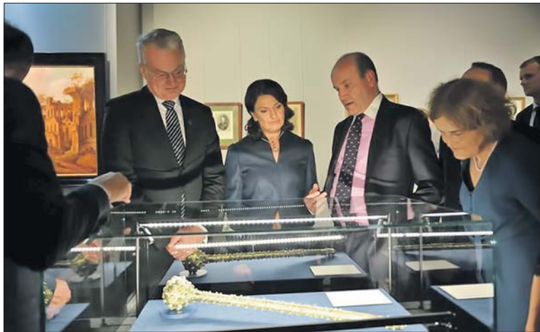
Rekordowe zainteresowanie historią Radziwiłłów

Muzeum Narodowe – Pałac Wielkich Książąt Litewskich pożegnało się 12 stycznia ze swoją międzynarodową wystawą – „Radziwiłłowie. Historia i dziedzictwo książąt”. Największa wystawa w historii Litwy, nawiązująca również do historii naszego regionu, okazała się gigantycznym sukcesem.