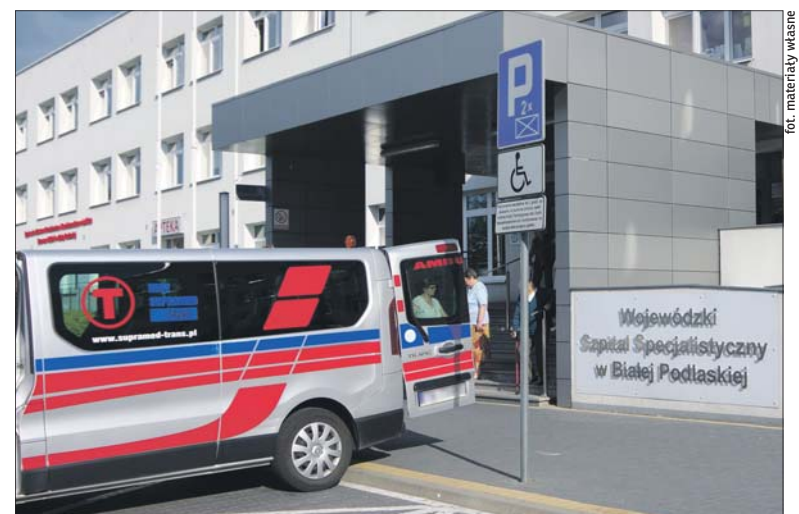
Szpital w Białej Podlaskiej w lepszej kondycji finansowej