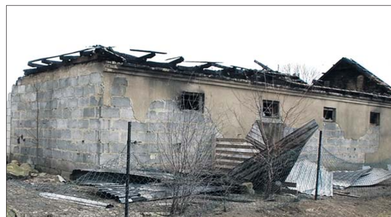
W pożarze spaliły się budynki gospodarcze

Przed godziną 12 dyżurny radzyńskiej komendy otrzymał informację że w miejscowości Krasew pała się budynki gospodarcze. Po przybyciu na miejsce policjanci ustalili, że spaleni uległy budynek gospodarcze, wewnątrz których, znajdował się m.in. samochód osobowy marki Volkswagen Passat oraz cztery konie. W wyniku pożaru zniszczeniu uległo również wyposażenie budynków. Wartość strat właścicieli oszacował wstępnie na ponad 180 tys. złotych. Dokładne okoliczności zdarzenia oraz jego przyczynę, wyjaśni wszczęte postępowanie.