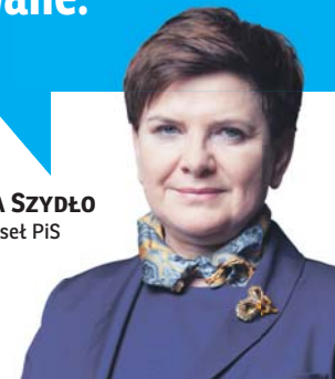
BEATA SZYDŁO Europoseł PiS

Zastanówcie się dlaczego Polska jest krytykowana za rozwiązania, które znacie z własnych krajów, dlaczego debatujecie nad kompetencjami, które traktaty unijne dały parlamentom narodowym, a nie nam tutaj. Reformy w polskim wymiarze sprawiedliwości będą kontynuowane.