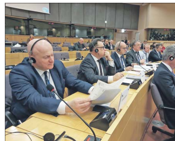
Nowe zadania przed Jarosławem Stawiarskim

Prezydium jest organem zarządzającym Komitetem Regionów. Komitet skupia obecnie 329 przedstawicieli społeczności regionalnych i lokalnych z 27 unijnych państw. Komisja Europejska, Rada UE i Parlament Europejski są zobowiązane do zasięgania opinii samorządowców w procesie tworzenia prawa unijnego. Dzięki wyborowi do prezydium marszałka Stawiarskiego głos naszego województwa i Południowego Podlasia będzie lepiej słyszalny w Brukseli. Gratulujemy!