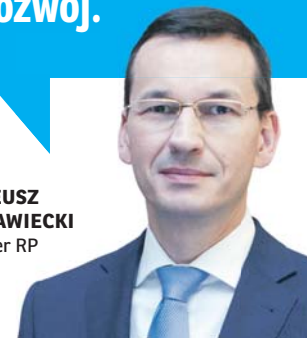
MATEUSZ MORAWIECKI Premier RP

Mam dla wszystkich wspaniałe wieści. Pierwszy w historii budżet bez deficytu staje się faktem! Co istotne, to nie jest budżet, który wprowadza oszczędności w najważniejszych obszarach dla obywateli. Zakłada bardzo wysokie nakłady na polityki społeczne np. wsparcie dla seniorów i dla młodzieży i wysokie nakłady na rozwój.