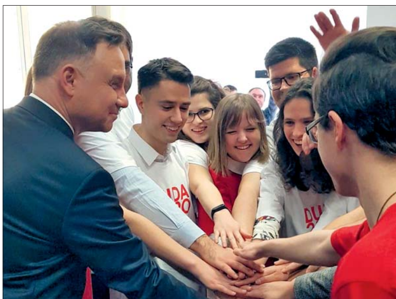
Drużyna prezydenta ruszyła do boju!

– Najważniejszym celem mojej prezydentury i obozu Zjednoczonej Prawicy jest to, aby podniósł się poziom życia Polaków – mówił inaugurując swoją kampanię wyborczą prezydent Andrzej Duda. – Wiem na pewno, że Polska zmieniła się w wielu aspektach na lepsze i to jest dla mnie powód do wielkiej satysfakcji. Mam jednak przeświadczenie jednego – ten proces musi być kontynuowany. Polska zmienia się na lepsze, ale do doskonałości jej daleko – zaznaczył prezydent, zapowiadając intensywną i prowadzoną z kulturą kampanię.