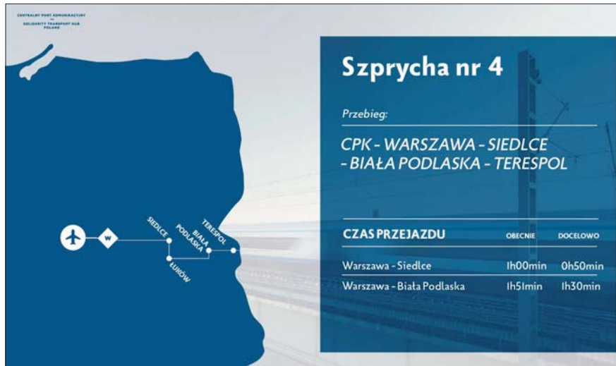
Czwarta „szprycha” kolejowa CPK przyczyni się do rozwoju Południowego Podlasia

Trwają prace nad budową Centralnego Portu Komunikacyjnego, który będzie jednym z największych węzłów transportowych na świecie. Jedną z kolejowych „szprych” CPK stanowi połączenie Portu i Warszawy z Południowym Podlasiem. Pociągi, po przejechaniu przez Siedlce pojadą do Łukowa, a potem do Białej Podlaskiej i Brześcia. Kolejną szansą dla naszego regionu będzie łącząca kraje nadbałtyckie z Warszawą a następnie Berlinem trasa szybkiej kolei Via Baltica.