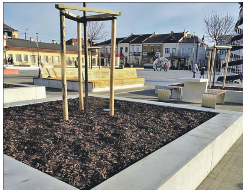
Po rewitalizacji Placu Wolności przyszedł czas na inne części miasta

Władze miasta zapowiadają, że niebawem ogłoszone zostaną przetargi na wykonanie prac w ramach trzyletniego programu rewitalizacyjnego. W dawnym ODK powstanie Centrum Spotkań Międzypokoleniowych zaś na Placu Wolności stanie posąg Jelenia Królewskiego, nawiązujący do herbu Parczewa. Zmieni się też samo osiedle przy ul. Polnej – powstaną tam place zabaw, siłownie i stoły do gry w szachy. Wybudowane zostaną chodniki przy al. Jana Pawła II (od ul. Deszczowej i Polnej) a te, które już istnieją będą wyremontowane. Ma być bezpiecznie: miasto kupi kamery, które zostaną podłączone do parczewskiego systemu monitoringu. Przypomnijmy, że w zeszłym roku w ramach rewitalizacji m.in. przebudowano Plac Wolności.