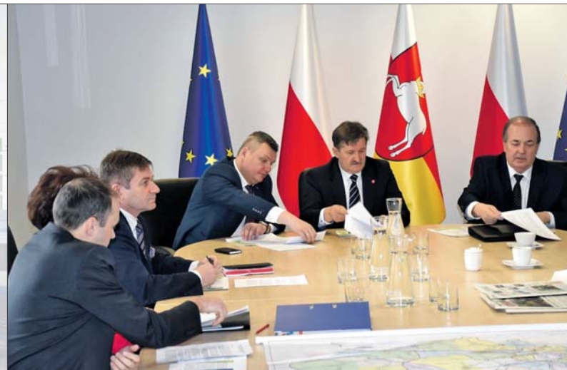
Spotkanie w Urzędzie Marszałkowskim