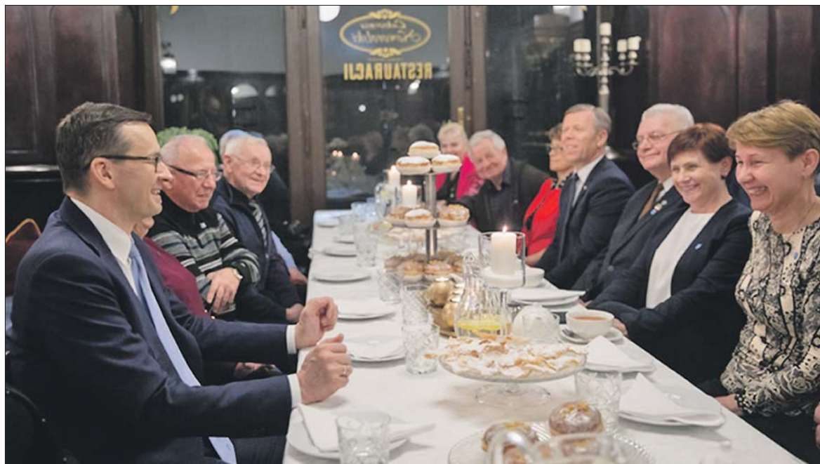
Emeryci otrzymują już zrewaloryzowane świadczenia. W tym roku otrzymają „trzynastkę” a w przyszłym – także czternastą emeryturę

Zgodnie z tegoroczną waloryzacją, od marca najniższe emerytury, renty z tytułu całkowitej niezdolności do pracy, renty rodzinne i renty socjalne wzrosły do 1200 zł brutto, a renty z tytułu częściowej niezdolności do pracy – do 900 zł brutto. Świadczenia do wysokości 1966,29 zł wzrosły o 70 zł brutto, natomiast świadczenia powyżej tej kwoty o 3,56 proc. Renty z tytułu częściowej niezdolności do pracy są wyższe o minimum 52,50 zł brutto, a emerytury częściowe – o co najmniej 35 zł brutto. Waloryzacja dotyczy świadczeń przysługujących na 29 lutego 2020 r.