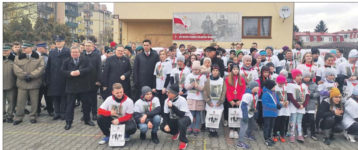
Wśród uczestników obchodów w Terespolu był senator Grzegorz Bierecki, inicjator wielu poświęconych Niezłomnym inicjatyw w naszym regionie

Południowe Podlasie pamięta o naszych bohaterach! W całym regionie odbyły się uroczystości związane z Narodowym Dniem Pamięci Żołnierzy Wyklętych. – To misja przywracania godności Polakom i pamięci bohaterom powstania antykomunistycznego – mówił senator Grzegorz Bierecki, który zainicjował ten proces w naszym regionie.