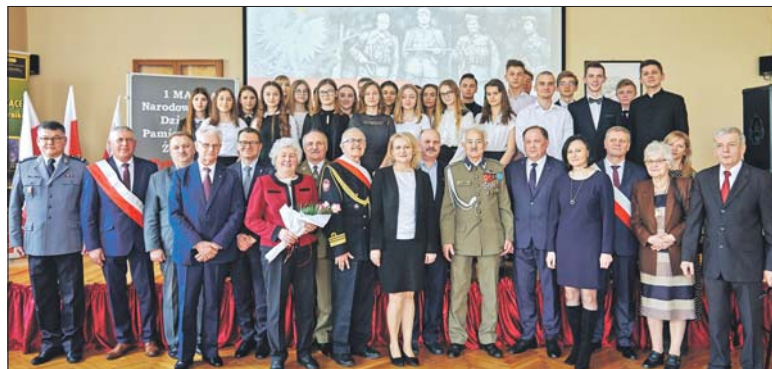
Wielkie święto w parczewskim liceum

Spółeczność szkolna I LO w Parczewie otrzymała sztandar Zrzeszenia Wolność i Niezawisłość, Koło w Parczewie.