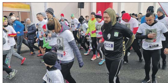
Bieg Tropem Wilczym to już stały element obchodzonego 1 marca święta