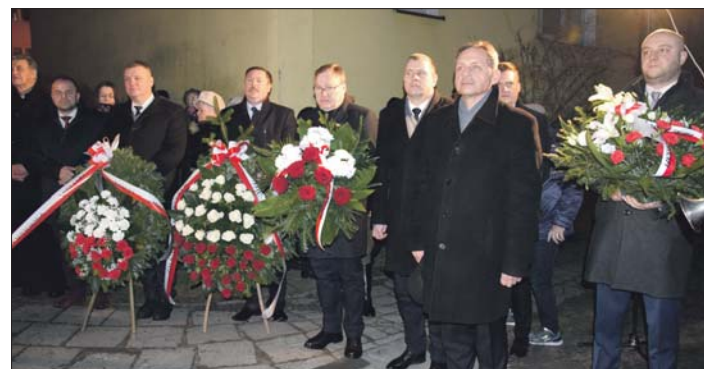
Bohaterów uczciliśmy także w Radzynie Podlaskiej