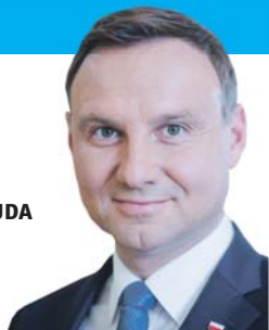
ANDRZEJ DUDA Prezydent RP

Chciałbym, żebyśmy byli państwem atrakcyjnym – to jest ważne. Chciałbym, żeby Polska była atrakcyjna, chciałbym, żeby była państwem spokojnym.