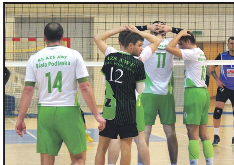
Siatkarze AZS AWF po przegranej z Kudłatym zajmują ostatnie miejsce w lidze