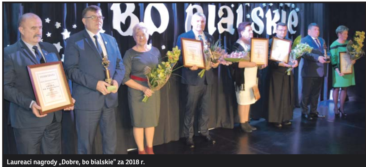
Laureaci nagrody „Dobre, bo bialskie” za 2018 r.

Statuetki „Dobre, bo bialskie” otrzymały Przedsiębiorstwo Handlowo-Usługowe „Farmer” z Rokitna, Sanktuarium Matki Bożej Kodeńskiej, Firma „Diana” z Białej Podlaskiej, Janowski Zamek Biskupi oraz Gmina Międzyrzec Podlaski, a 9 osób oraz instytucji uhonorowano medalem Zasłużony dla Powiatu Bialskiego.