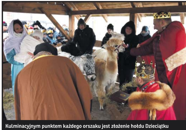
Kulminacyjnym punktem każdego orszaku jest złożenie hołdu Dzieciątku

Orszak Trzech Króli odbył się w tym roku w 751 miejscowościach Polski i w 13 państwach Europy, obu Ameryk i Afryki. Wzięło w nim udział 1,2 mln ludzi, jak ocenia Fundacja „Orszak Trzech Króli”, od 2010 r. koordynator tych największych ulicznych jasełek świata. Aż trudno uwierzyć, że to dopiero jedenaasta edycja tego wydarzenia, które zapoczątkowały jasełka zorganizowane w 2005 r. w jednej z warszawskich szkół. Pierwszy Orszak przemaszzerował ulicami Warszawy w 2009 roku, w kolejnym również i w Toruniu. Wówczas też po raz pierwszy uczestników pozdrowił Ojciec Święty i od tego czasu czyni to każdego roku najpierw Benedykt XVI, a obecnie Papież Franciszek. Od 2011 r., kiedy 6 stycznia został dniem wolnym od pracy, dynamicznie rośnie tak liczba miast, w których organizowane są orszaki, jak i ich uczestników. 6 stycznia br. W Orszaku Trzech Króli wzięli udział także mieszkańcy Białej Podlaskiej, Radzyna, Parczewa, Mię-