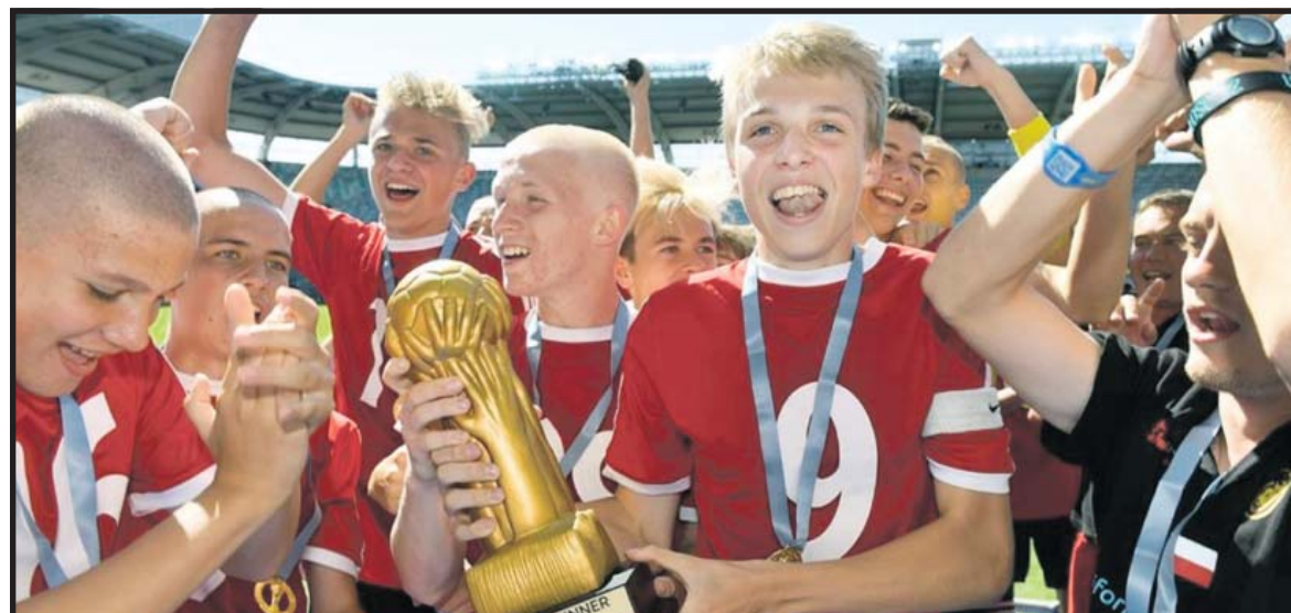
Zespół U-15, ubiegłoroczny triumfator turnieju Gothia Cup, w którym do zera pokonał drużyny z Brazylii, USA, Zambii, Chin, Szwecji i Kosowa, a jedyną bramkę stracił w meczu finałowym z drużyną z Islandii

Jestem pozytywnie zaskoczony frekwencją na treningach, widać że chłopcy chcą pracować, a jeśli do tego dodamy jeszcze coraz większą intensywność, będziemy mogli dużo więcej powiedzieć o naszych mocnych