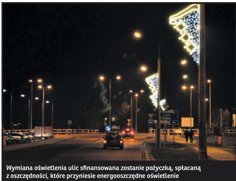
Wymiana oświetlenia ulic sfinansowana zostanie pożyczką, spłacaną z oszczędności, które przyniesie energooszczędne oświetlenie

na kortach trawiastych, plakaty tenisowe z lat 90. I 10 starych drewnianych przedwojennych rakiet tenisowych.