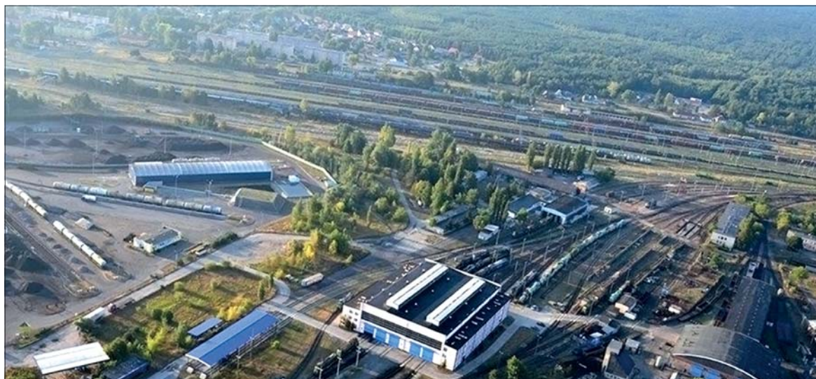
Małaszewicze mają szansę stać się wielkim centrum logistycznym. To będzie gospodarczy silnik dla naszego regionu