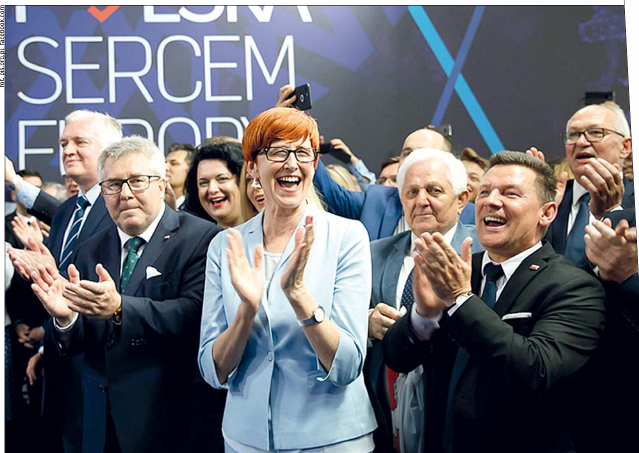
W sztabie wyborczym PiS panowały doskonałe nastroje. W naszym regionie prawica wygrała we wszystkich gminach!

PiS zdecydowanie wygrało wybory do europarlamentu w każdej gminie Południowego Podlasia (i każdej województwa lubelskiego)! Dzięki wysokiej frekwencji i bezprecedensowemu rozkładowi głosów Lubelszczyzna będzie miała dwie reprezentantki prawicy w Brukseli: obecną wicemarszałek Sejmu Beatę Mazurek i posłankę Elżbietę Kruk.