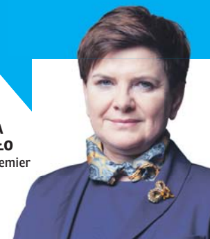
BEATA SZYDŁO Wicepremier

Ja firmuję politykę rządu, który od 2015 roku zrealizował bardzo dużo projektów dla Polaków, w tym społecznych. Najważniejsze jest to, że dotrzemy słowa i jesteśmy wiarygodni