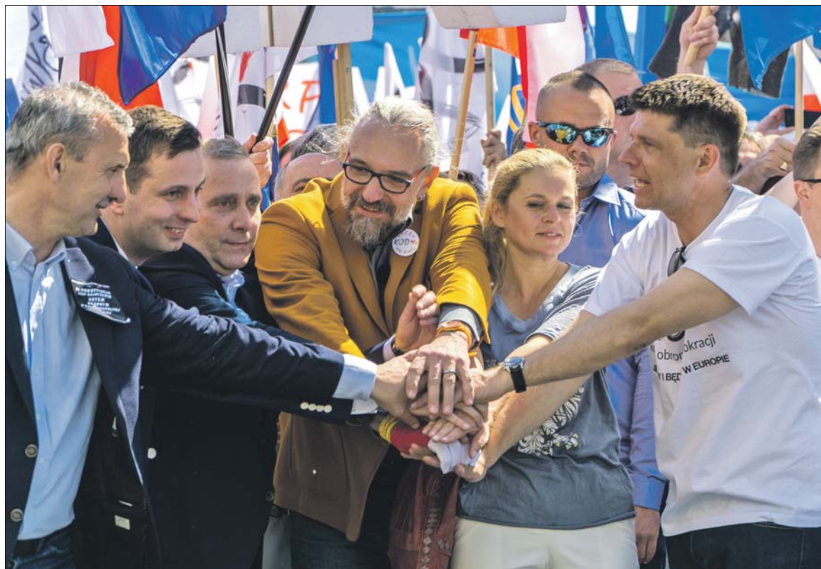
Przez ostatnie lata opozycja wiele mówiła o „jedności”. Okazało się, że łączy ich tylko niechęć do PiS. Polacy tego nie zaakceptowali

– Pojawiający się w mediach pomysł na wystawienie jednej listy opozycji do Senatu, uważamy za interesujący. Listy senackie to platforma, na której