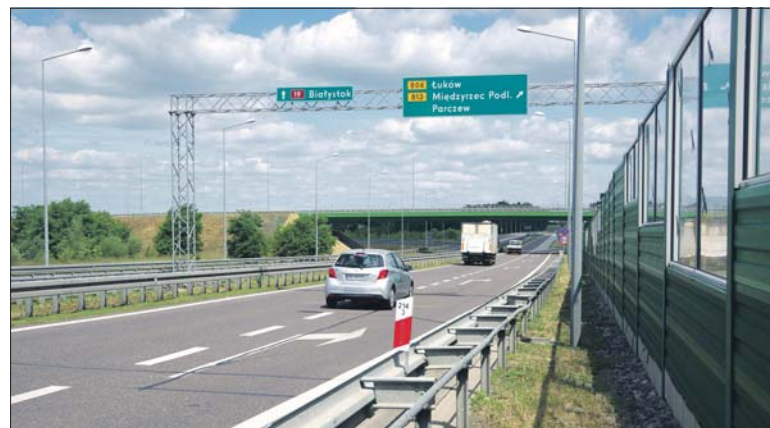
Via Carpatia, której budowa przyspiesza dzięki PIS, zmieni oblicze naszego regionu

Krok po kroku posuwają się prace związane z budową trasy Via Carpatia. Generalna Dyrekcja Dróg Krajowych i Autostrad prowadzi konsultacje dotyczące odcinka Międzyrzec Podlaski-Kock. Pierwsza tura konsultacji, przeznaczona dla mieszkańców gminy Kąkolwnica i gminy Międzyrzec Podlaski odbyły się 30 maja. Kolejne organizowane są 4 czerwca. Mieszkańcy gminy Radzyń Podlaski będą mogli zadać pytania i zapoznać się z planowanym przebiegiem trasy podczas spotkania w Świątlicy Wiejskiej w Białej (start o godz. 10) zaś mieszkańcy Radzyń Podlaskiego są zaproszeni do Urzędu Miasta (sala konferencyjna na parte-