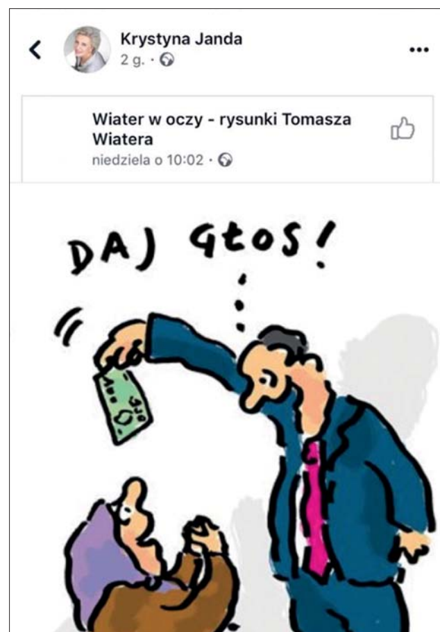
PF Skandaliczny rysunek umieściła w internecie aktorka Krystyna Janda

Taki to szacunek do zwykłych ludzi okazują gwiazdy, które przecież zarabiają tylko dlatego, że ktoś chce oglądać filmy z ich udziałem i chodzić na ich spektakle.