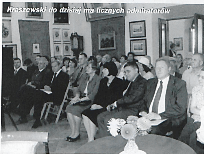
Kraszewski do dzisiaj ma licznych admiratorów

przez 30 lat. Jest to niewątpliwy zapis rozległych i różnorodnych kontaktów pisarza. - Jego ogromna rola w literaturze, kulturze i w wielu innych dziedzinach życia narodowego sprawiły, iż wśród osób, które nadesłały mu swoje podobizny, lub których