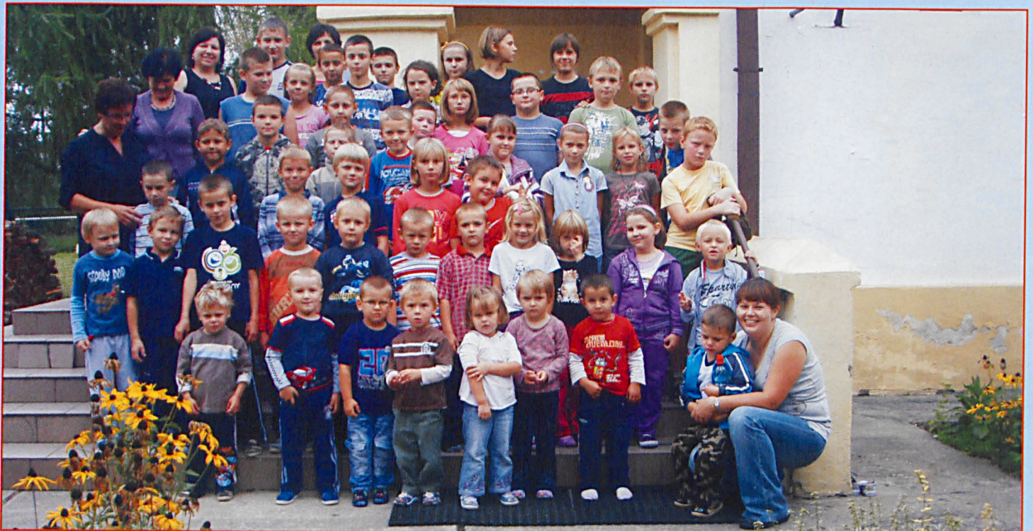
Uczniowie Szkoły Podstawowej w Motwicy