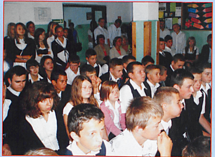
Gimnazjum w Sosnowce