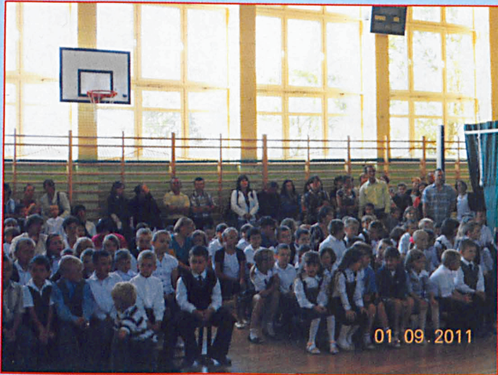
Szkoła Podstawowa w Sosnowce