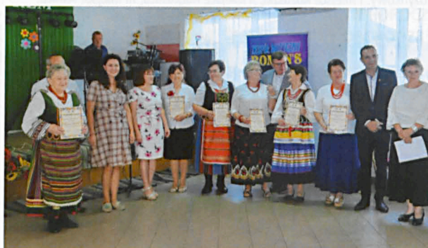
Uczestnicy otrzymali pamiątkowe dyplomy.