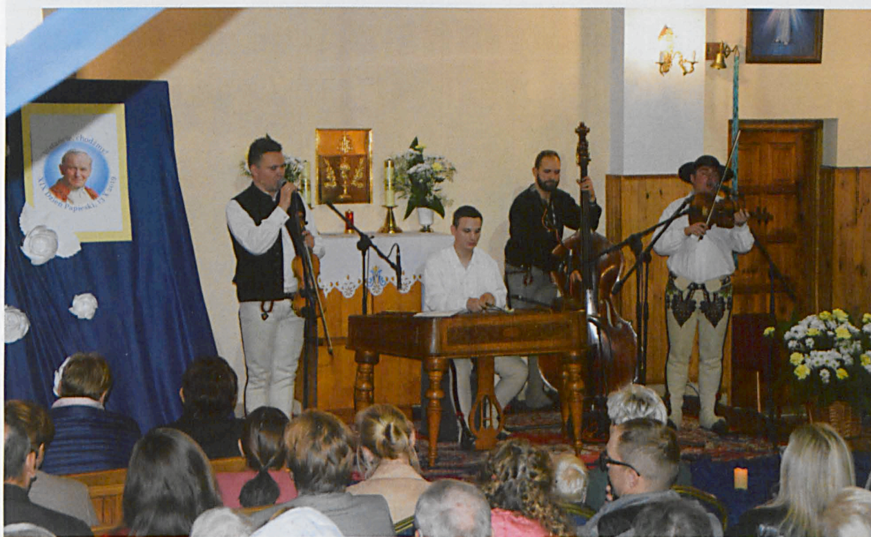
Folk kapela „Górska Hora” wprowadziła wyjątkową atmosferę do kaplicy w Przychodach

kapela „Górska Hora”, dzięki której mogliśmy usłyszeć koncert „Nuty Górskie Świętego Jana Pawła II” i zaśpiewać ulubione pieśni Ojca Świętego. Na zakończenie uroczystości Kaplicę wypełniła pieśń „Barka”, zaśpiewana od serca przez wszystkich obecnych.