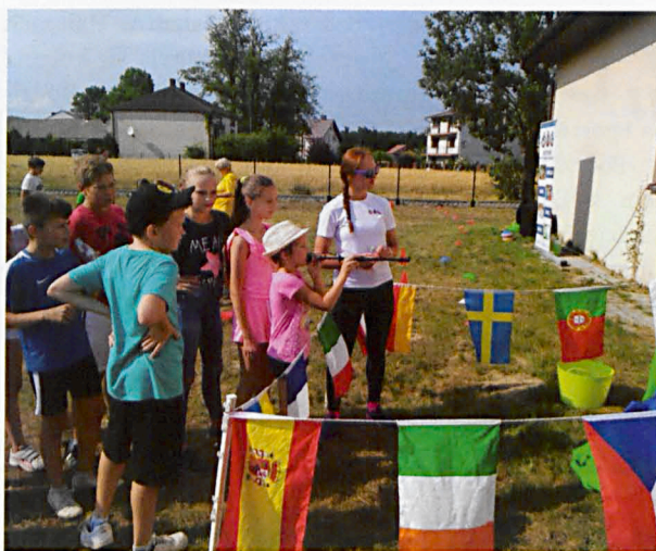
Na zdjęciu konkurencja strzelanie ze strzałek do tarczy

W pikniku rodzinnym wzięło udział około 50 dzieci wraz z rodzicami. Wśród atrakcji dla uczestników wymienić można puszczanie baniek mydlanych, strzelanie ze strzałek do tarczy, biegi i inne zabawy zręcznościowe na świeżym powietrzu. Celem wydarzenia było zachęcenie mieszkańców Miś i okolic do aktywnego, rodzinnego spędzania wolnego czasu. Piknik nie był pierwszą tego typu inicjatywą działającego od ponad 2 lat stowarzyszenia. W swym dorobku Przyjazne Misie mają m. in. „Spotkanie z Mistrzem”, w ramach którego Misie odwiedziła Malwina Kopron – lekkoatletka, olimpijka specjalizująca się w rzucie młotem.