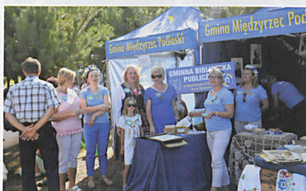
Do namiotu biblioteki nieustannie zaglądali uczestnicy dożynek, by skorzystać z przygotowanych atrakcji