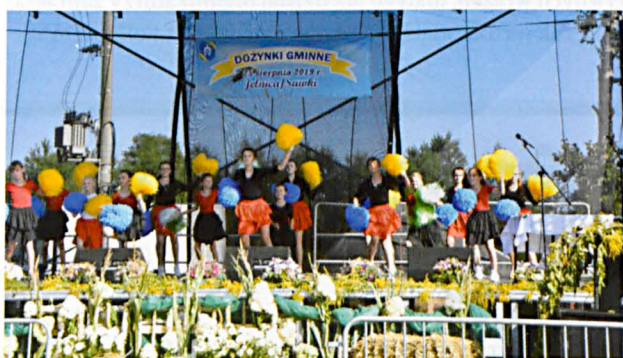
W części artystycznej wystąpiły dzieci i młodzież ze szkół podstawowych w Misiach, Tluściciu i Tuliłowie, dzieci i młodzież reprezentujące wieś Krzewica, Gminna Grupa Taneczna działająca przy GOKU, a na ludową nutę zaśpiewały zespoły ludowe z terenu gminy.