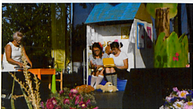
Nauczyciele Przedszkola w Rzczycu przygotowali inscenizację pt. „Opowieści nie tylko śmiesznej treści spod Grabowieckiego lasu” oraz samodzielnie wykonali stroje i scenografię do przedstawienia.