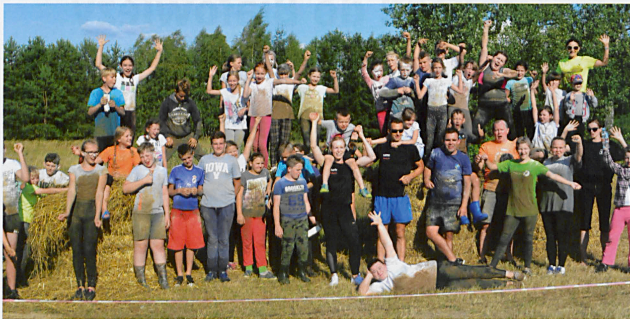
Dla uczestników Strzakłogeddonu błoto, woda, piach i brud nie były straszne

Po zakończonym biegu na uczestników czekały pyszne kielbaski z grilla oraz ciekawe nagrody. Druhowie z OSP Strzakły przygotowali zaś pokaz gaszenia słomy oraz kurtynę wodną.