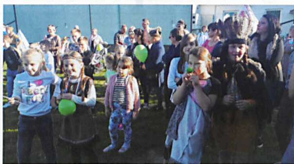
Uczestnicy zabawy zaskoczyli pomysłami i kreatywnością w tworzeniu strojów w stylu indiańskim

Uczestnicy musieli zmierzyć się z następującymi konkurencjami: wypiekanie podpłomyków na kamieniu, strzały do celu z łuku, słalom szeryfa, strzelanie do „dzikiej zwierzyny”