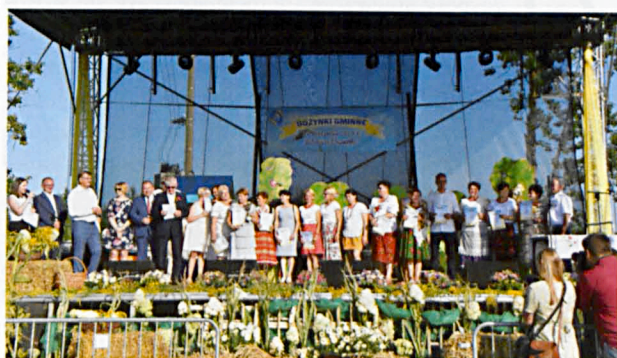
Stowarzyszenia przygotowały moc atrakcji i konkursy z nagrodami. Stowarzyszenie Moja Gmina, Stowarzyszenie rozwoju wsi Pościszce i Tuliłów, Stowarzyszenie Przyjazne Misię, GLKS „Krzna” Rzczyca – wielkie podziękowania za zaangażowanie. Swoje stoiska wystawiły Gminny Ośrodek Kultury i Gminna Biblioteka Publiczna.