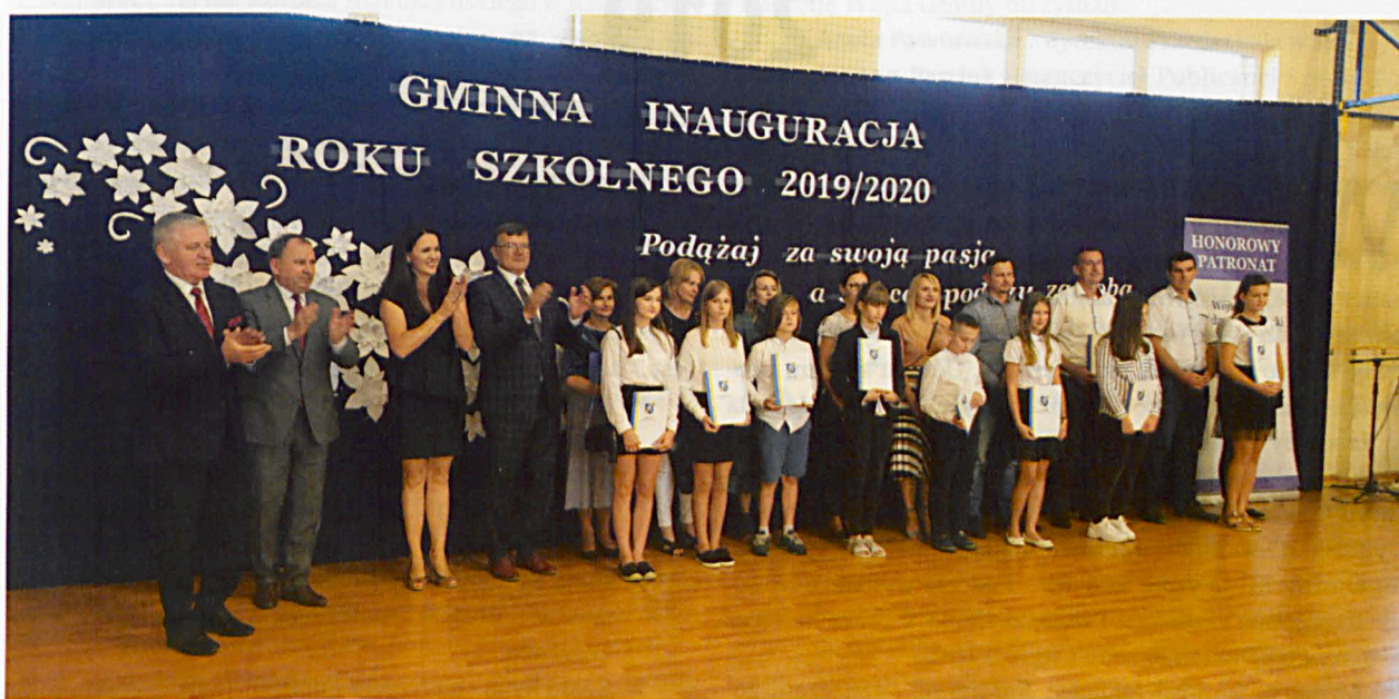
W sumie 123 uczniów otrzymało we wrześniu stypendia motywacyjne oraz sportowe