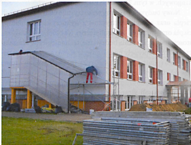
Budynek Szkoły Podstawowej w Tłusćcu po termomodernizacji

W Publicznej Szkole Podstawowej im. Mikołaja Kopernika w Tłusćcu już widać efekty prac termomodernizacyjnych. Docieplone zostały przegrody zewnętrzne, drzwi i okna w budynku zostały wymienione, przeprowadzono modernizację instalacji c.o. oraz c.w.u., a w tym montaż kotła na pellet z automatycznym podajnikiem paliwa. Szkoła wzbogaciła się o nowy system automatyki pogodowej, instalację fotowoltaiczną, a oświetlenie zmodernizowano do technologii LED. Podobny zakres robót zostanie przeprowadzony w budynku Publicznej Szkoły Podstawowej im. Karola Krysińskiego w Rudnikach.