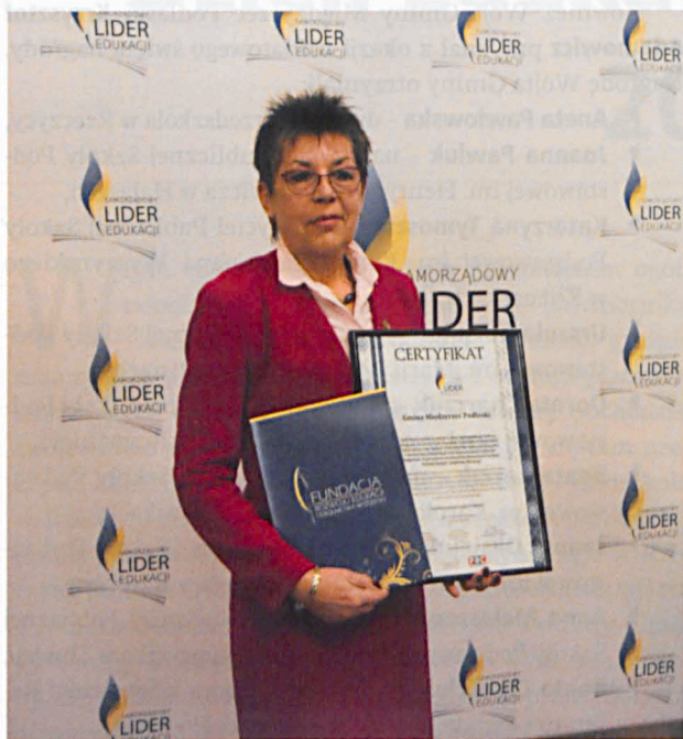
W procedurze certyfikacyjnej w tym roku wzięło udział 140 samorządów. Jedynie 38 z nich uzyskało certyfikat, w tym Gmina Międzyrzec Podlaski

W ocenie Komisji aktywność Gminy ukierunkowana na wdrażanie innowacji oświatowych, rozwój nowoczesnych form kształcenia oraz budowanie w JST klimatu przyjaznego nauce, młodzieży uczącej się i środowiskowi oświatowym w pełni uzasadnia wyróżnienie Gminy Międzyrzec Podlaski Znakiem Jakości ustanowionym przez Fundację Rozwoju Edukacji i Szkolnictwa Wyższego. Wraz z certyfikatem gminie przyznano także Wyróżnienie Primus za uzyskanie najwyższej możliwej liczby punktów rankingowych w procedurze certyfikacyjnej oraz Certyfikat Srebrny za uzyskanie po raz czwarty wyróżnienia Samorządowy Lider Edukacji.