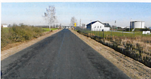
Nowa nawierzchnia drogi Żabce-Halasy przy Stacji Uzdatniania Wody w Halasach