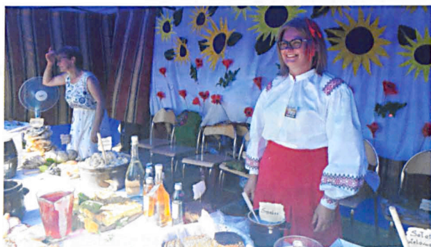
Konkurs na najpiękniejsze stoisko promujące wieś: I miejsce Sawki–Jelnica (na zdjęciu), II miejsce Rzczyca, III miejsce Żabce. Konkurs na najlepszy chleb dożynkowy: I miejsce Kożuszki, II miejsce Rogoźnica, III miejsce Jelnica.