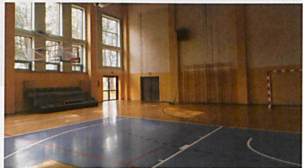
Powierzchnia użytkowa sali wynosi 1557,31 m 2