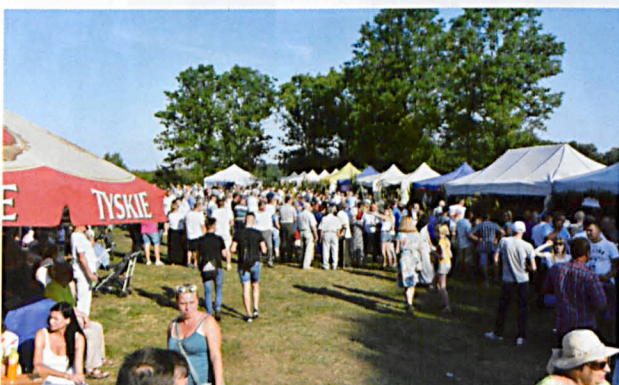
Wszystkie stoiska promujące wsie, namioty GOKU, Biblioteki Gminnej i stowarzyszeń z terenu Gminy były oblegane przez uczestników dożynek.