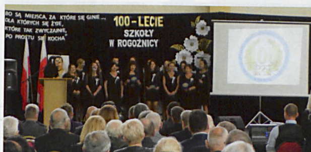
Jubileusz rozpoczął się od odśpiewania hymnu państwowego, który zaintonował chór złożony z absolwentów, rodziców i byłych belfrów szkoły oraz żołnierze z Jednostki Wojskowej 3533 w Roskoszy.