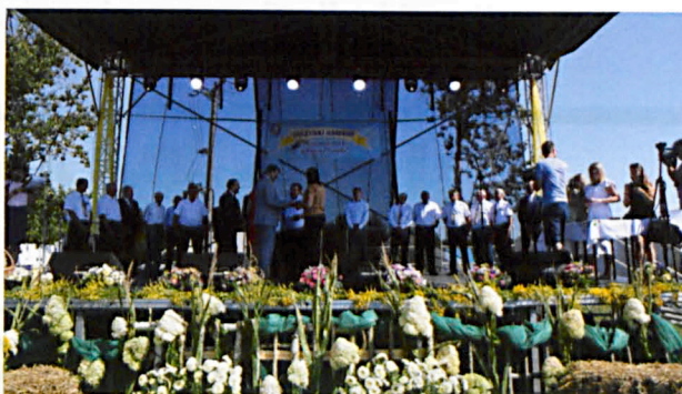
Obchody dożynek wiążą się także rokrocznie z oficjalnym wręczeniem odznaczeń mieszkańcom zasłużonym dla rolnictwa w Gminie Międzyrzec Podlaski. W tym roku uhonorowano 21 rolników z terenu naszej gminy.