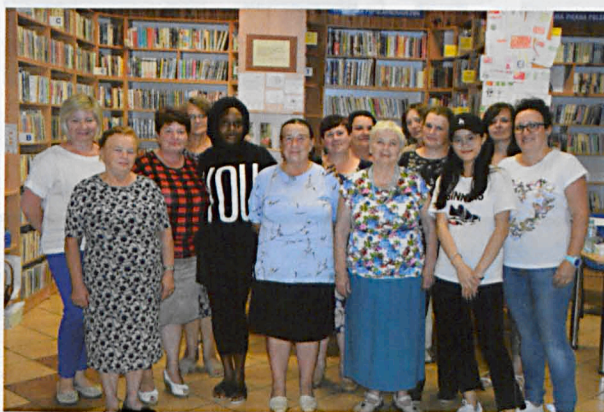
Pamiętkowe zdjęcie wolontariuszy z Kołem Gospodyń Wiejskich w Tuścu