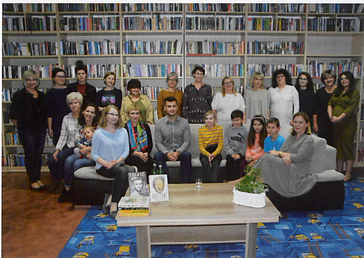
Pamiętkowe zdjęcie uczestników spotkania z pisarzem