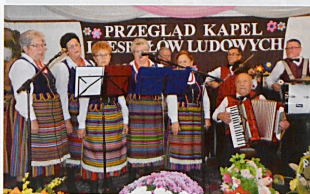
Zespół-gospodarze „Ale Baby” z kapelą z Berezy

W przeglądzie udział wzięło 14 zespołów śpiewaczych: „Ale Baby” z kapelą z Berezy, „Harmonijkowe Echo”, „Sami