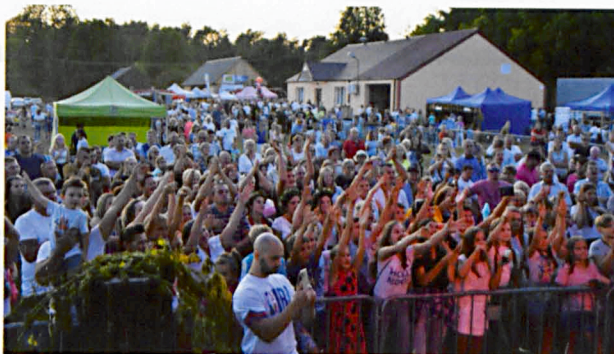
O godz. 19.00 do zabawy porwały występy gwiazd znanych z kanału POLO TV – Fortex, Macho, Power Boy oraz B-QII.