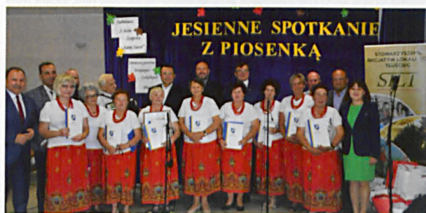
W wydarzeniu w Tłuścą wzięli udział przedstawiciele władz parlamentarnych, władz województwa i powiatu.