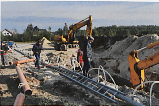
Prace montażowe kanalizacji przy ul. Gościniec w Rzeczycy

Projekt budowy kanalizacji został zrealizowany w latach 2018-2019. Łączna długość oddanej do użytku kanalizacji to 19,5 km za kwotę 10 503 475,51 zł. To jedna z największych inwestycji przeprowadzonych w Gminie Międzyrzec Podlaski w ostatnich latach. Do budowy I etapu kanalizacji gmina pozyskała środki z Programu Rozwoju Obszarów Wiejskich na lata 2014-2020 dla operacji typu „Gospodarka wodno-ściekowa” w ramach poddziałania „Wsparcie inwestycji związanych z tworzeniem, ulepszaniem lub rozbudową wszystkich rodzajów małej infrastruktury, w tym inwestycji w energię odnawialną i w oszczędzanie energii”. Dofinansowanie to wyniosło 1 083 700 złotych.