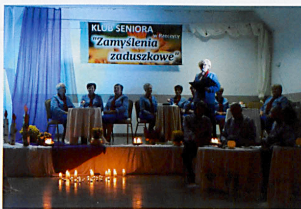
Klub Seniora z Rzeczy chętnie organizuje nastrojowe, pełne zadumy i wspomnień wydarzenia dla lokalnej społeczności