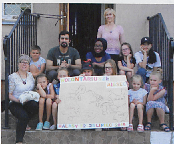
Warsztaty z wolontariuszami w Halasach