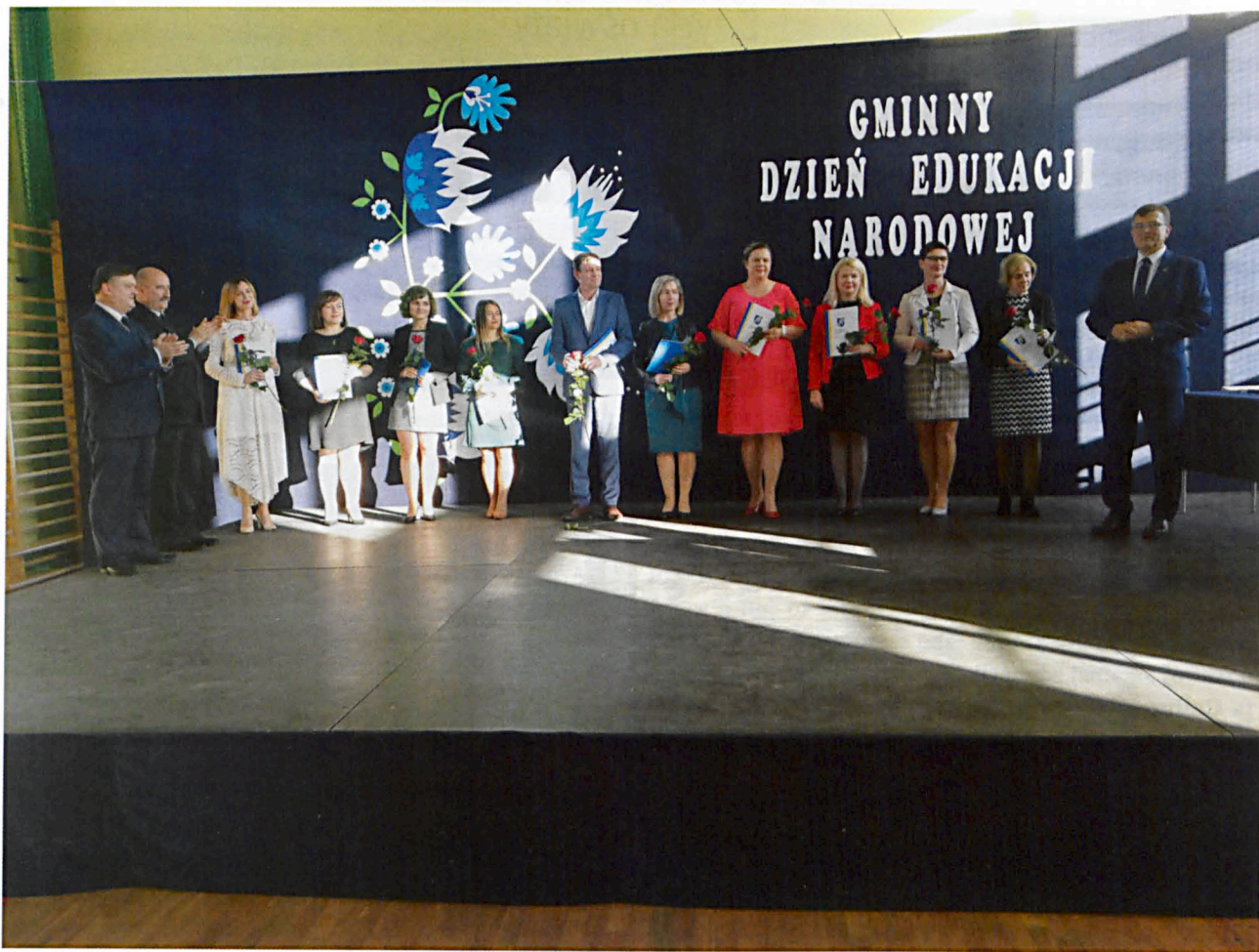
Osoby, które otrzymały nagrodę Wójta Gminy Międzyrzec Podlaski