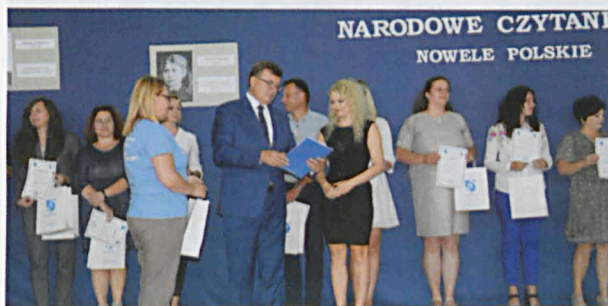
Do konkursu „Duch książki na fotografii” wpłynęło 17 prac w 3 kategoriach wiekowych. Nazwiska zwycięzców i wyróżnionych znajdują się na www.miedzyrzecgmina.pl