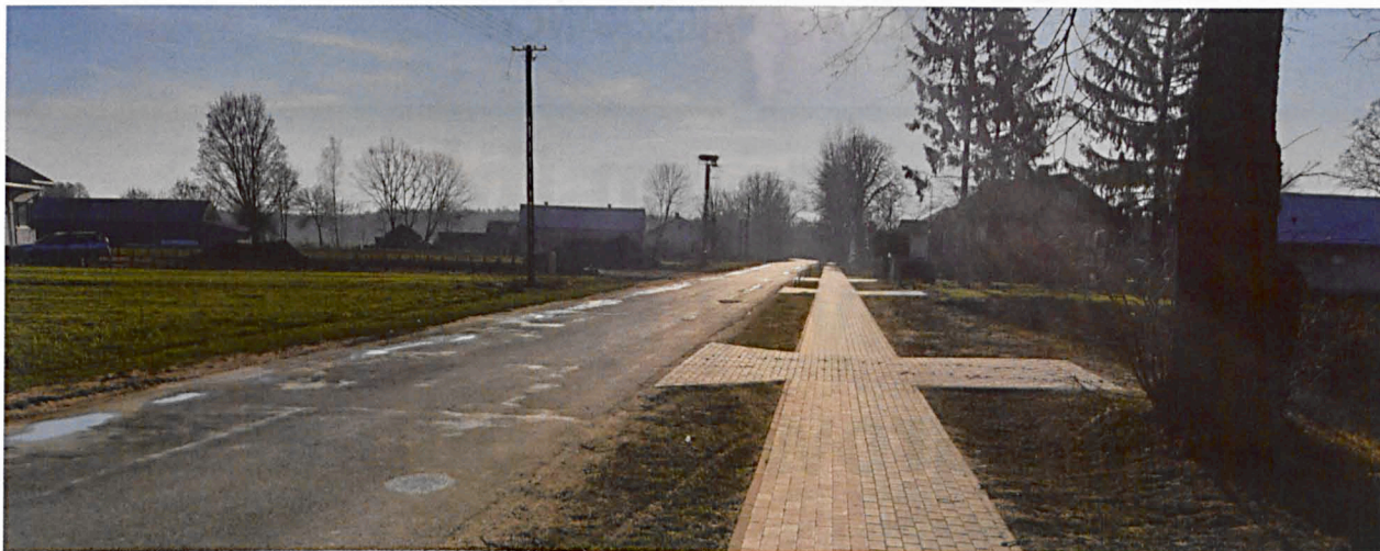
Fragment chodnika w Krzewicy na odcinku w kierunku Wólki Krzymowskiej