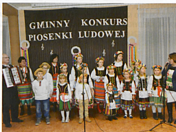
Na zdjęciu dziecięcy zespół ludowy „Hreczka” z Zaścianek wraz z członkiniami „Leśnego Echa” z Zaścianek