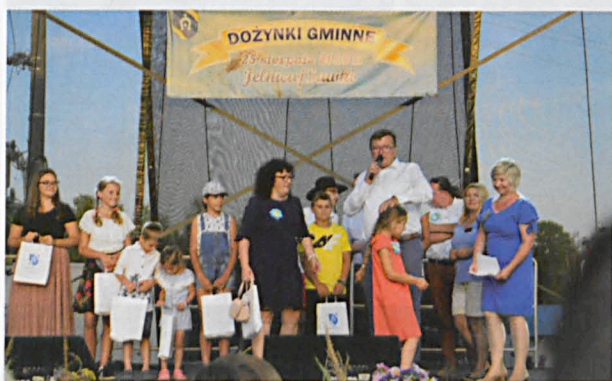
Nagrody otrzymane w konkursie Biblioteki zostały wręczone na dożynkowej scenie

PODCZAS GMINNYCH DOŻYNEK WE WSI SAWKI I JELNICA GMINNA BIBLIOTEKA PUBLICZNA PREZENTOWAŁA NA STOISKU W STYLU RETRO ARCHIWALNE WYDANIA GAZET, STARE PŁYTY WINYLOWE I KSIĄŻKI ORAZ ZDJĘCIA UKAZUJĄCE ŻYCIE MIESZKAŃCÓW NASZEJ GMINY W I POŁOWIE XX WIEKU. DLA OSÓB ODWIEDZAJĄCYCH STOISKO PRACOWNICY BIBLIOTEK PRZYGOTOWALI KOTYLIONY, LOTERIĘ Z NAGRODAMI ORAZ ZAPROSZENIA W FORMIE ZAKŁADEK NA NARODOWE CZYTANIE.