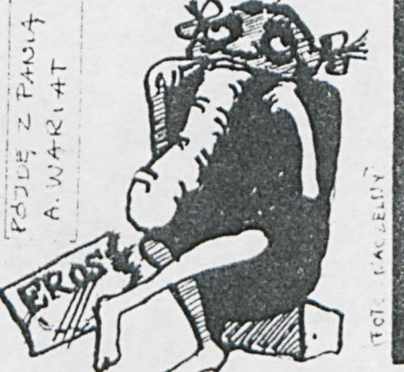
POJĘŁ Z PAŃSTWA A. WARIAT [NACZELNY]