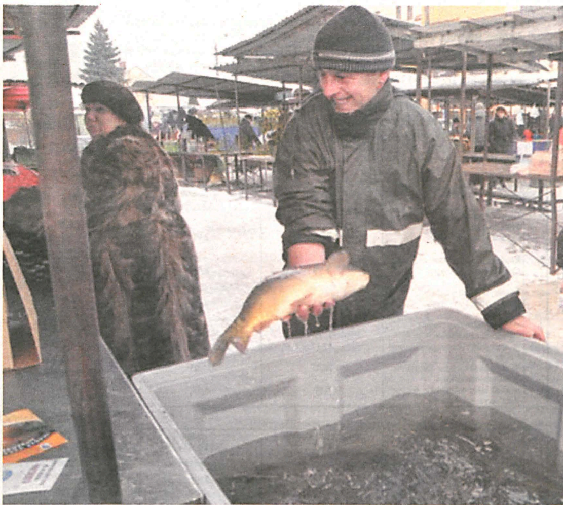
Karp na wigiliny stół

– Oczywiście, w gruncie irytuje mnie taki, a nie inny wygląd różnych kwestii przedświątecznych, między innymi zakupów i niekończących się obowiązków. Ale najłatwiej jest nam krytykować innych. Nie zdajemy sobie sprawy, że w rzeczywistości w większości jesteśmy wciągnięci w świąteczny młyn.