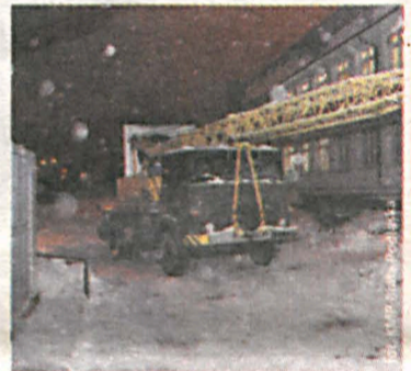
26-latek zakleszczony za dźwigiem

Do wypadku doszło, gdy mężczyzna podcepił linę, przy pomocy której dźwig miał wyciągnąć tira, który zapisał się w śniegu i nie mógł wyjechać. W wyniku zdarzenia pieszy doznał złamania lewej łopatki i przebywa w szpitalu. Zarówno kierowca, jak i pokrzywdzony byli trzeźwi.