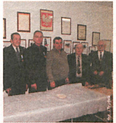
Weterani podzielili się białym chlebem

Śluchając płyt z kołędami, uczestnicy spotkania podzielili się opłatkiem, składając sobie wzajemnie życzenia zdrowia i sił w pełnieniu różnorodnych funkcji społecznych i zawodowych. Następnie uczestnicy zasiedli do stołu, na którym pojawiły się tradycyjne,