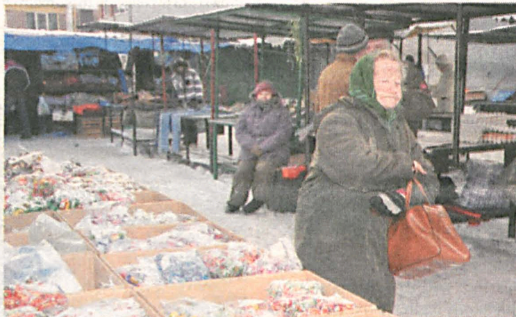
Smakołyki dla najmłodszych