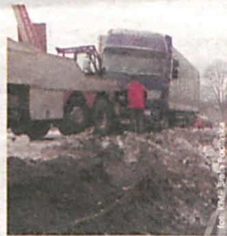
O mały włos nie doszło do tragedii