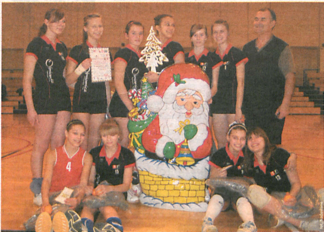
Białczanki podczas turnieju