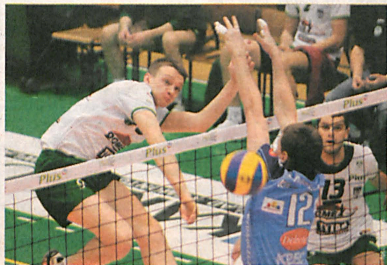
Występ białczanina w Częstochowie