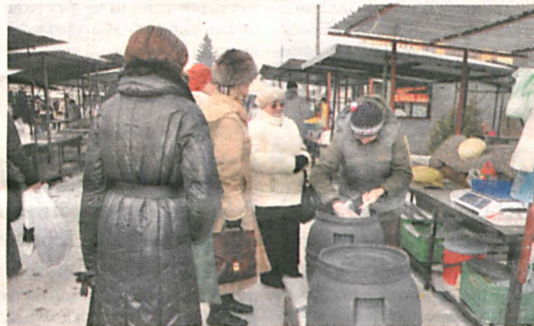
Zakupy na białskim targu