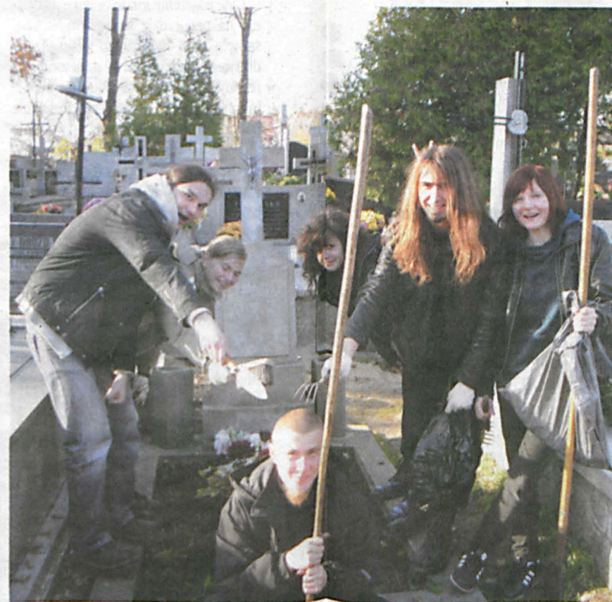
Sprzątanie zaniedbanych grobów przed świętami zmarłych