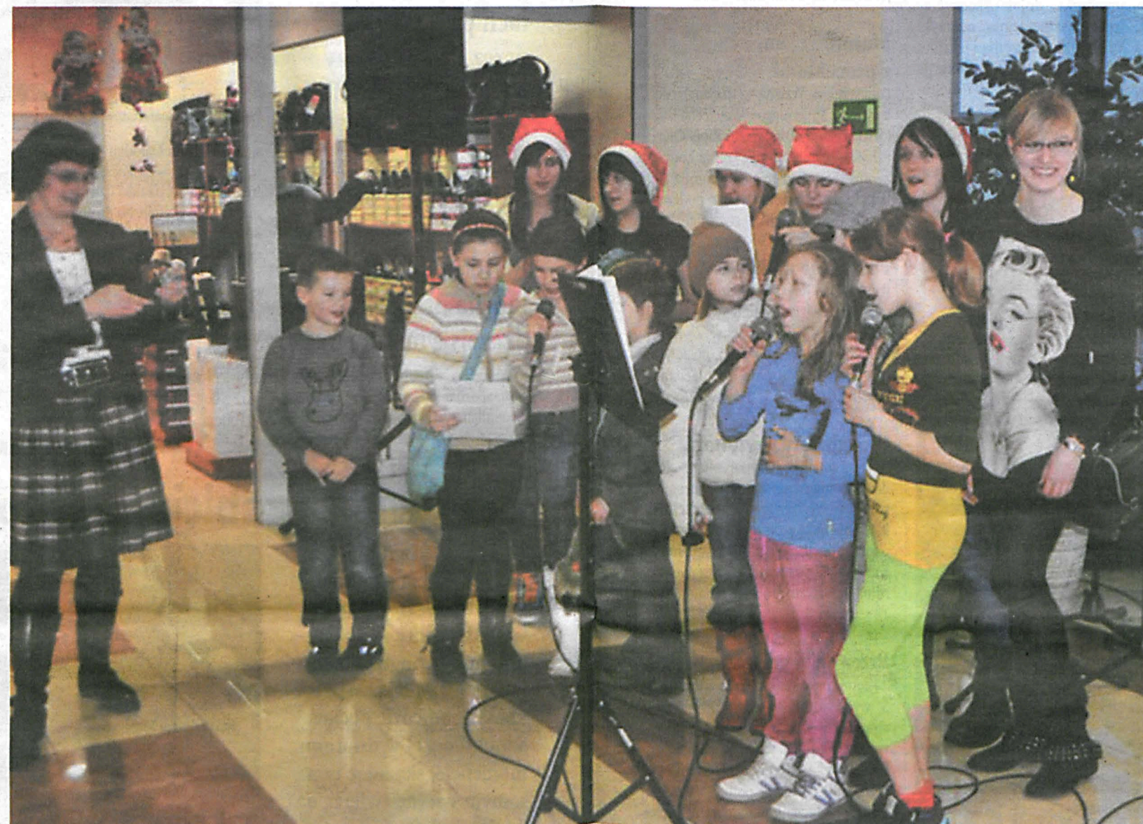
Wolontariusze śpiewają kolędy z dziećmi w Rywalu