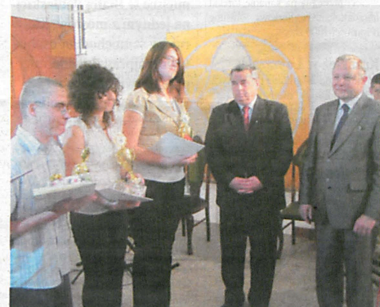
Wręczenie nagród laureatom konkursu „8 wspaniałych” przez prezydenta miasta Białą Podlaską Andrzeja Czapskiego