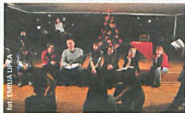
Rozmowa przed głównym spektaklem

Wolę pracować z młodzieżą, która kończy już gimnazjum, z licealistami bądź osobami dorosłymi. Pracowałem z dziećmi, są one dużo bardziej zdyscyplinowane. Z nimi pracuje się łatwiej. Więcej problemów, które szczególnie mogą zainteresować młodych ludzi, można poruszyć z młodzieżą starszą postrzegającą rzeczywistość bardziej krytycznie. Uczestnik tego przedsięwzięcia powinien być twórczy i mieć prawo do własnych ocen i interpretacji, tego co się wokół niego dzieje. Często mówię recytatorom i aktorom, że skoro wychodzisz na scenę, to chcesz mi coś powiedzieć, nie tekst, który ja sam mogę sobie przeczytać, natomiast ważne, co ty chcesz przez niego powiedzieć. Na pewno nie każdy zostanie aktorem i na pewno nie każdy chce nim zostać, ale