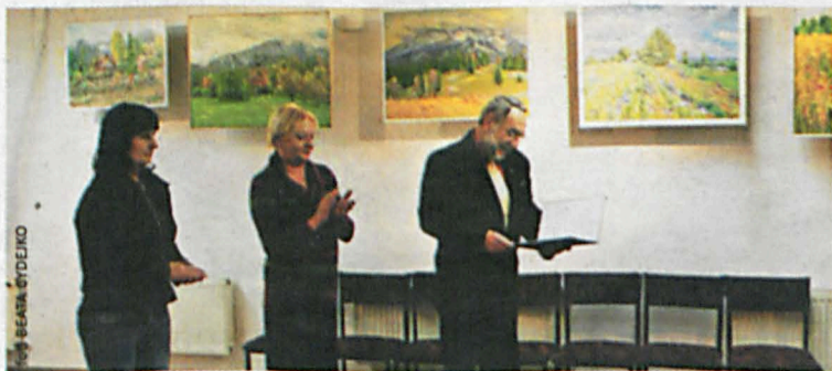
Otwarcie wystawy przez władze Miejskiego Ośrodka Kultury w Białej Podlaskiej