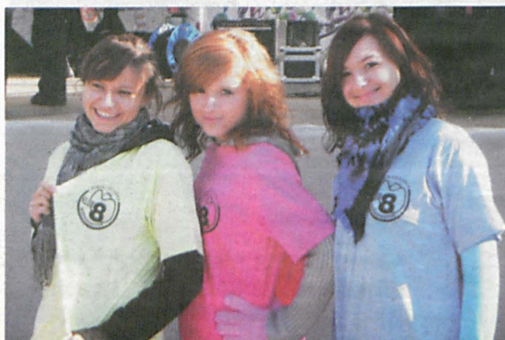
Wolontariuszki podczas festynu w „Mickiewiczu”

Szczegóły konkursu z pewnością znane będą bliżej terminu jego organizacji. Warto pomyśleć o nim już teraz. Jeżeli chciałbyś zostać wolontariuszem lub pragniesz założyć swój własny klub możesz skontaktować się bezpośrednio drogą e-mailową z instruktorem Fundacji „Świat Na Tak” pod adresem: klub8.bialapodlaska@gmail.com lub poszukać informacji w OKK Eureka.