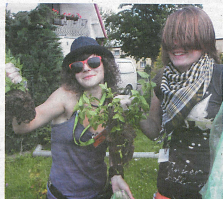
Prace w ogródku u starszej pani