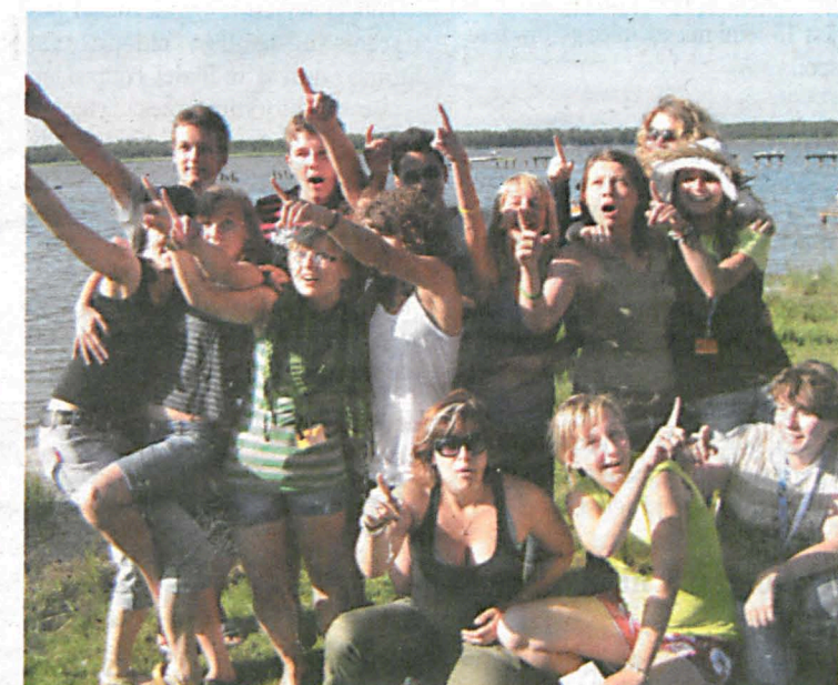
Wolontariusze fundacji „Świat Na Tak” z całej Polski na wycieczce nad morzem

KAROLINA BUZIAK redakcja@kurierbiański.pl