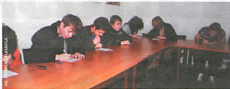
Pierwszy dzień warsztatów

Warsztaty dziennikarskie to możliwość poznania podstawowych zasad dziennikarstwa. Takie zajęcia odbyły