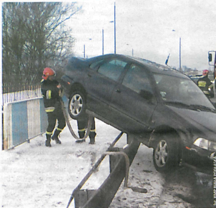
Samochód zawist na barierkę odgradzającą chodnik i ulicę

Do groźnie wyglądającego zdarzenia drogowego doszło na al. Jana Pawła II. Kierujący samochodem marki Volvo 36-letni mieszkaniec Białej Podlaskiej utracił panowanie nad pojazdem i uderzył w barierkę ochronną na moście. Przybyły na miejsce patrol ruchu drogowego zastał zawieszony tylnym kołem na barierce oddzielającej jezdnię od chodnika auto. Nietrudno sobie wyobrazić, co mogłoby się stać, gdyby siła uderzenia była nieco większa. Kierowca nie potrzebował pomocy lekarskiej. Oświadczył, że jadąc pokrytą błotem po-