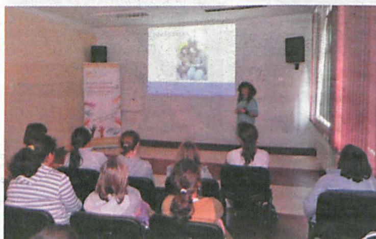
Szkolenia dotyczące promocji idei wolontariatu