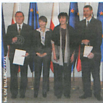
Przedstawiciele wyróżnionej szkoły

Poprzez udział w programie uczniowie mają możliwość odbycia kilkugodzinnych praktyk w wybranym miejscu pracy, zweryfikowania swoich wyobrażeń o wymarzoną zawódzie. Ponadto