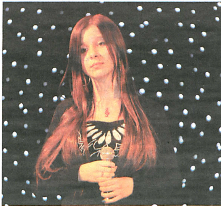
Koncert galowy Ogólnopolskiego Festiwalu pastoralki i kolędy współczesnej Kantyczka 2011 w Bielsku Podlaskim

Sam fakt, że mój tata jest jednocześnie moim instruktorem, bardziej mobilizuje mnie do pracy nad swoim głosem. W efekcie, głębiej zastanawiam się nad każdą wskazówką, jaką mi daje jako