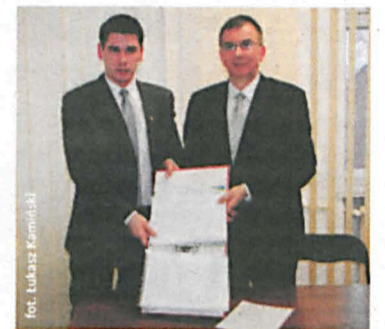
Zebrano 3225 podpisów

Wiceminister Masel zainteresował się też pociągami pośpiesznymi relacji Moskwa - Praga, jaki przejeżdża przez Białą Podlaską bez zatrzymania. Poseł uzyskał zapewnienie, że o ile nie staną na przeszkodzie problemy techniczne, to pociąg ten zacznie zatrzymywać się na dworcu w Białej, a dzięki temu przybędzie połączenie bezpośrednie