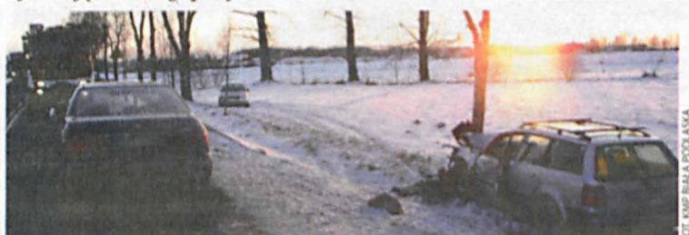
57-letnia kobieta z poważnym urazem głowy trafiła do szpitala