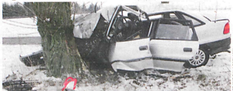
Młody mężczyzna zginął wjeżdżając w drzewo

W miniony weekend doszło do dwóch niebezpiecznych wypadków, które miały miejsce na drogach powiatu białskiego. Jeden z nich zakończył się tragicznie - śmiercią 29-letniego kierowcy, w następstwie drugiego ranna kobieta z poważnymi obrażeniami głowy znajduje się w szpitalu.