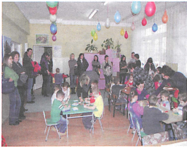
Kolejny raz Szkoła Podstawowa nr 2 zorganizowała dzień otwarty