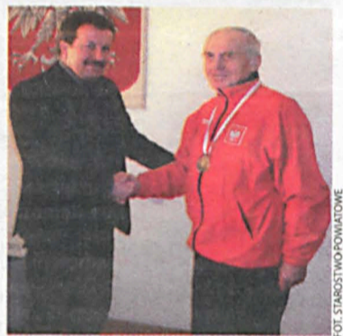
Starosta bialski wita Mistrza Polski

i jeden brązowy. Podczas spotkania wódcarz powiatu podziękował sportowcowi za wielokrotne reprezentowanie naszego kraju powiatu na zawodach krajowych oraz międzynarodowych. – Gratuluję panu – mówił podczas spotkania starosta, determinacji, zaangażowania i wyników. Kolejny złoty medal w pana kolekcji jest dowodem na to, że jest pan wyjątkowym sportowcem.