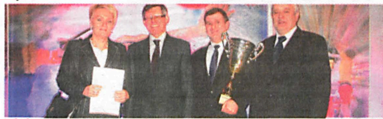
Władze miasta z ministrem Adamem Gierszem

Biała Podlaska najlepsza Polskiego Komitetu Olimpijskiego w Warszawie odbyło się podsumowanie współzawodnictwa sportowego dzieci i młodzieży za 2010 rok. Zaproszenia na uroczystość otrzymali przedstawiciele wyróżnionych województw, powiatów, gmin, klubów i uczniowskich klubów sportowych