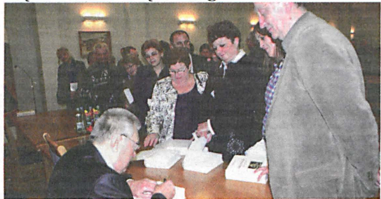
Autor monografii podpisuje pamiątkowe egzemplarze

W budynku białskiego magistratu odbyło się spotkanie związane z promocją pierwszej części trzeciego tomu monografii Białej Podlaskiej. Zorganizowane z inicjatywy prezydenta miasta oraz Miejskiej Biblioteki Publicznej przedsięwzięcie, zgromadziło liczne grono osób zainteresowanych historią i tożsamością naszego miasta.