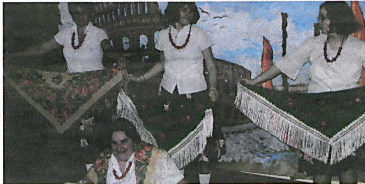
Uczestnicy WTZ w swoim występie