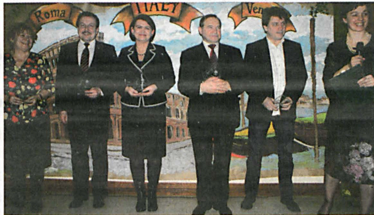
Uchonorowani i Serdeczni dla Warsztatów

Warsztaty przy białskim Ośrodku Caritas obchodziły trzecią rocznicę utworzenia. W ramach obchodów odbyły się występy uczestników warsztatów, wręczenie statuetek „Serdeczni dla Warsztatów” otrzymało je 22 osoby, firmy i instytucje. Na zakończenie przeprowadzono aukcję prac podopiecznych. Dochód z aukcji przeznaczony będzie na wyjazd niepełnosprawnych do