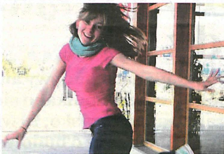
Od najmłodszych lat była artystką i zadowolona.

Narodził się podczas wyboru studiów. Całkiem niedawno zrozumiałam, że nie chcę być i na pewno nie zostanę specjalistką w dziedzinie chemii. Rzuciłam studia i całkiem niedawno na dobre i złe zaczęłam przygodę z tańcem. Ale to dopiero początek. Pomyślnie zaliczyłam pierwszy semestr zmagani. Miłość do tańca, ciągnie się z mną od najmłodszych lat. Dlatego wierzę, że decyzja o zajmowaniu się tańcem zawodowo, da mi pełną satysfakcję