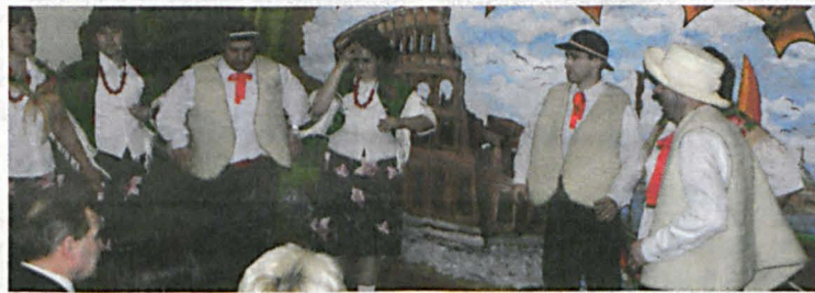
Pokaz uczestników i pracowników ośrodka