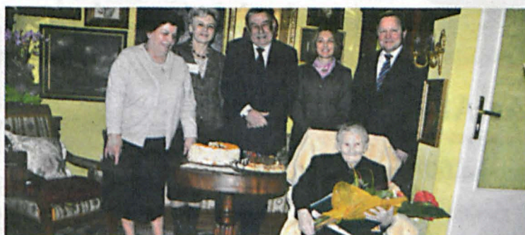
Goście wspólnie ze stulatką