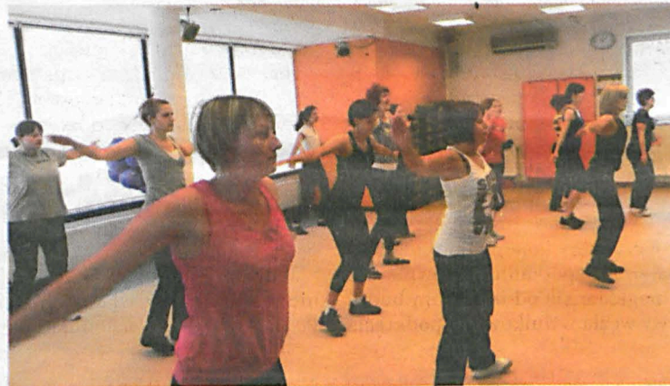
Kobiety podczas aerobicku

KAROLINA BUZIAK k.buziak@kurierbialski.pl