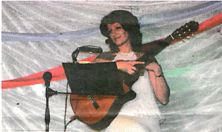
Artystka zabawiła publiczność ponad dwie godziny