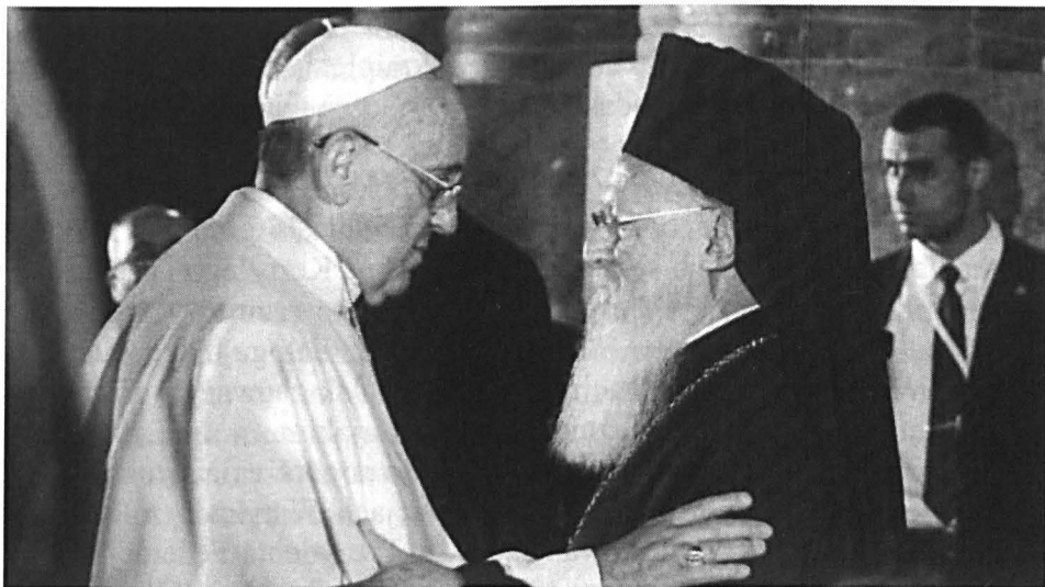
Fot. 1. Spotkanie papieża Franciszka z Patriarchą Ekumenicznym Konstantynopola – Bartłomiejem

nym Konstantynopola – Bartłomiejem 285 . Podejmowane są także próby rozmów z patriarchą Moskwy – Cyrylem 286 .