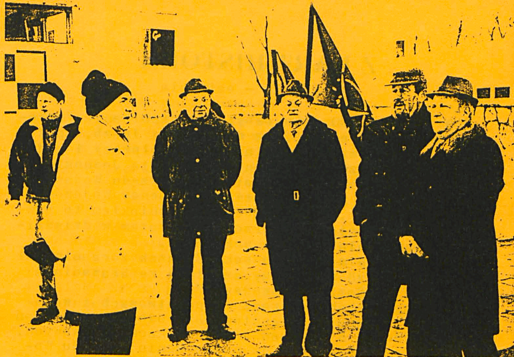
Pożegnanie sztandaru J.W. 5058 - 28.12.2000 r.