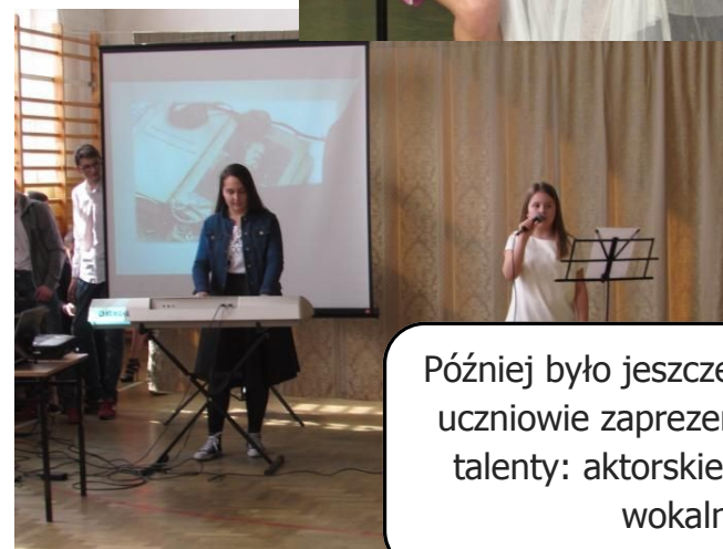
Później było jeszcze ciekawiej, bo uczniowie zaprezentowali swoje talenty: aktorskie, muzyczne i wokalne