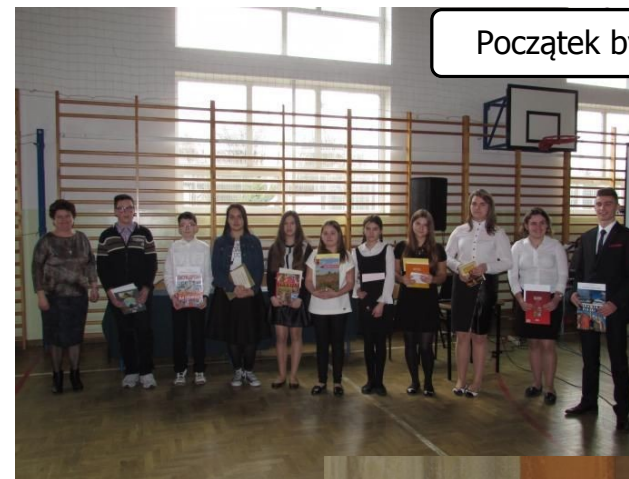
Początek był bardzo uroczysty