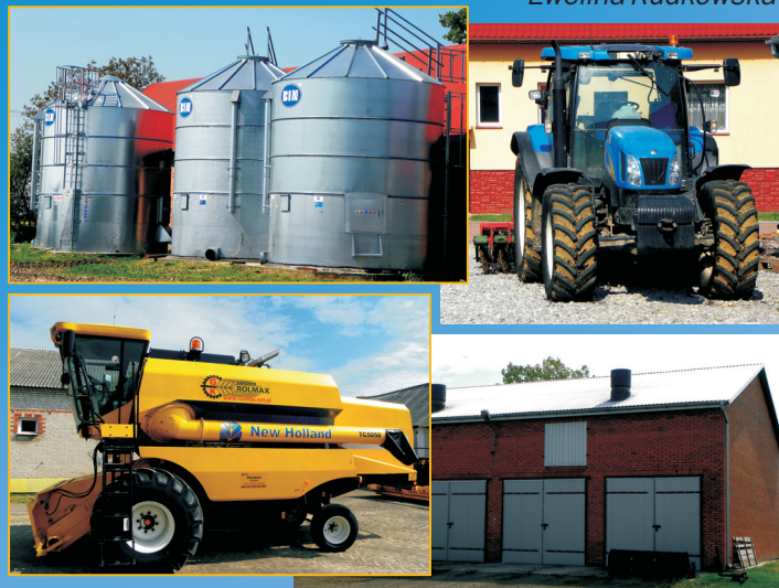
Budynki, maszyny i urządzenia rolnicze sfinansowane w ramach Programu SAPARD, Sektorowego Programu Operacyjnego 2004-2006, Programu Rozwoju Obszarów Wiejskich 2007-2013 na terenie Gminy Podedwórze