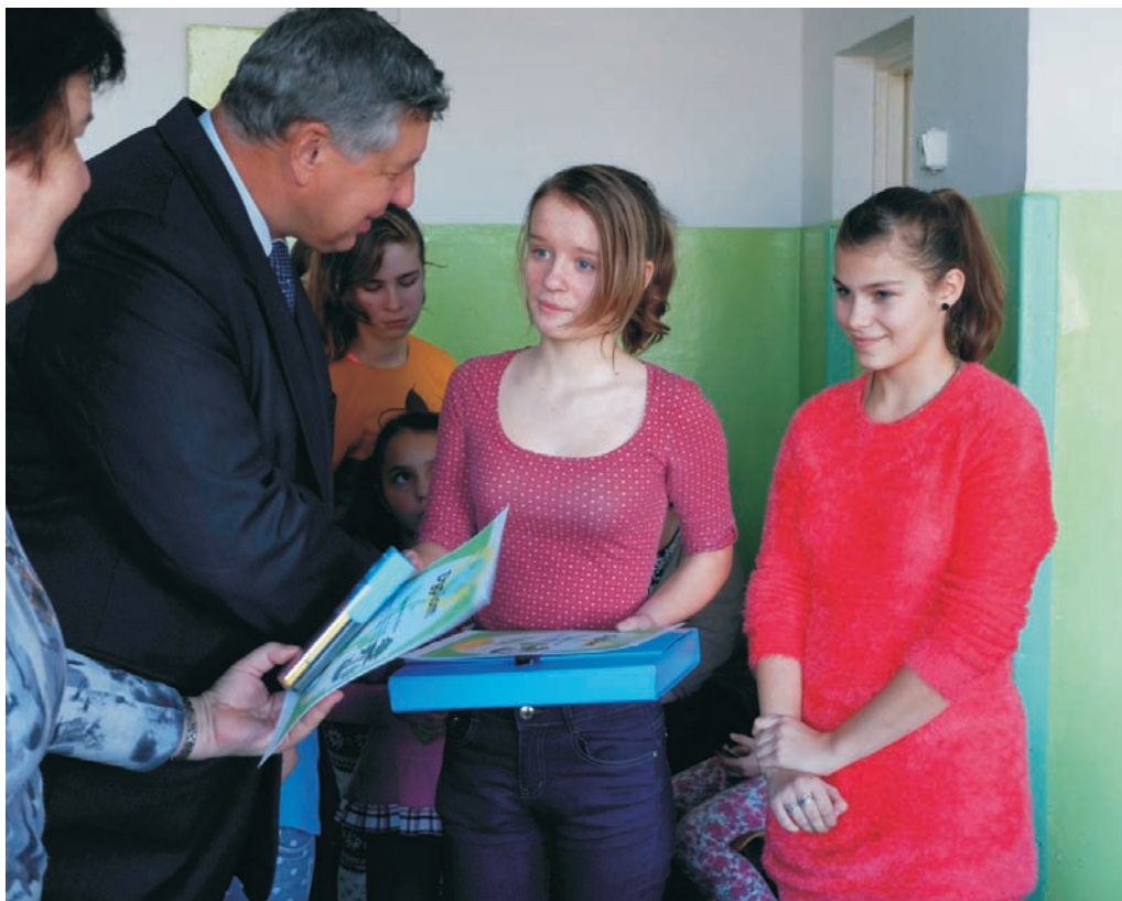
Odbiór nagrody

Zwycięzcy i wyróżnieni uczniowie otrzymali dyplomy oraz nagrody rzeczowe. Zakończony projekt niewątpliwie jeszcze bardziej pogłębił wśród naszych uczniów wiedzę i zainteresowania ekologią. Stali się oni bardziej wrażliwi na piękno otaczającej nas przyrody i świadomi zagrożeń, jakie powoduje człowiek poprzez nieprawidłowe użytkowanie zasobów przyrody. Na koniec chcielibyśmy pogratulować uczniom zaangażowania w realizacji zadań związanych z przeprowadzonym projektem oraz życzyć wszystkim wytrwałości w podjętych postanowieniach i zobowiązaniach na rzecz naszego środowiska, a także ekologicznego stylu życia.