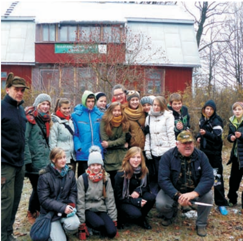
Spotkanie z myśliwym

stancje odżywcze, dlatego wykorzystywane są do dokarmiania zwierzyny leśnej. Wiele zwierząt otrzymuje dzięki temu w okresie zimy niezbędny pokarm, którego normalnie nie mogłoby samodzielnie znaleźć ze względu na trudne warunki pogodowe w trakcie tej pory roku. Dużą atrakcją wycieczki było ognisko, przygotowane przez