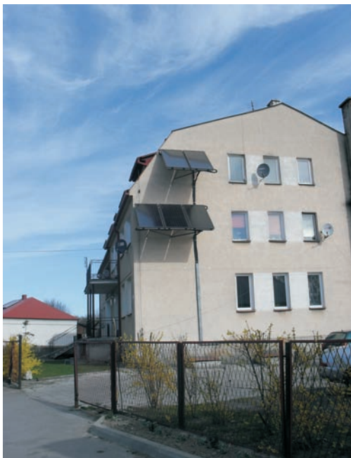
Kolektory słoneczne

Gmina Podedwórze stawia na ekologię, ponieważ już od paru lat stan środowiska w naszej miejscowości zmienia się na lepsze. Realizacja takich projektów jak „Czysta energia w Dolinie Zielawy”, „Czysta Energia w Dolinie Piwonii i Zielawy”, „Usuwanie materiałów zawierających azbest z terenu Gminy Podedwórze” sprawiły, iż stan środowiska naszej gminy z roku na rok się poprawia. Od 2006 roku w gminie Podedwórze zaczął powstawać system kanalizacji przyzagrodowej. W tym okresie zbudowano 282 przydomowe oczyszczalnie ścieków. W ramach tych projektów prowadzi się również instalacje kolektorów słonecznych, które zamieniają promieniowanie słoneczne na ciepło. W naszej gminie zainstalowano ich 151 na prywatnych budynkach oraz 2 instalacje na obiektach użyteczności publicznej. Takie pomysły skutecz-