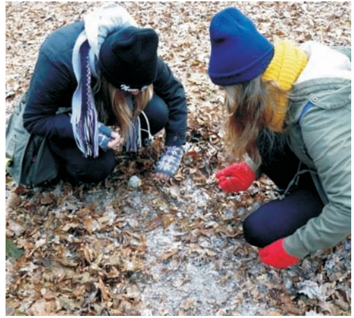
Zbieranie żołędzi

samych uczniów, którzy uskładali duży stos suchych gałęzi. Wysokie płomienie ogniska unosiły się nad tym ogromnym stosem. Każdy uczeń otrzymał długi kij i piekl swoją kieł-