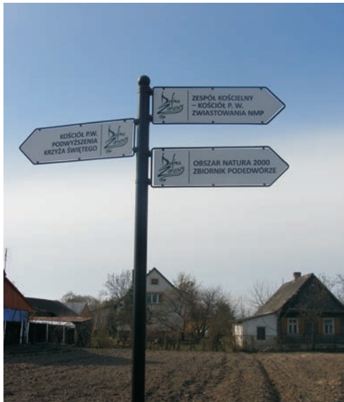
Oznaczenie obszaru Natura 2000

Natura 2000 to system ochrony przyrody wspólny dla całej Unii Europejskiej. Sieć obszarów Natura 2000 stworzono, by powstrzymać proces wymierania gatunków przyrodniczych roślinnych i zwierzęcych. Człowiek i przyroda na tym terenie