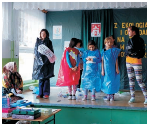
Występ kółka teatralnego