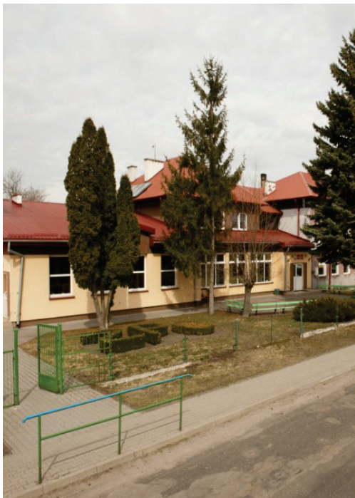
ZPO w Podedwórze

Mijający rok obfitował w gminie Podedwórze w działania z zakresu edukacji ekologicznej. Jednym z przedsięwzięć w tym zakresie był projekt „Z ekologią i odpadami