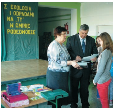
Odbiór nagrody

Wydawca: Gmina Podedwórze, 21-222 Podedwórze 44, tel. 83/379-50-11 e-mail: ug@podedworze.pl ; www.gmina-podedworze.pl przy współpracy z Zespołem Placówek Oświatowych w Podedwórze e-mail: podedworzez@op.pl tel. 83/379-50-13 www.zpo.podedworze.pl Przygotowanie do druku: Iwona Kolada Druk: "AWA-DRUK" Radzyń Podl., tel./fax 83/352-25-91, e-mail: biuro@awadruk.pl