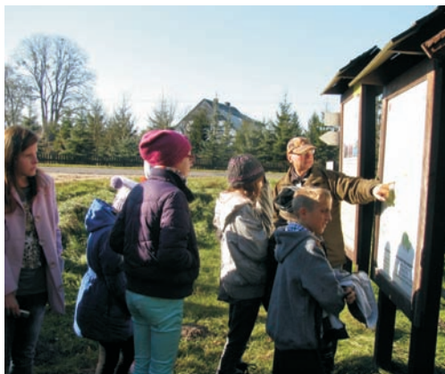
Wyjazd edukacyjny do PPN

pewne 4 - 7 metrowy) w całości z łatwością został zagłębiony w sąsiadujący z kładką teren, co dowiodło uczniom, z jak wielkim szacunkiem należy traktować obszar bagienny i torfowiskowy. Dużą atrakcją wyjazdu był także spacer ścieżką przyrodniczą o nazwie „ Dąb Dominik ”. Więcej o PPN możemy się dowiedzieć odwiedzając stronę www.poleskipn.pl .