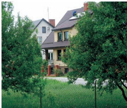
Kolektory słoneczne

nie przyczyniają się do ograniczenia zanieczyszczenia środowiska. Do końca 2032 r. trzeba usunąć wszystkie wyroby zawierające azbest z budynków użytkowych. Nasza gmina już o tym pomyślała i realizuje zadanie „Usuwanie materiałów zawierających azbest z terenu Gminy Podedwórze”, którego celem jest wyeliminowanie negatywnego oddziaływania azbestu na zdrowie mieszkańców gminy oraz likwidowanie oddziaływania azbestu na środowisko poprzez bezpieczne usunięcie i unieszkodliwienie wyrobów zawierających azbest. Od 2010 r. gmina Podedwórze korzystała z funduszy WFOSiGW na usuwanie wyrobów zawierających azbest. W latach 2011-2013 usunięto azbest z 55 budynków użytkowych. Gmina Podedwórze korzystała również ze środków Szwajcarsko-Polskiego Programu Współpracy SWISS. W ramach tego projektu w latach 2013-2014 azbest usunięto z 39 gospodarstw. Podejmowanym przez wspólnotę lokalną działaniom w zakresie ekologii przyświeca nadrzędny cel - czysta i ekologiczna Gmina Podedwórze, atrakcyjna dla turystów i mieszkańców.