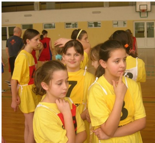
Dziewczyny zastanawiają się nad strategią meczu

Ruszyły rozgrywki zespołowych mini-gier sportowych.