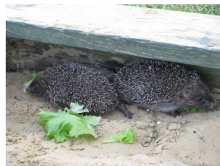
„Jeże” - zdjęcie, które zdobyło I miejsce