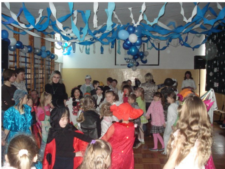
Wszyscy świetnie się bawili

Dnia 2 lutego 2009 roku o godzinie 9:00 rozpoczął się w naszej szkole Bal karnawałowy, w którym brały udział klasy „06-III. Dzieci były przebrane za postaci z bajek i baśni oraz innych wymyślonych przez siebie bohaterów. Stroje były różnorodne i kolorowe. Dominowały wróżki, księżniczki, rośliny i zwierzęta. Bal przebiegał następująco: