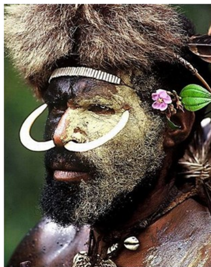
Opracowała: Patrycja Kaliszewska