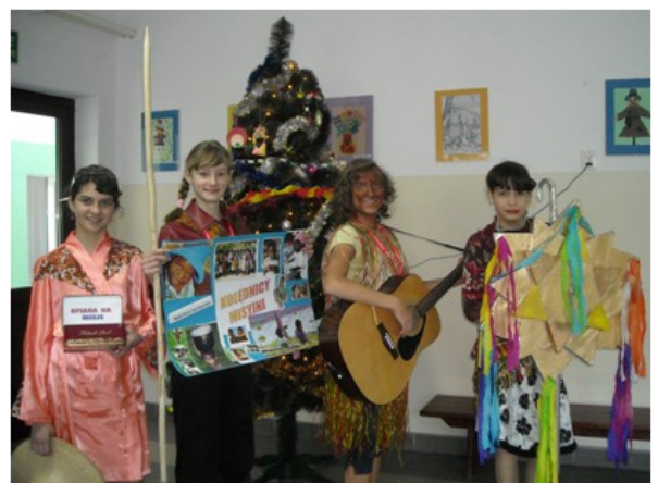
Dziewczęta podczas kolędowania.

Z gitarą, gwiazdą i kolędą na ustach chodzili kołędnicy od klasy do klasy, zwiastując narodziny Dzieciątka Jezus i składając życzenia. Uczniowie, nauczyciele oraz inni pracownicy szkoły nie żalowali symbolicznej złotówki. Dzięki ich hojności kołędnicy z Koła Caritas zebrali 191,10 zł . Pieniądze zostały wysłane na konto Papieskich Dzieł Misyjnych. ( O Papui Nowej Gwinei na s. 11). Redagowała: Patrycja Kaliszewska