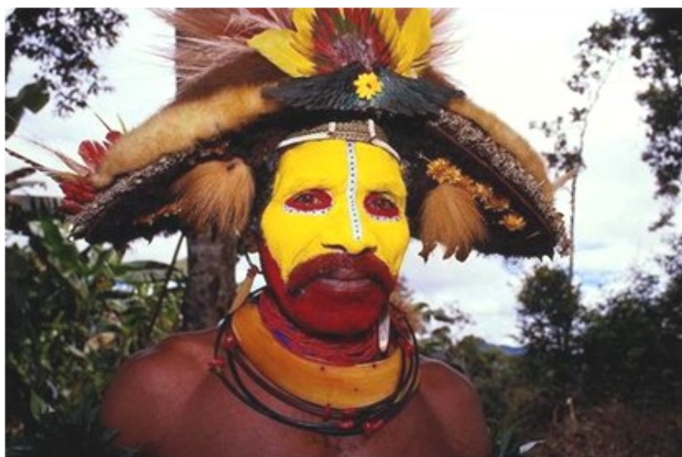
Rdzenni mieszkańcy Nowej Gwinei

Tradycyjną religią Papui Nowej Gwinei jest animizm, czyli wiara w duchy oraz silne zakorzeniony kult przodków. Dzięki działalności misyjnej dotychczasowe wierzenia powoli ustają. Misjonarze przynoszą także zdobycze europejskiej cywilizacji. Papuascy katolicy szczególną czią otaczają Matkę Bożą. Żywa jest pobożność maryjna w nabożeństwach majowych i modlitwa różańcowa. Ludzie wędrują w procesjach z figurkami Matki Bożej i różańcem, modląc się w swoich miejscowościach.