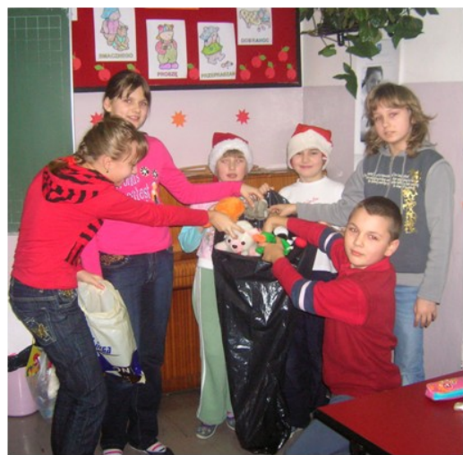
Uczniowie z klasy III i IV podczas zbiórki maskotek. Zabawki zbierali Mikołaje z klasy pierwszej.