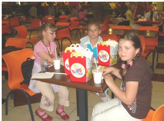
W Mc' Donaldzie

Minęło już południe i wszyscy byliśmy bardzo głodni. Nie mogliśmy się doczekać, kiedy wreszcie będzie Mc' Donald i „jedzonko z zabawkami”. Najedzeni do syta, poszliśmy do kina trójwymiarowego na film pod tytułem „Pod taflą oceanu”. Była to zapierająca dech w piersiach podwodna przygoda w egzotycznych i pełnych niezwykłego życia wodach Australii, Indonezji i Papui Nowej Gwinei.