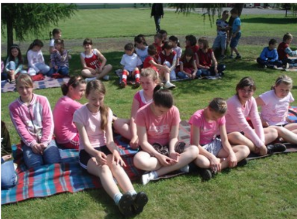
Skupiona drużyna dziewcząt z kl. V