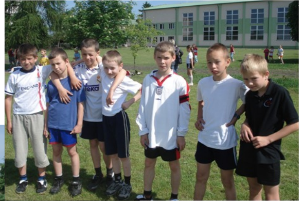
Drużyna chłopców kl. III