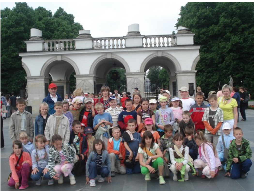
Przed Grobem Nieznanego Żołnierza

Widzieliśmy autentyczne obrazy Jana Matejki, Rembranta, Canaletta. Tam na bulwarach zamkowych zobaczyliśmy jak wygląda nagrywanie telewizyjnej „Majówki na trawie” i spotkaliśmy sławnego aktora Krzysztofa Tyńca (Kóło fortuny).