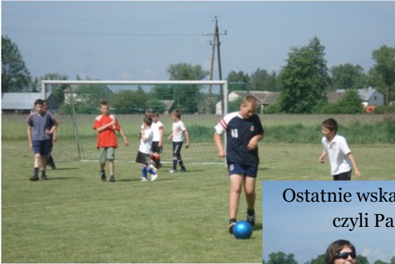
Rozgrzewka chłopców z kl. VI