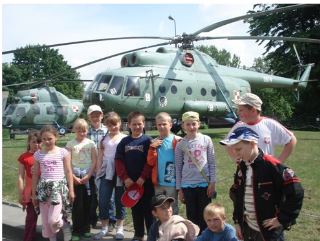
W Muzeum Wojska Polskiego

z Muzeum Wojska Polskiego, gdzie oglądaliśmy zabytkowe samoloty, czołgi, działa przeciwlotnicze, armaty. Najbardziej zachwyceni tymi eksponatami, byli chłopcy. Potem udaliśmy się Starówkę. Przed Grobem Nieznanego Żołnierza widzieliśmy zmianę warty. Zwiedzanie rozpoczęliśmy od wizyty w Zamku Królewskim. Tam oglądaliśmy piękne komnaty, salę tronową, salę senatorską, poselską. Wszystkim pobałał się tron króla Stanisława Augusta Poniatowskiego, przed którym przedstawiono projekt Konstytucji 3 Maja w 1791 roku.