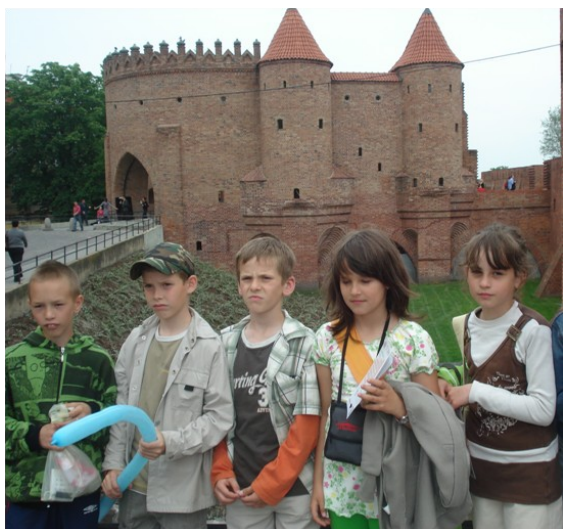
Na Starym Mieście