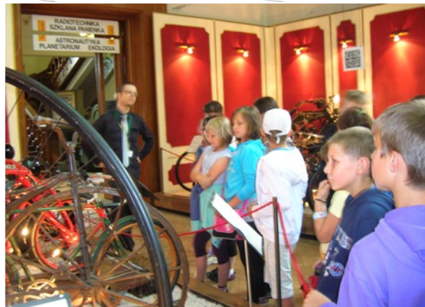
W Muzeum Techniki

Trzecim miejscem był Aqua park. Bawiliśmy się ekstra