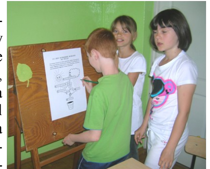
Uzupełnianie zadania przez klasę 3

W międzyczasie odbywały się konkurencje sprawnościowe, polegające na zgniataniu kul gazetowych na czas, segregowaniu odpadów: plastiku, makulatury, metalu. Za prawidłowo udzieloną odpowiedź drużyna otrzymywała punkty – listki dębu. Równocześnie odbywał się quiz dla publiczności, z którego punkty również przekazywane były dla klasowej drużyny. Wszystkie konkurencje poprzedzane były śpiewem piosenek o tematyce ekologicznej przez poszczególne klasy. Po zagorzalej dogrywce pomiędzy klasą II i III, wygrała klasa III.