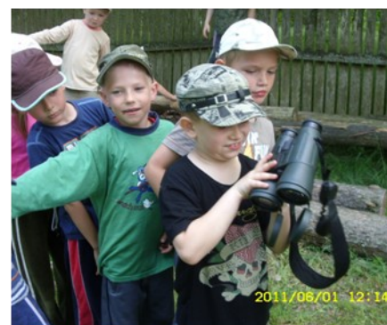
Oddział przedszkolny i klasa 06 w Domku Myśliwskim w Woroncu