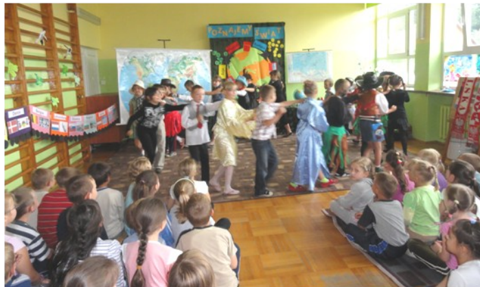
Pierwszaki podczas tańca