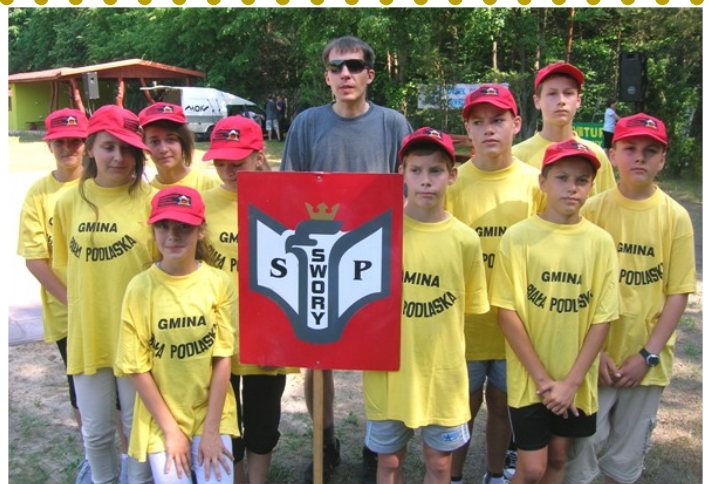
Drużyna z panem dyrektorem