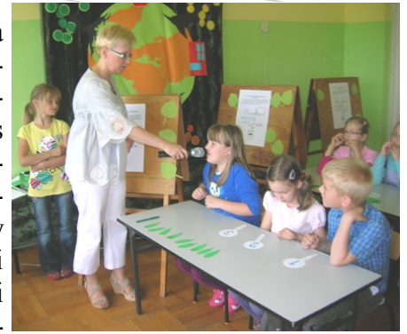
Pierwszoklasiści wykazali się dużą wiedzą

Pytania dotyczyły znajomości otaczającego nas świata roślinnego i zwierzęcego. Zawodnicy odgadali nazwy ptaków i zwierząt, musieli wykazać się wiedzą na temat: co jest potrzebne roślinie do życia, co to jest smog, jak należy zachowywać się w lesie, w parku narodowym, co to jest ekologia? Ponadto rozpoznawali odgłosy przyrody, uczestniczyli w zgaduj zgaduli.