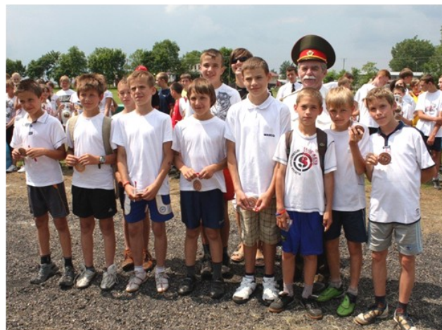
Pamiątkowe zdjęcia obu drużyn

16.06.2011r. w Łomazach odbyły się zawody sportowo- pożarnicze. Podróż na miejsce zawodów minęła nam w dobrych humorach. W zawodach brało udział 11 drużyn. Naszą szkołę reprezentowały dwie drużyny - dziewcząt i chłopców.