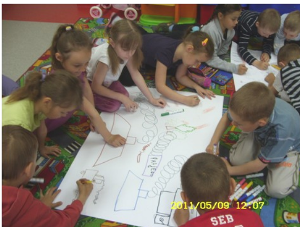
Dzieci podczas zajęć wykonywały prace plastyczne i książeczki o bohaterze Dinku