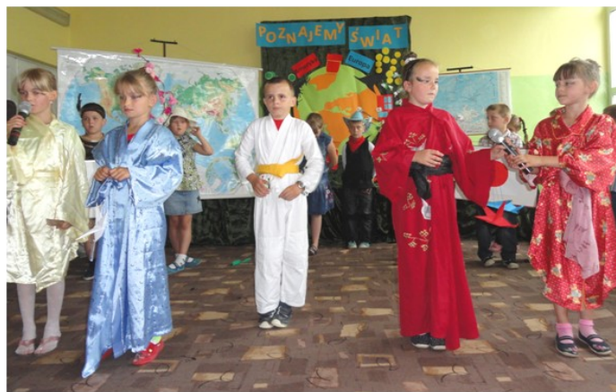
Podczas pobytu w Japonii z zakończeniem podróży w Polsce