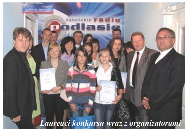
Laureaci konkursu wraz z organizatorami

Miło nam, że jury postanowiło wyróżnić także naszą gazetkę „TYSIĄCLATKA” specjalną nagrodą dyrek-