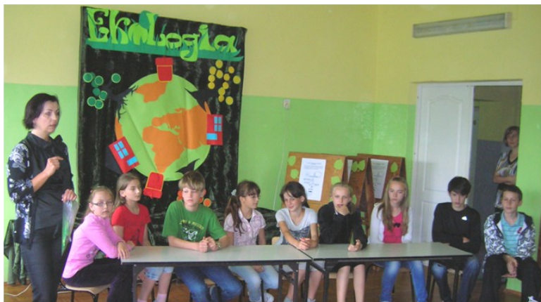
Rywalizujące drużyny z klasy IV-VI