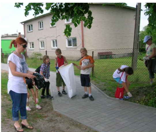
Klasa III i VI w Woroncu

WORONIEC – KLASA III (E30, KAPLI- CA, KLUB), KLASA VI CELUJKI –KLASA IV POJELCE – KLASA V