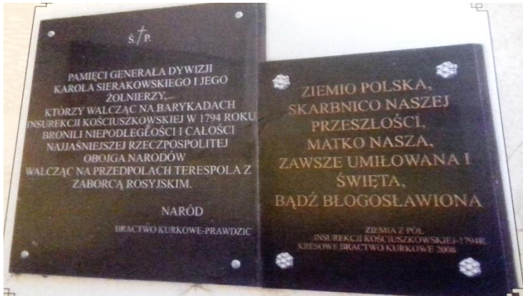
Tablica pamiątkowa umieszczona na kościele Św. Trójcy w Terespolu