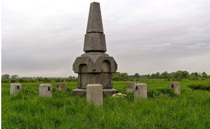
Pomnik w Polatyczach