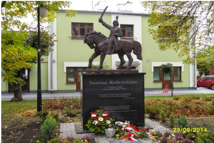
Pomnik Tadeusza Kościuszki w Terespolu