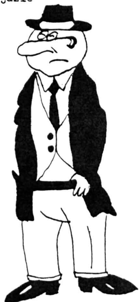
Rys. Monika Bankowska