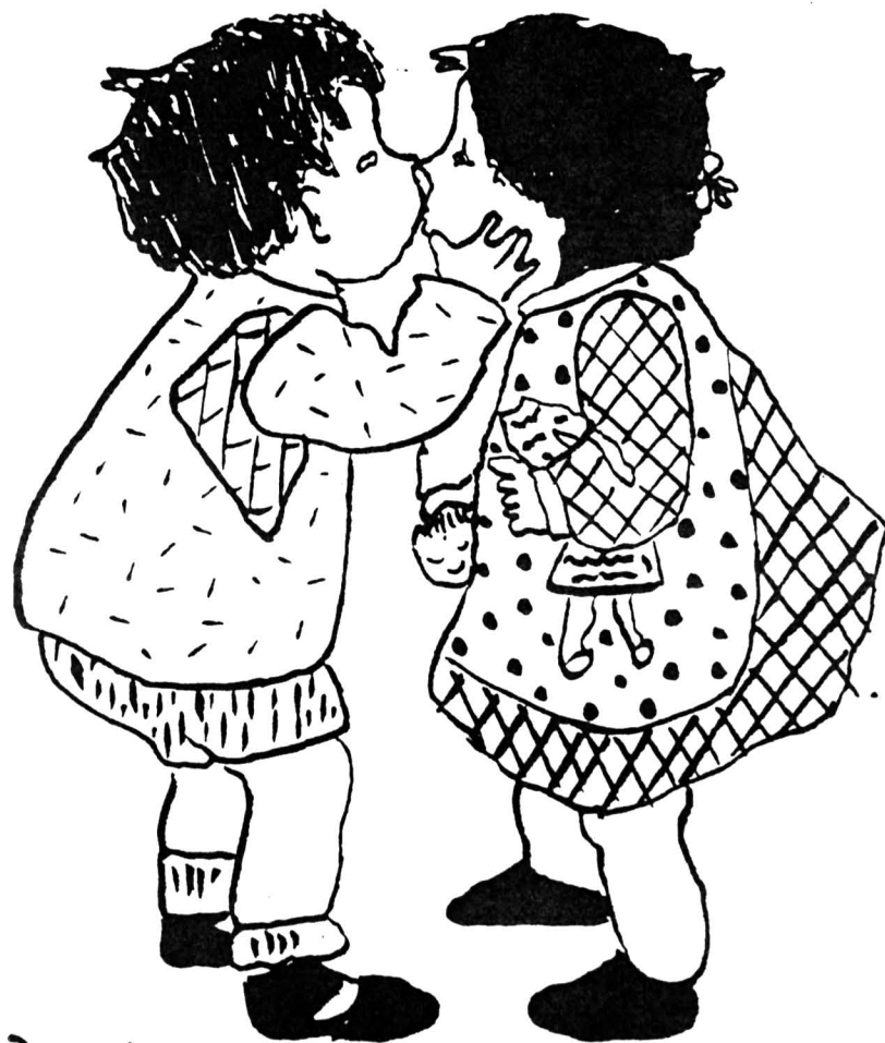
Rys. Agnieszka Zelisko