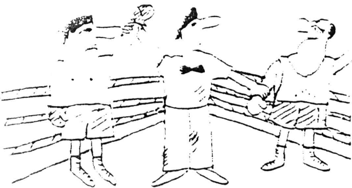
Rys. Ewa Niczyporuk

Uczeń kl. VIIIb naszej szkoły z okazji Międzynarodowego Dnia Dziecka wszedł do drogerii i chciał kupić perfumy: - Chciałbym kupić perfumy, ale nie wiem - Czy to mają być perfumy dla Ciebie, czy to ma być coś droższego?