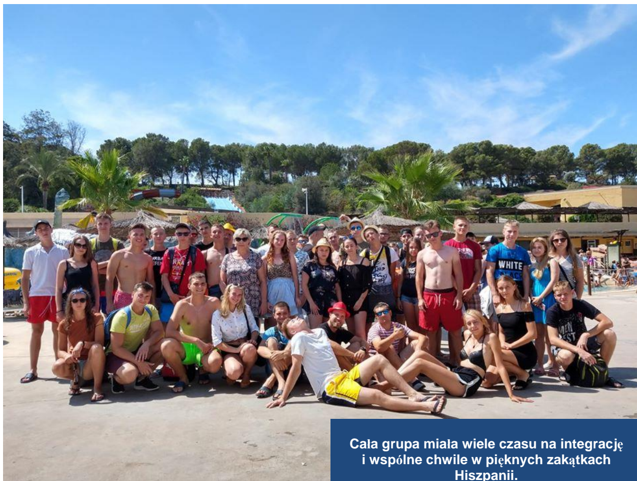
Cala grupa miała wiele czasu na integrację i wspólne chwile w pięknych zakątkach Hiszpanii.