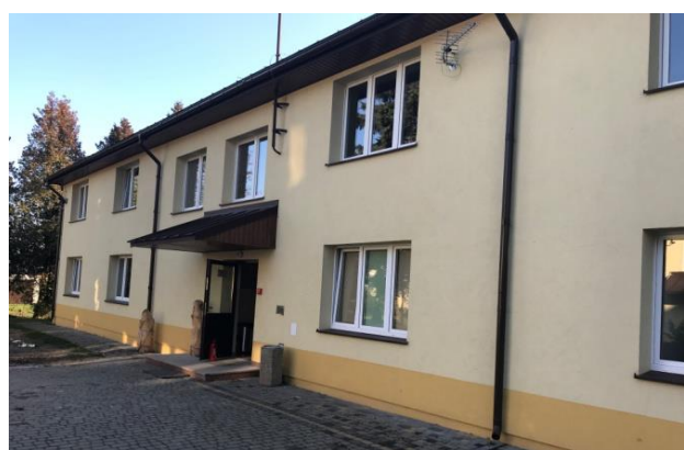
Internat żeński