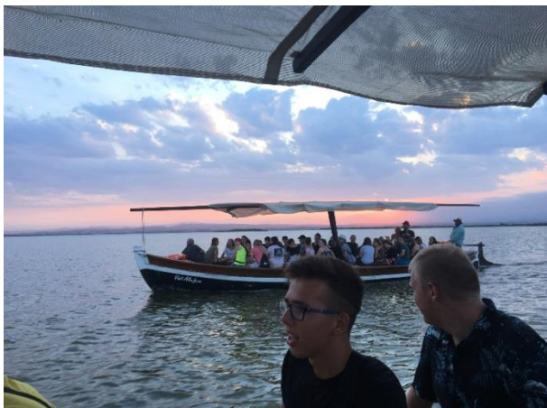
Hiszpańskie krajobrazy zapierały dech w piersiach wszystkich uczestników praktyk.