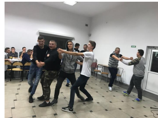
Dobrej zabawie nie było końca.