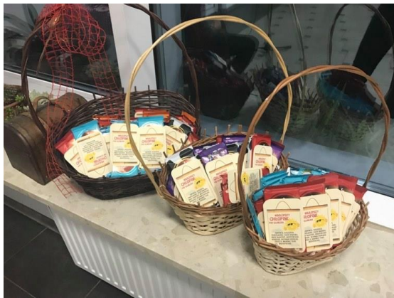
Słodkie upominki dla naszych chłopaków.