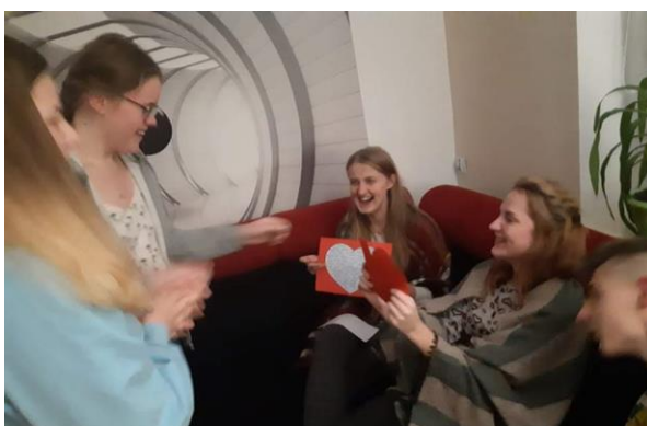
Wszyscy chcieli poznać imię swojego wybranka lub wybranki serca.