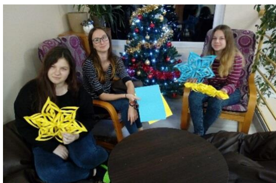
fot. Dziewczęta z grupy III podczas wykonywania dekoracji bożonarodzeniowych.

Bardzo miłym akcentem było wręczenie pracownikom szkoły świątecznych ozdób z szyszek, wykonanych własnoręcznie przez mieszkańców internatu. Wszyscy uczniowie i kadra pedagogiczna podzielili się opłatkiem i złożyli sobie życzenia. Następnie przyszedł czas na skosztowanie wigilijnych przysmaków. Oby ten radosny czas pokoju, towarzyszył każdemu w nadchodzącym Nowym Roku.