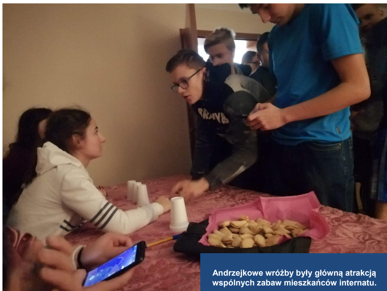
Andrzejkowe wróżby były główną atrakcją wspólnych zabaw mieszkańców internatu.