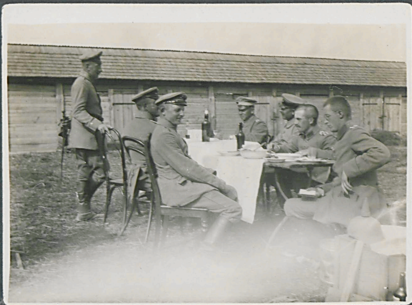
Cicibor Wielki, 8.15: Nach dem Mittag- essen.