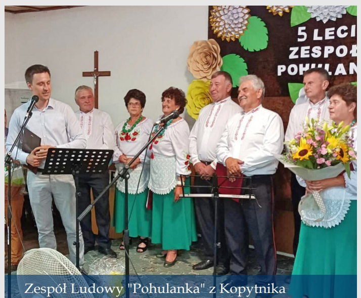
Zespół Ludowy "Pohulanka" z Kopytnika

Dla swoich gości zaśpiewali również sami jubilaci, a po występie zespół otrzymał listy gratulacyjne i upominki. Na uroczystości nie zabrakło jubileuszowego tortu, którym częstowani byli wszyscy uczestnicy tego wyjątkowego święta.