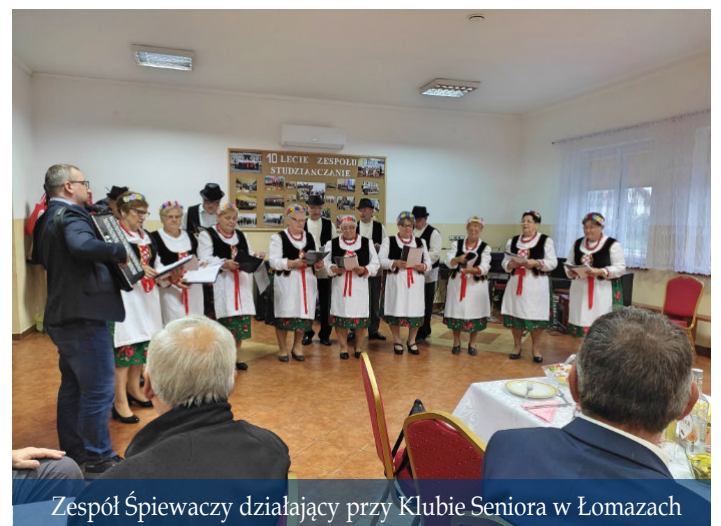
Zespół Śpiewaczy działający przy Klubie Seniora w Łomazach

Do realizowanego przez Gminę Łomazy projektu wciąż mogą dołączyć kolejni chętni, jest jeszcze kilka wolnych miejsc. Wystarczy zadzwonić pod nr tel. 83 341 70 03 .