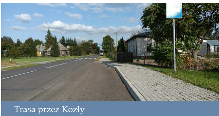
Trasa przez Koszaly

Na jakie inwestycje w przyszłym roku pozwoli obecna sytuacja finansowa Gminy? W jakim kierunku będzie podążała w kolejnych latach?