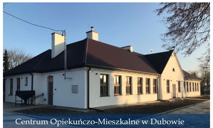
Centrum Opiekuńczo-Mieszkalne w Dubowie

A przed nami kolejna perspektywa finansowa UE 2021-2027 i otwierające się nowe możliwości rozwojowe. Jesteśmy do niej przygotowani, a obecnie pracujemy nad Zintegrowaną Strategią Rozwoju Obszaru Doliny Zielawy na lata 2020 – 2030 wspólnie z gminami Jabłoń, Milanów, Podedwórze, Rossosz, Sosnówka i Wisznice.