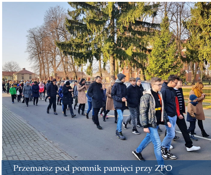
Przemarsz pod pomnik pamięci przy ZPO