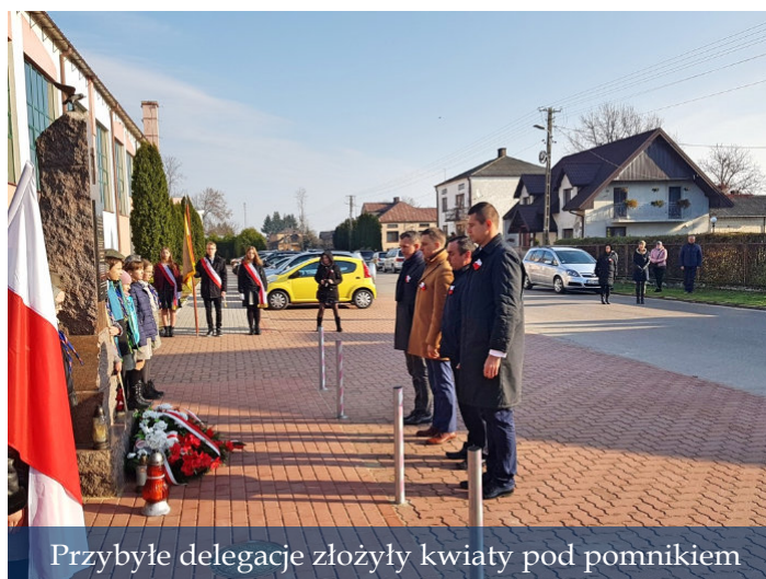
Przybyłe delegacje złożyły kwiaty pod pomnikiem