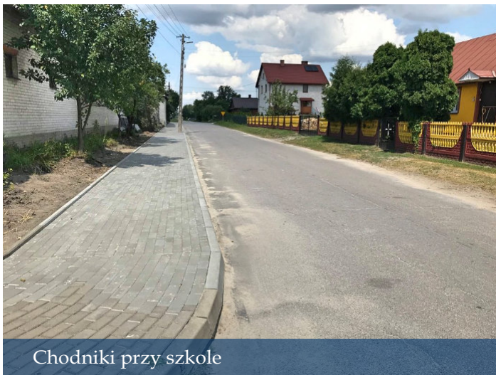
Chodniki przy szkole

Pomimo obaw i zmagania ze skutkami pandemii przyznaję, że rok 2021 był dobry dla naszej gminy. Z dużą obawą patrzyliśmy na wzrost cen inwestycji, przetargi oraz zwiększone koszty zapewnienia zadań własnych gminy, które wpłynęły na wzrost wydatków, równoległe poszukiwaliśmy oszczędności w wydatkach bieżących.