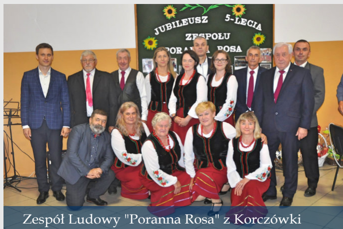
Zespół Ludowy "Poranna Rosa" z Korczówki

Jubilaci przyjęli życzenia dalszej pomyślnej działalności i sukcesów, a występy gości sprawiły, że ten jubileusz na długo zapadnie w pamięci wszystkich jego uczestników.