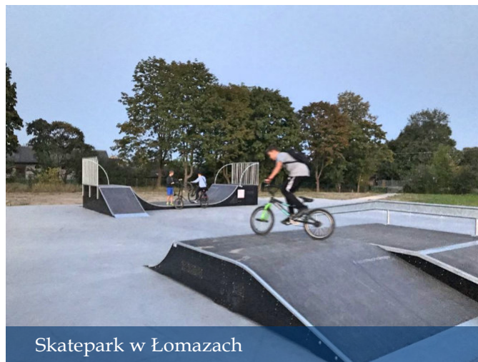
Skatepark w Łomazach

Już dziś podejmujemy działania, które będziemy chcieli realizować w naszej gminie przez najbliższe 2 lata. Dużym wsparciem będą środki w wysokości ponad 16 mln zł w ramach Polskiego Ładu oraz Rządowego Funduszu Inwestycji Lokalnych. Plany na przyszły rok są ambitne, wydatki zaplanowano na kwotę blisko 28 mln zł. Zostaną one przeznaczone m.in. na budowę ośmiu dróg, modernizację Stacji Uzdatniania Wody, przebudowę i termomodernizację budynku dawnej bazy Spółdzielni Usług Rolniczych na gminną bazę komunalną oraz inkubator przedsiębiorczości oraz dalsze prace przy miejscowej remizie w Łomazach. Planujemy powstanie chodnika w Huszczy, remont dróg powiatowych, ul. Małobrzezkiej i Budzyń oraz budowę nowego oświetlenia ulicznego. Docieplenia doczeka się świetlica w Stasiówce, nowego dachu szkoła w Huszczy, do Centrum w Dubowie zostanie zakupiony samochód do przewozu osób niepełnosprawnych. Ponad 425 tys. zł to kwota funduszu sołectkiego, która zostanie przeznaczona na dokumentację lub remont dróg gminnych, wyposażenie i remonty świetlic, tabliczki do oznaczenia numerów domów, działalność kulturalną, wykonanie placu zabaw dla dzieci i nowe oświetlenie uliczne.