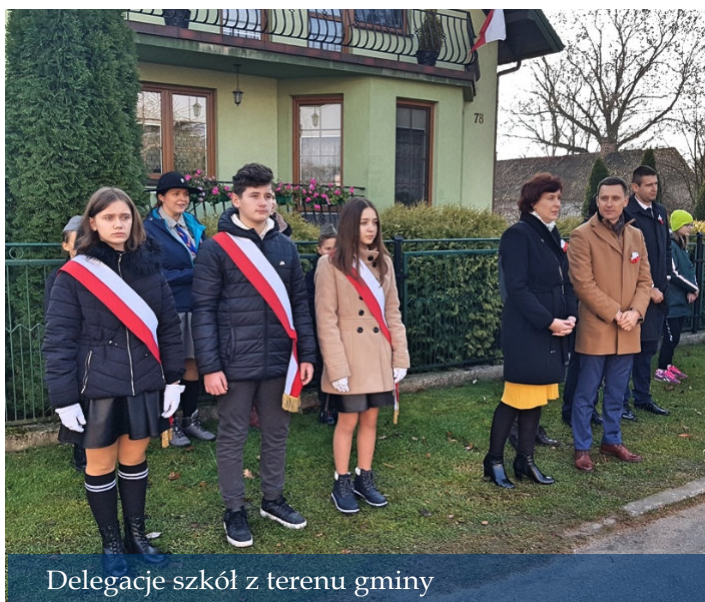
Delegacje szkół z terenu gminy

W przeddzień tego wyjątkowego, najważniejszego dla wszystkich Polaków święta, również uczniowie placówek oświatowych wzięli udział w upamiętnieniu wydarzeń sprzed 103 lat. To bardzo ważne, by młode pokolenie było wychowywane w duchu patriotyzmu i pamięci o tych, którzy zginęli w obronie wolnej Ojczyzny, takiej, w której dziś dane jest nam bezpiecznie żyć.