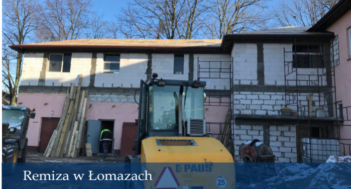
Remiza w Łomazach

Gmina od lat wspiera lokalne inicjatywy, głównie poprzez organizację konkursów na dofinansowanie zadań z zakresu upowszechniania kultury i sportu dla organizacji pozarządowych. Doposażamy w nowoczesny sprzęt dziesięć jedno-