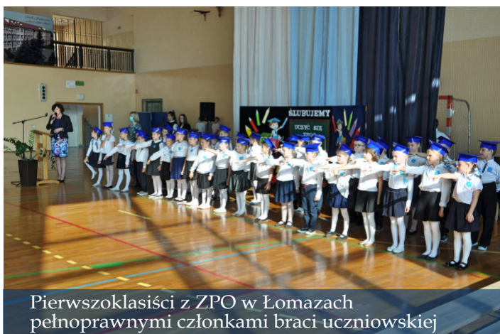
Pierwszoklasiści z ZPO w Łomazach pełnoprawnymi członkami braci uczniowskiej

nała aktu pasowania. Tym samym pierwszaki zostały włączone do społeczności uczniowskiej. Każdy uczeń otrzymał pamiątkowy dyplom oraz upominki od wójta, rady rodziców, starszych kolegów i swoich rodziców. Na zakończenie dnia pełnego wrażeń rodzice przygotowali dzieciom pyszny tort i sękacze.