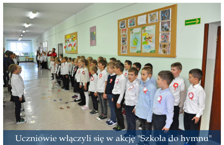
Uczniowie włączyli się w akcję "Szkoła do hymnu"