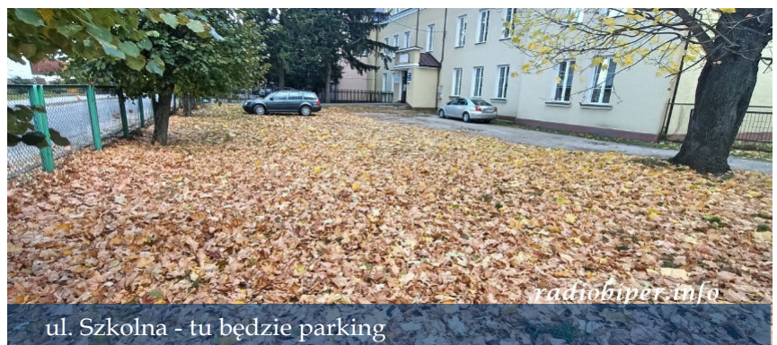
ul. Szkolna - tu będzie parking

Trwa przebudowa i remont remizy w Łomazach, prace potrwają do czerwca 2022 r. Budynek zostanie rozbudowany w kierunku kotłowni, powstanie dodatkowa kondygnacja, winda dla osób starszych i niepełnosprawnych oraz parking. Prace poprawiające stan budynków dotyczyły też remiz w Kozłach i Lubence oraz świetlicy w Kopytniku. Zakupiliśmy samochód do przewozu osób niepełnosprawnych, a dzięki realizacji Programu Profilaktycznego "Przeciwko Boreliozie" niemal 500 mieszkańców poznało swój stan zdrowia i odpowiednio rozpoczęło prawidłowe leczenie. Uruchomiliśmy również dla mieszkańców Punkt informacyjny Programu "Czyste Powietrze".