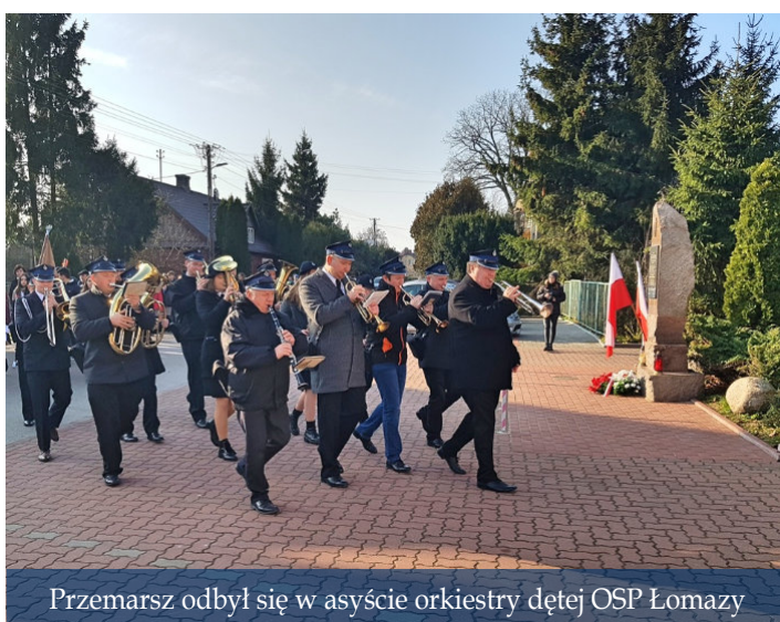
Przemarsz odbył się w asyście orkiestry dętej OSP Łomazy

Spółeczność Gminy Łomazy rozpoczęła obchody Narodowego Święta Niepodległości mszą świętą w intencji Ojczyzny i jej obrońców w kościele parafialnym pw. św. Apostołów Piotra i Pawła w Łomazach. Następnie uczestnicy uroczystości w asyście Orkiestry Dętej Ochotniczej Straży Pożarnej w Łomazach przemaszerowali pod pomnik przy Zespole Placówek Oświatowych, gdzie delegacje samorządu oraz gminnych instytucji i organizacji złożyły wieńce i zapaliły światełko pamięci.