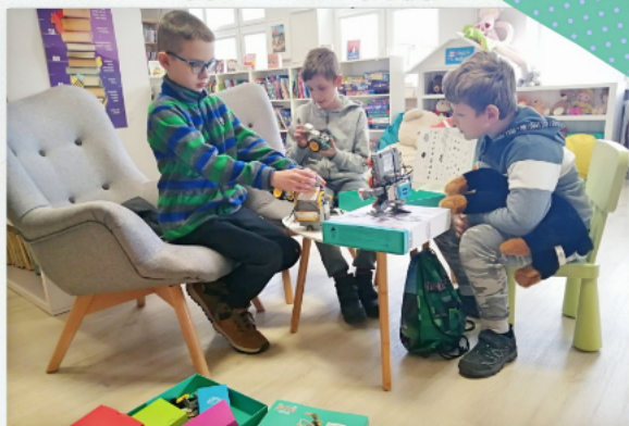
KODOWANIE I PROGRAMOWANIE W GBP