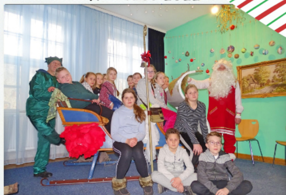
WYJAZD DO ŚWIĄTECZNEJ WIOSKI W KOSZOŁACH