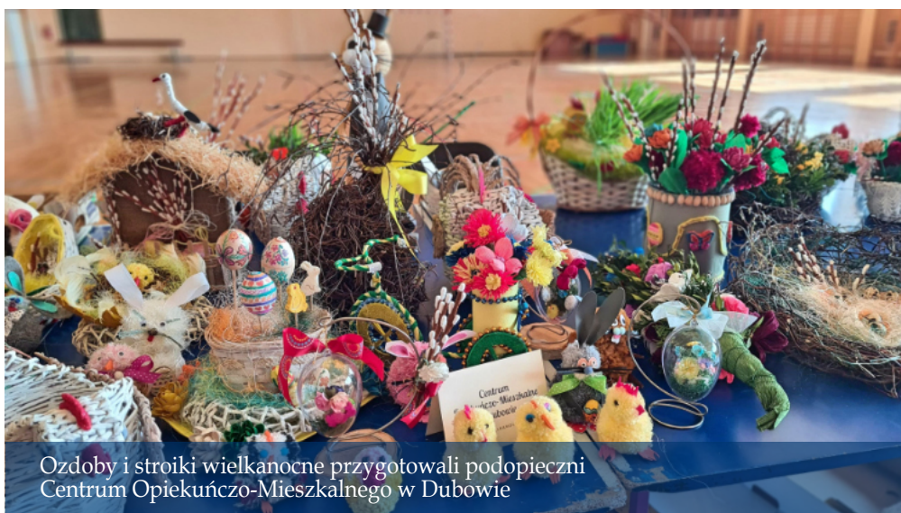
Ozdoby i stroiki wielkanocne przygotowali podopieczni Centrum Opiekuńczo-Mieszkalnego w Dubowie