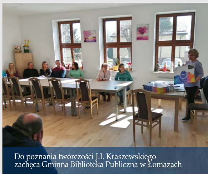
Do poznania twórczości J.I. Kraszewskiego zachęca Gminna Biblioteka Publiczna w Łomazach