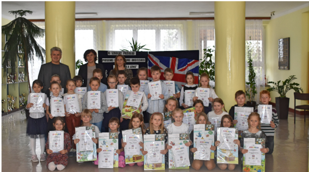
W konkursie z językiem angielskim zmierzyło się 29 uczniów klas I-III