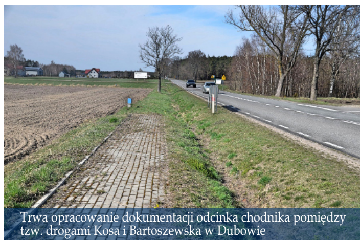
Trwa opracowanie dokumentacji odcinka chodnika pomiędzy tzw. drogami Kosa i Bartoszevska w Dubowie

Trwają także prace nad opracowaniem dokumentacji projektowej i wyłonienia wykonawcy na wykonanie nakładki asfaltowej od ul. Lubelskiej (skrzyżowanie z ul. Sportową przy stadionie sportowym) w Łomazach w stronę miejscowości Jusaki-Zarzeki.