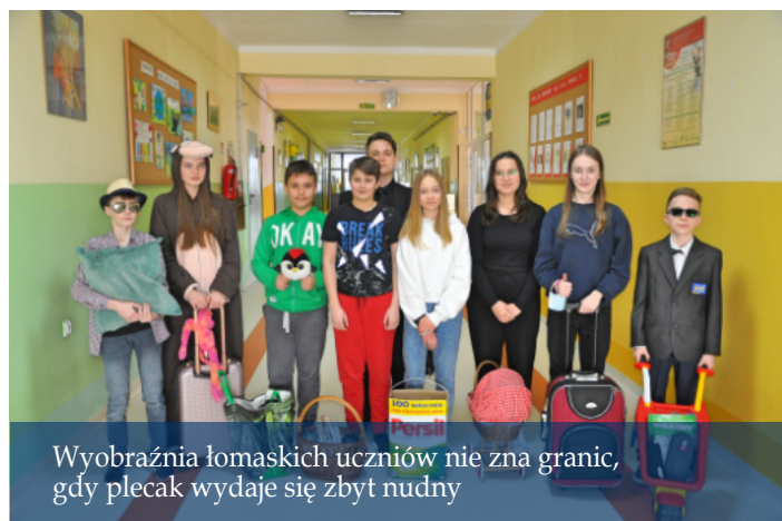
Wyobraźnia łomaskich uczniów nie zna granic, gdy plecak wydaje się zbyt nudny

Właściwie niezadowolona mogła być tylko jedna postać, mianowicie Pani Zima, której kukła, w myśl ekologii i niezatapiania sztucznych elementów w rzece, spłonęła na ogniskowym stosie.