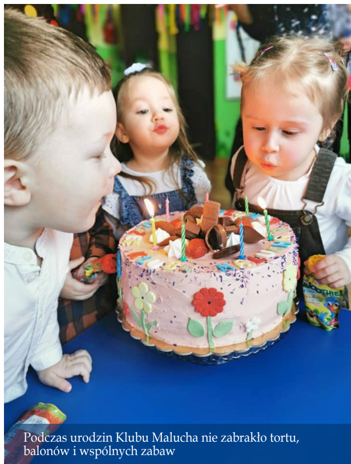
Podczas urodzin Klubu Malucha nie zabrakło tortu, balonów i wspólnych zabaw