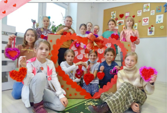
ZAJĘCIA PLASTYCZNE "WALENTYNKA OD SERCA"