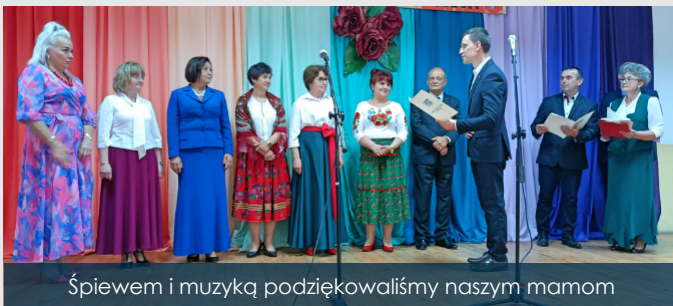
Śpiewem i muzyką podziękowaliśmy naszym mamom

21 maja w Dubowie odbył się koncert z okazji Dnia Matki pod hasłem "Dla Ciebie Mamo", w którym wystąpiło osiem zespołów śpiewaczych, zarówno z gminy Łomazy jak i terenu powiatu bialskiego. W wydarzeniu wzięli udział mieszkańcy Dubowa i jego okolic, władze gminy i ich zaproszeni goście.