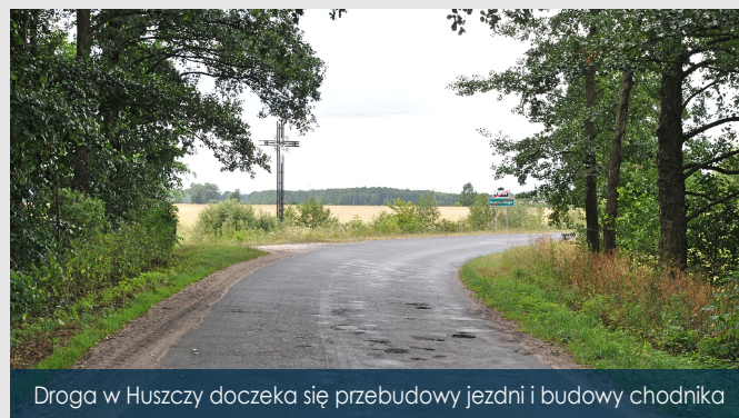
Droga w Huszcy doczeka się przebudowy jezdni i budowy chodnika

Przewidywana wartość inwestycji sięga 7.500.000 zł, a termin jej realizacji został zaplanowany na 2022/2023 r.