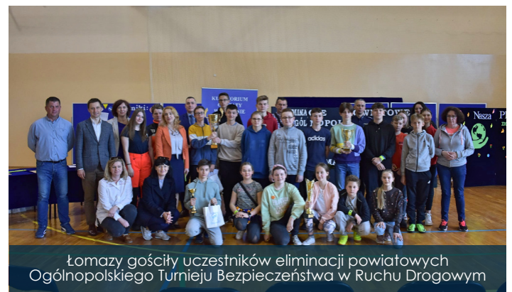
Łomazy gościły uczestników eliminacji powiatowych Ogólnopolskiego Turnieju Bezpieczeństwa w Ruchu Drogowym

Zwycięzcy otrzymali puchary oraz nagrody ufundowane przez Wojewódzki Ośrodek Ruchu Drogowego, Wójta Gminy Łomazy, Automobilklub Białkopodlaski oraz Senatora RP Grzegorza Biereckiego. Wyłonieni finaliści reprezentowali 21 maja powiat bialski na etapie wojewódzkim Turnieju Bezpieczeństwa w Ruchu Drogowym w Wojewódzkim Ośrodku Ruchu Drogowego w Białej Podlaskiej. W tym roku niestety zabrakło nam szczęścia, ale składamy gratulacje zawodnikom z Janowa Podlaskiego, którzy zajęli czwarte miejsce w klasyfikacji.