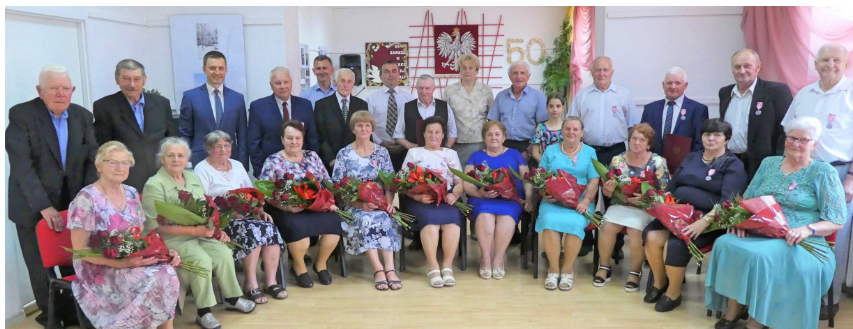
Jubileusz 50-lecia pożycia małżeńskiego obchodziło 11 par z terenu gminy

Galeria zdjęć dostępna jest na stronie Urzędu Gminy.