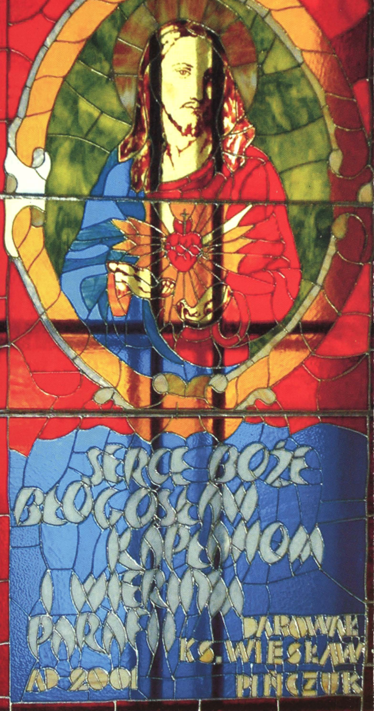
Witraż Najświętszego Serca Pana Jezusa w oknie prezbiterium kościoła parafialnego w Radzikowie Wielkim