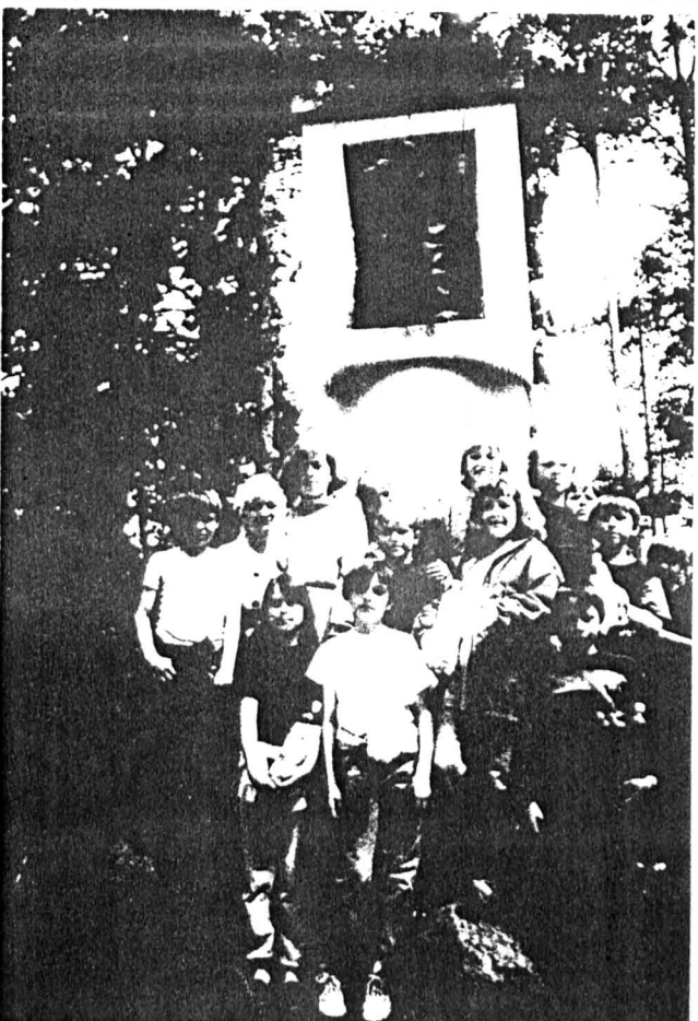
Pod stacją piątą drogi krzyżowej w Serpelicach.

Nr 4 CZERWIEC - 1995 cecha 30 gr. Gazetka Samorządu Szkolnego - Szkoły Podstawowej w Grabarkowie